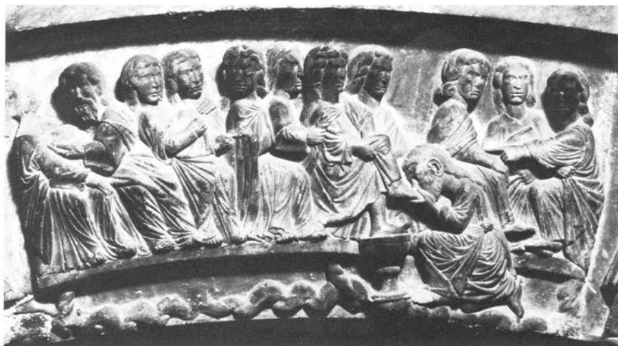
Radovanov sljedbenik, reljef Pranja nego na drugom luku iznad lunete

S obzirom na temu koju smo gore otvorili treba ukazati na jedan detalj koji nam možda može pomoći u čitanju prizora. Svi interpreti su primijetili činjenicu da Krist ne pere noge Petru već jednom golobradom apostolu. Ali, treba reći da su i svi ostali apostoli obrijani, i to možda zato da se imenuje jedini bradati lik — sv. Petar. 89 Dok su svi apostoli usredotočeni na Kristov čin, Petar se violentnom gestom okrenuo pre-