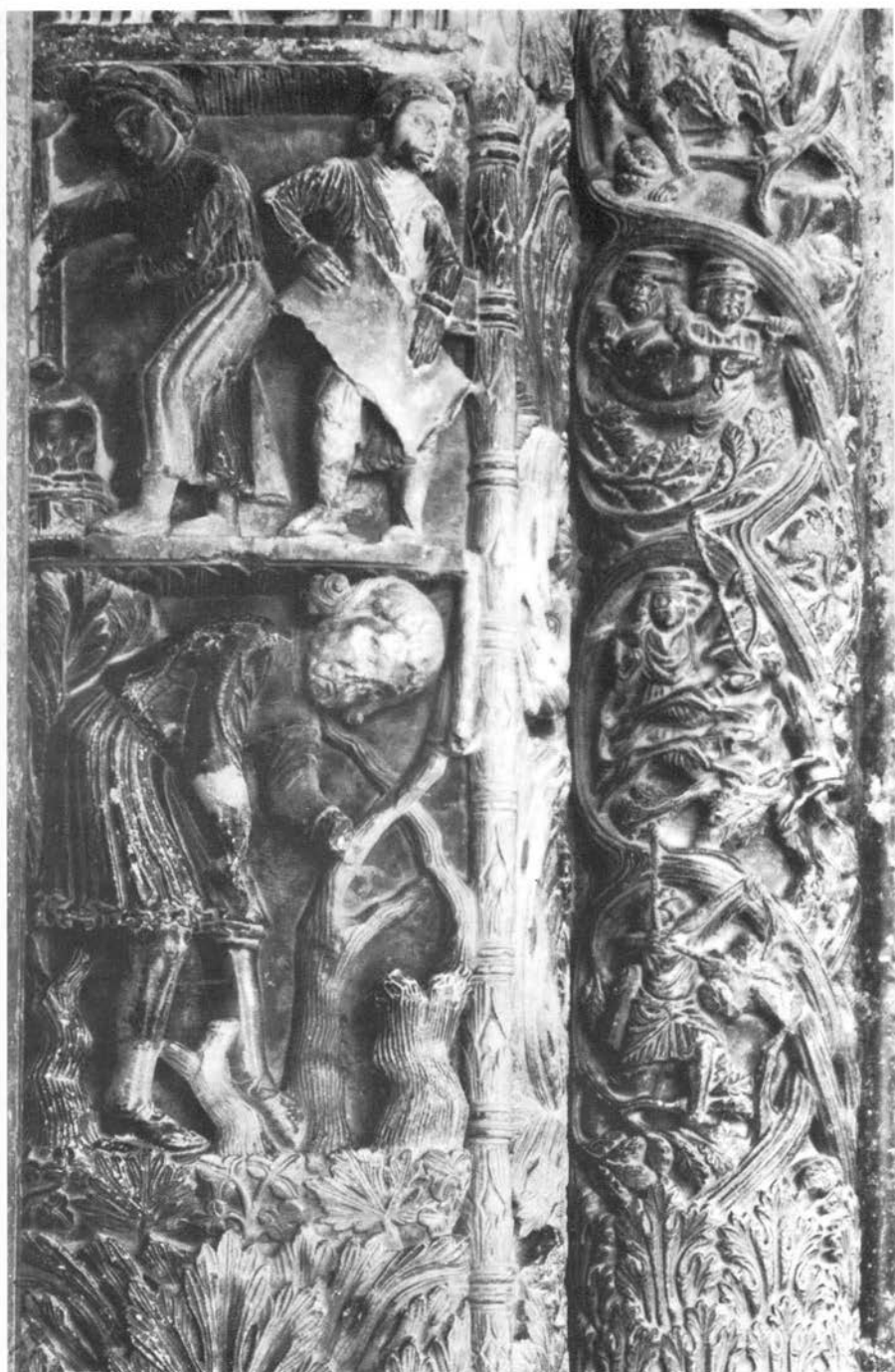
Radovanov sijedbenik, prikaz Veljače na unutrašnjem pilastru lijevo uz vrata