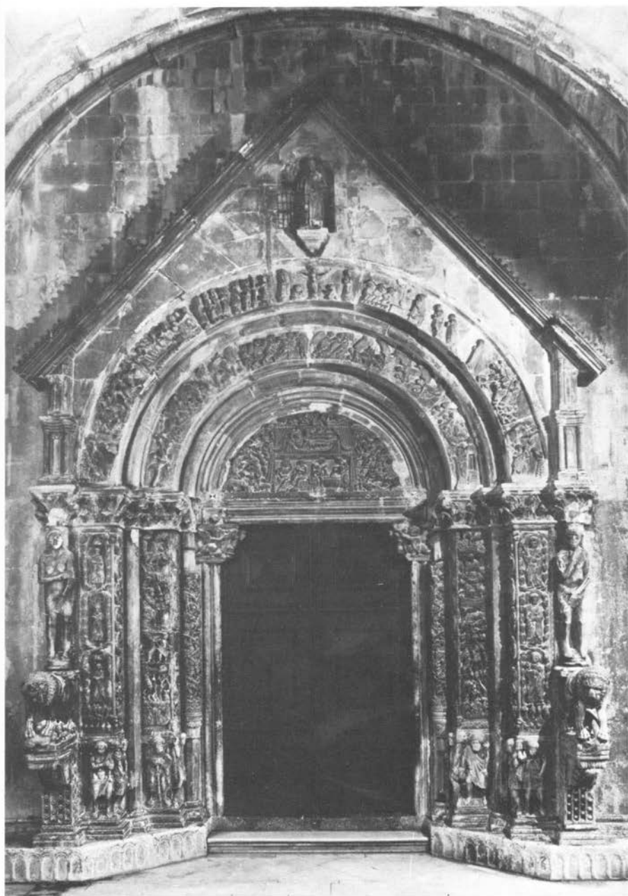
Trogir, zapadni portal katedrale sv. Lovre