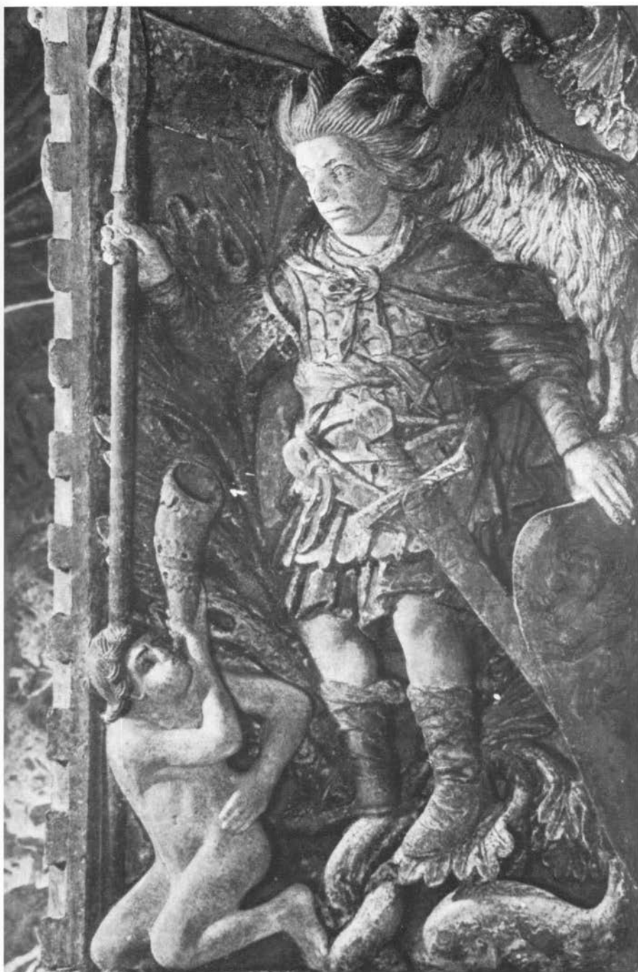
Venecija, glavni portal bazilike sv. Marka, prikaz Ožujka na »Arco dei mesi«