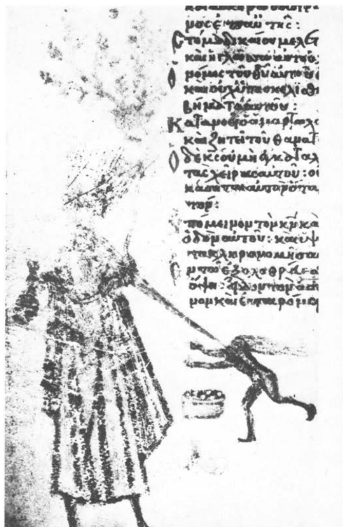
Moskva, Povijesni muzej, Psalter Chludov, Patrijarh Jannis ikonoklast i demon (fol. 35 v )

M. Schapiro je pretpostavljao da personifikacija vjetera za Ožujak može biti invencija karoliniških minijaturista. 36 L. Pressouyre prati genezu prikaza personifikacije Vjetera u srednjovjekovnoj bizantskoj i zapadnoj umjetnosti u nizu inačica i u različitim ikonografskim kontekstima. Zadržava se posebno na specifičnom atributu — nakostriješenim kosama (u čemu vidi antičku tradiciju), koji u srednjem vijeku obično označava demonski karakter lika koji ga nosi. 37