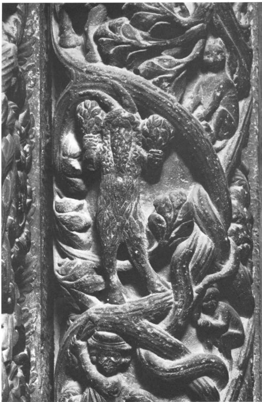
Majstor Radovan, prikaz na poluoblom stupu lijevo uz vrata