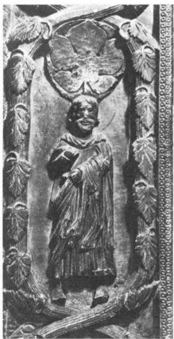
Majstor Eve, prikaz sv. Bartolomeja uz kip Eve