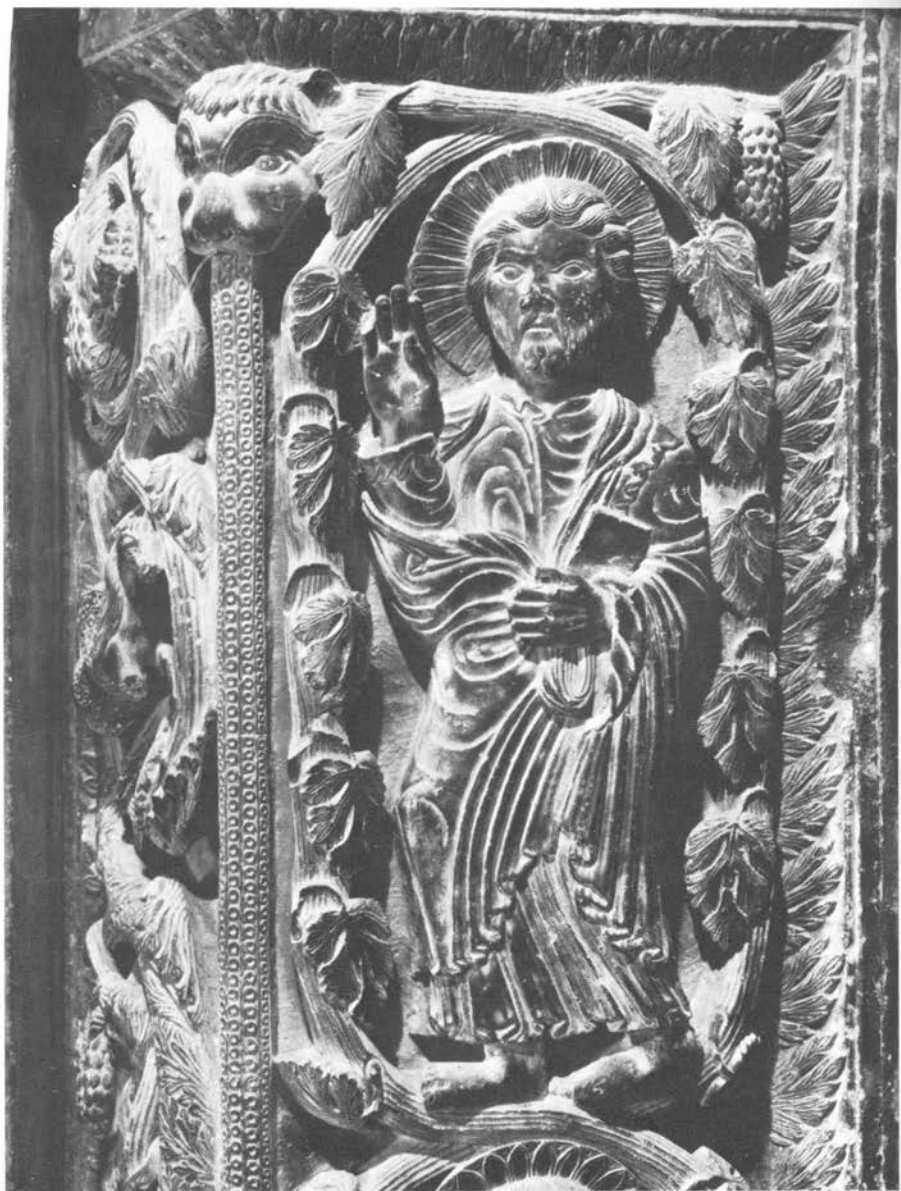
Majstor Adama, prikaz najgornjeg apostola na vanjskom pilastru desno uz vrata