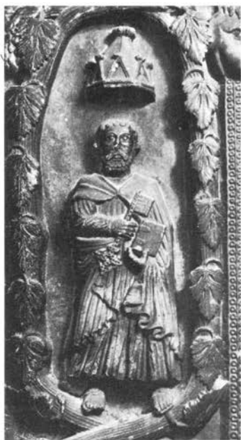
Majstor Eve, prikaz sv. Petra uz kip Eve