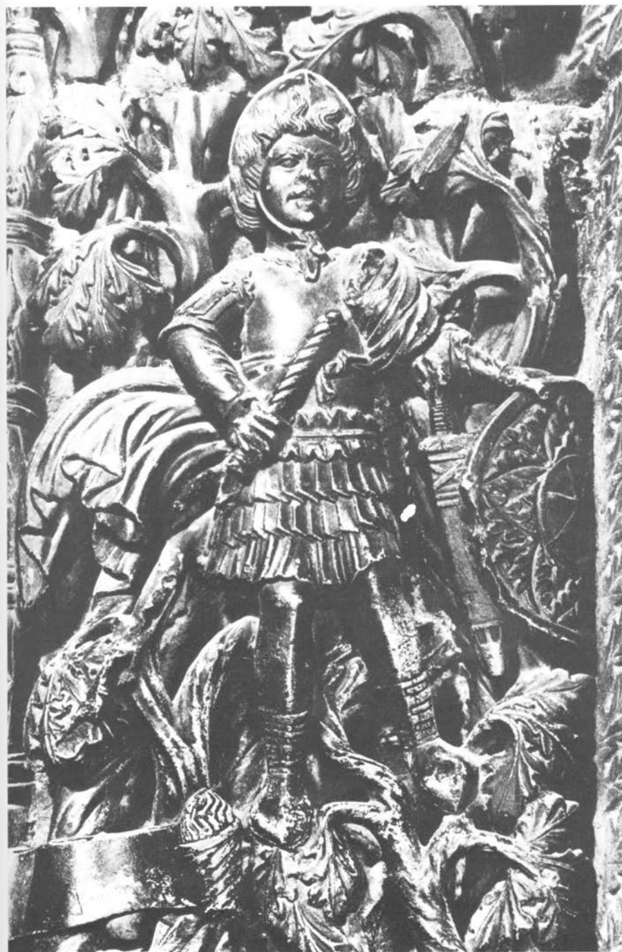
Majstor Radovan, prikaz Ožujka na unutrašnjem pilastru lijevo uz vrata.