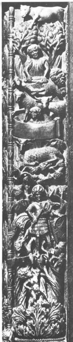
Prikazi nepotpunog ciklusa mjeseci na unutrašnjim pilastrima portala