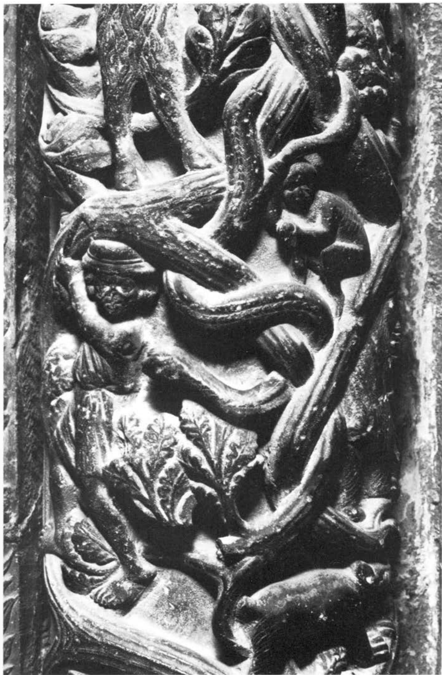
Majstor Radovan, prikaz na poluoblom stupu lijevo uz vrata