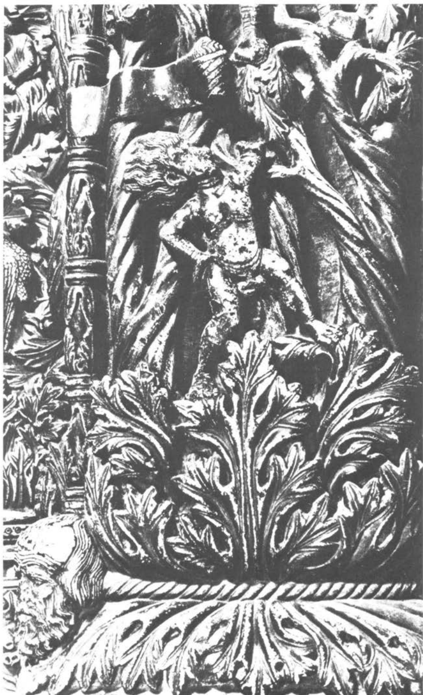
Majstor Radovan, prikaz »genija vjetra« na reljefu Ožujka