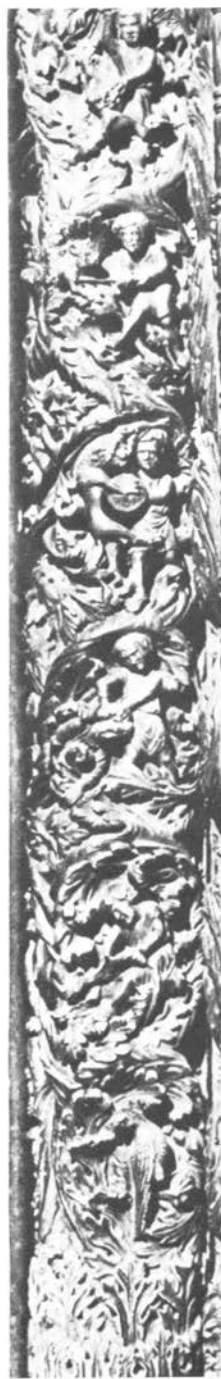
Majstor Radovan, poluobli stupovi uz vrata katedrale