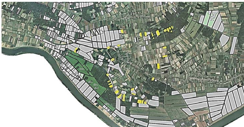
Slika 2. GIS prikaz k.č. površina \leq 1 ha u k.o. Banovci, Slavonski Brod