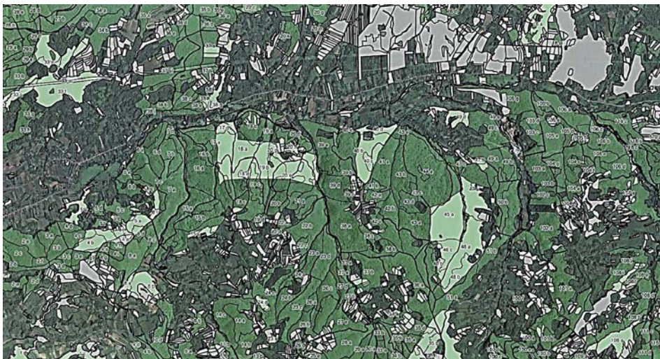
Slika 3. GIS prikaz preklopa podataka Hrvatskih šuma s podacima Agencije Figure 3. GIS layer overlapping of Croatian forests data with the Agency data

raspisivanje javnog poziva je i to da se katastarska čestica ne nalazi u šumsko gospodarskoj osnovi Hrvatskih šuma. Na slici 3 prikazano je preklapanje podataka Hrvatskih šuma s podacima Agencije. Tamnijom zelenom bojom označeni su odsjeci Hrvatskih šuma dok su sivom/svjetlozelenom bojom označene katastarske čestice državnog poljoprivrednog zemljišta.