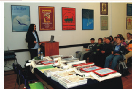
Dodjela priznanja na Festivalu znanosti u travnju 2012. godine za sudjelovanje na natječaju Nagrade Barbara Petchenik za dječju kartu svijeta