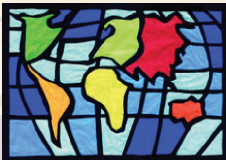
World Map Ranko Vuković