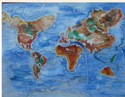
Eco map of the World Amela Kičić