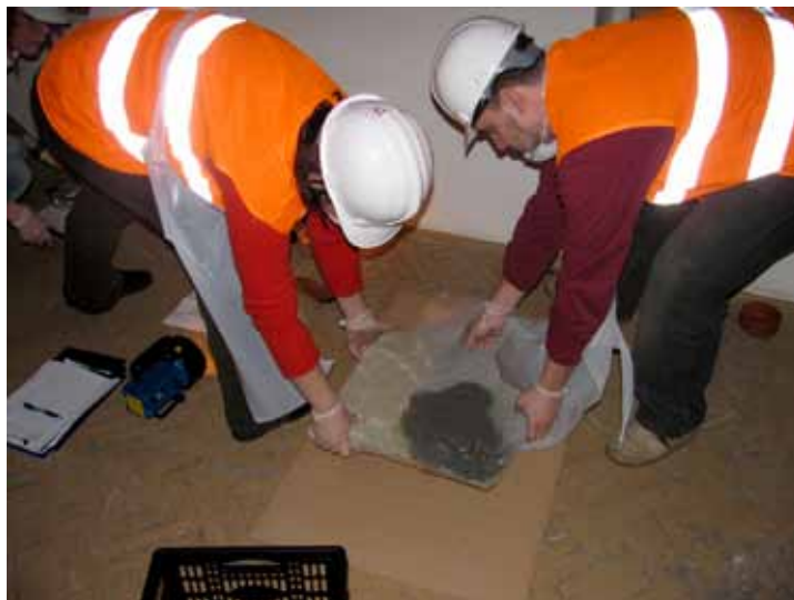
Slika 4. Poduka u području reagiranja u izvanrednim okolnostima kao dio preventivne konzervacije

Iduće razdoblje u razvoju preventivne konzervacije obilježilo je prihvaćanje pristupa u ustanovama zaštite i strukovnim udruženjima, kao i usvajanje koncepta čimbenika propadanja, odnosno jasno određenih elemenata koji čine uvjete okoliša u muzejima, planiranje za izvanredna stanja, sigurnost, zaštitu od požara i mjere kurativne konzervacije (fizičke sile, krađa i vandalizam, vatra, voda, štetočine, zagađivači, svjetlosno zračenje, neodgovarajuća temperatura i relativna vlažnost), kao i koncepta zona i razine nadzora (Michalski 1990). U sklopu pet razina nadzora: izbjeći izvor čimbenika propadanja, otkriti čimbenik propadanja, zaustaviti čimbenik propadanja, reagirati na čimbenik propadanja i tretirati predmet, prve četiri su zapravo aktivnosti preventivne konzervacije. Šest godina kasnije, na Jedanaestom trijenalnom skupu ICOM CC u Edinburghu, 1996. godine, prvi put nekoliko različitih radnih skupina koje su se bavile odvojeno temama preventivne konzervacije, kao što su osvjetljenje, praćenje klime, štetočine, zaštita od požara, postaju jedna radna skupina – Preventivna konzervacija.