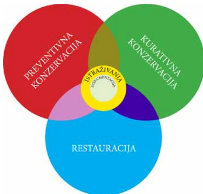
Slika 1. Shematski prikaz nazivlja konzervacije prema G. de Guichenu