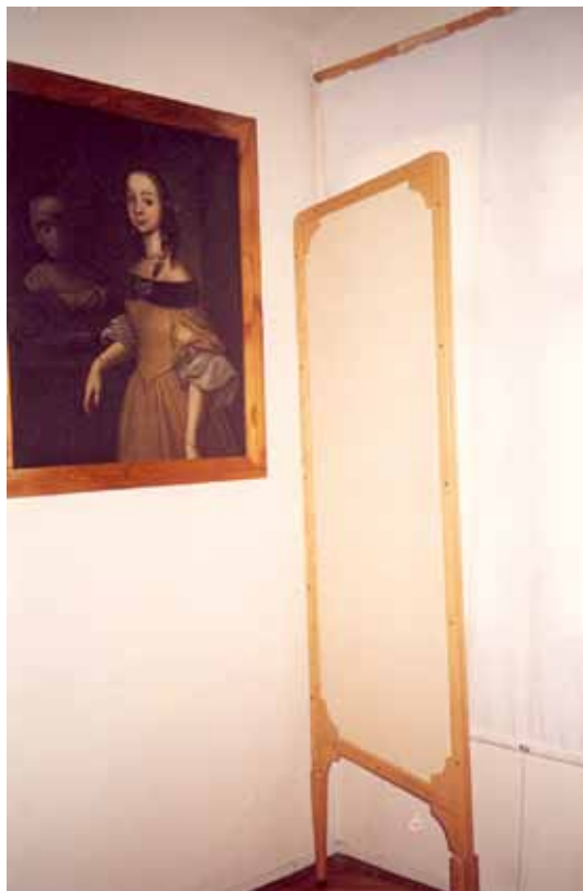
Slika 2. Blokiranje djelovanja svjetlosnog zračenja na sliku postavljanjem panela

odgovarajućih uvjeta čuvanja zbirki (Caygill 1992). Pored relativne vlažnosti, H. Plenderleith, kao uzroke oštećenja muzejskih predmeta uzima u obzir i zagađeni zrak i zanemarivanje predmeta, što za posljedicu ima loše uvjete čuvanja, izlaganja, pojavu štetočina, loše rukovanje i pakovanje, kao i nesreće s predmetima (Plenderleith 1956). To prvo razdoblje u razvoju preventivne konzervacije obilježeno je održavanjem dviju konferencija i objavljivanjem publikacija koje su ukazale na problematiku nadzora klimatskih uvjeta u muzejima, štetnih posljedica i suzbijanja insekata i mikroorganizama i promovirale pristup nadzora i regulacije klimatskih uvjeta i svjetlosnog zračenja u muzejima da bi se spriječilo propadanje predmeta (Recent Advances in Conservation 1961, Museum Climatology 1967, Pye 2001, Thomson 1978).