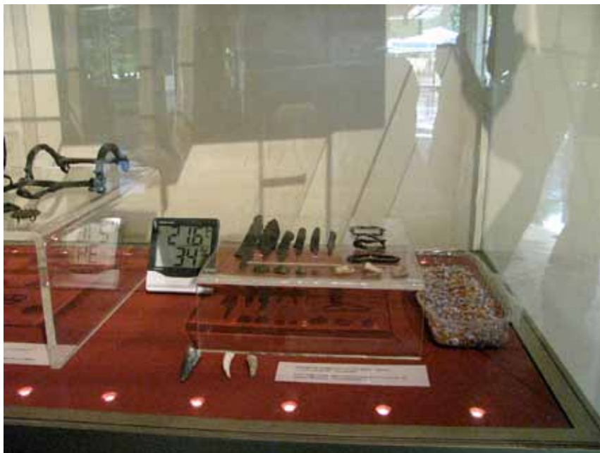
Slika 3. Nadzor i regulacija relativne vlažnosti i temperature u vitrini

U drugoj polovici 20. stoljeća dolazi do intenzivnog razvoja preventivne konzervacije kao pristupa, na što s jedne strane utječe uključivanje rezultata znanstvenih istraživanja u donošenje odluka o preventivnoj konzervaciji, a s druge strane zbog usklađivanja s etičkim načelima minimalne intervencije, radi zaštite integriteta i autentičnosti predmeta, koja je uključena u praksu konzervacije-restauracije kulturnih dobara (Pye 2001, Redondo 2008, Lambert 2010).