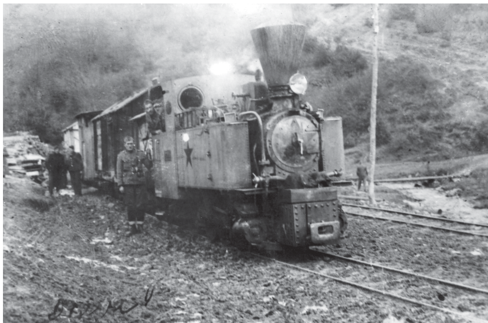
Slika 1. Partizanski vlak na stanici Bučje, godina 1943.

Uspostavljen je i jedan vlak u Podravini na jednakom kolosijeku kao i vlakovi broj 1 i broj 2, na pruži uskotračne širine kolosijeka 0,76 metara. Vlak je prevezio živežne namirnice od Pitomače do jednog slagališta na položaj. Kod toga vlaka nalazio se jedan željeznički stroj i 16 vagona, a na njemu je također bilo zaposleno pet osoba: strojovođa, ložič, vlakovođa i dvojica zavirača.