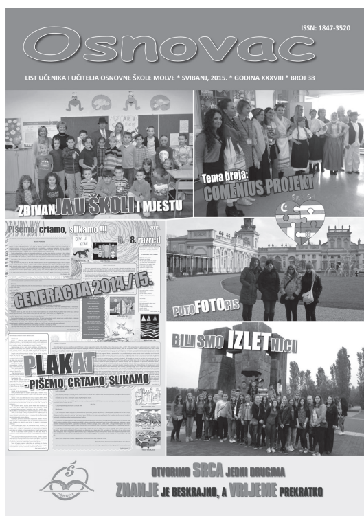
Naslovnica 38. br. Osnovca , svibanj 2015. (gl. urednica – Sofija Paša, 7. a)

Posebna je i posljednja stranica pod nazivom Što rade učenici i učitelji u slobodno vrijeme na kojoj se predstavlja učenik i/ili učitelj sa svojim aktivnostima i uspjesima.