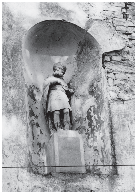
Štrigova – bivša pavlinska crkva sv. Jeronima, kip sv. Stjepana kralja