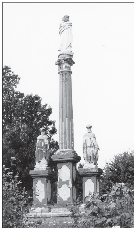
Mala Subotica, spomenik Imakulate

Marija Bezgrešna u Maloj Subotici ima bliske srodnice iz opusa Matije Galla u Nedelišću. 29 Marija stoji na niskom stupu, zaštićena ogradom i limenim krovićem. Zamalo replika ovoga kipa jest Marija Bezgrešna u pokloncu u Donjem