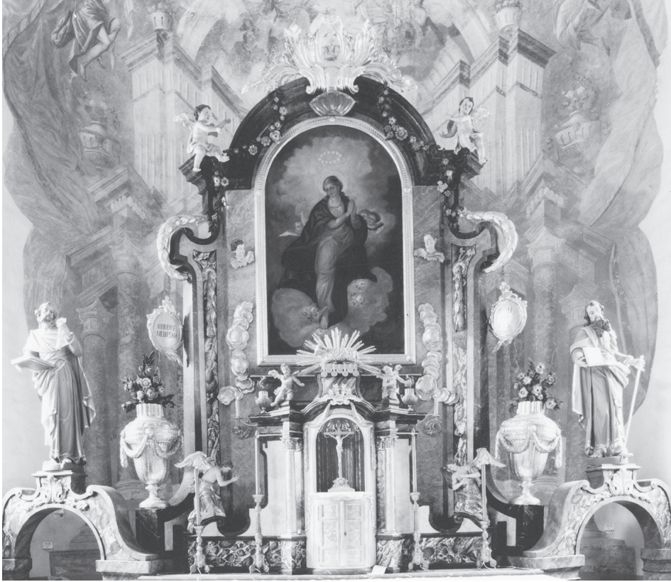
Bednja – župna crkva Uznesenja BDM, glavni oltar, 1792. (kipar - Matija Gallo, Ptuj); foto: M. Drmić, 2006.

su oni se, međutim, javljaju vrlo rijetko. Najbolje sačuvan je takav tabernakul-oltar u župnoj crkvi u Đelekovcu , 8 dok po nekim tragovima možemo pretpostaviti kako ih je bilo i u Vratišincu i Macincu. U Vinici se varijanta toga tipa nalazila na pobočnim oltarima.