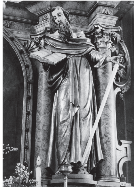
Štrigova – žup. crkva sv. Marije Magdalene, lij. pokrajnji oltar sv. Josipa, sv. Pavao

ex parte Epistolae S. Hieronimi statuarii laboris, eiusdem Imago bene penicillo picta, 3 ia 3 um Altare ex parte).