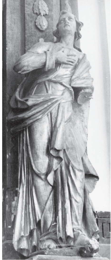
Kamenica – žup. crkva sv. Bartola, poboč. oltar sv. Križa, 1803., sv. Ivan; 17.05.1969.