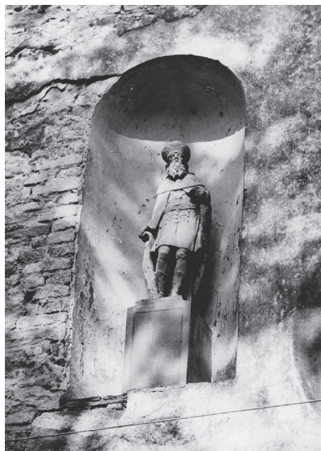
Štrigova – bivša pavlinska crkva sv. Jeronima, kip sv. Ladislava kralja