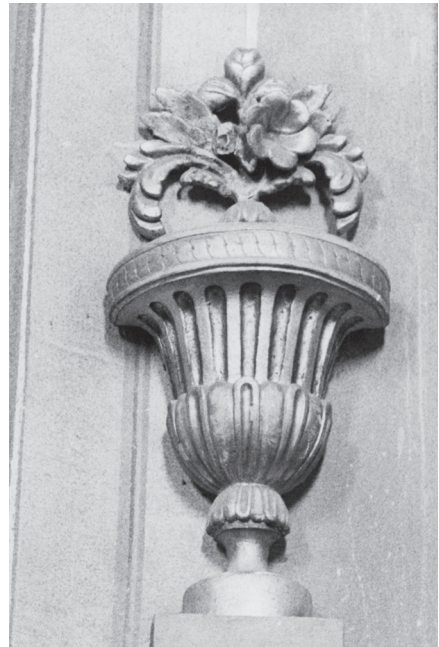
Sv. Marija na Muri – oltar Srca Marijina, klasicistička vaza