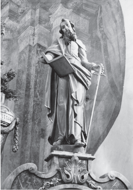
Bednja – žup. crkva Uznesenja BDM, glavni oltar, sv. Pavao, 1792.