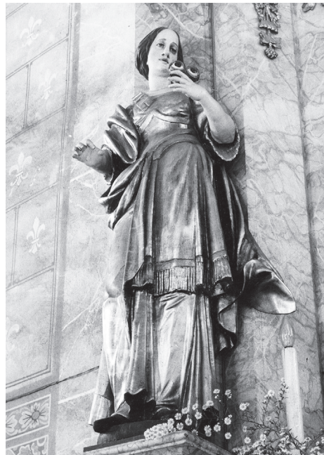
Štrigova – župna c. sv. Marije Magdalene, pobočni oltar, sv. Lucija