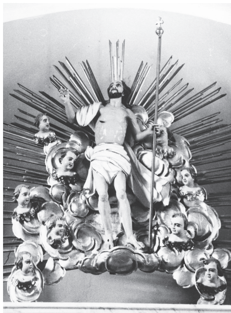
Mali Bukovec – crkva sv. Katarine, glavni oltar; Uskrsli Krist na atici