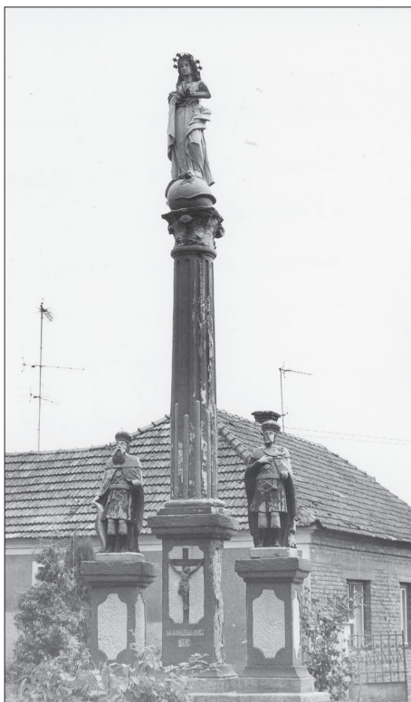
Mala Subotica, spomenik Imakulate, sa kr. Stjepanom i Ladislavom, kamen