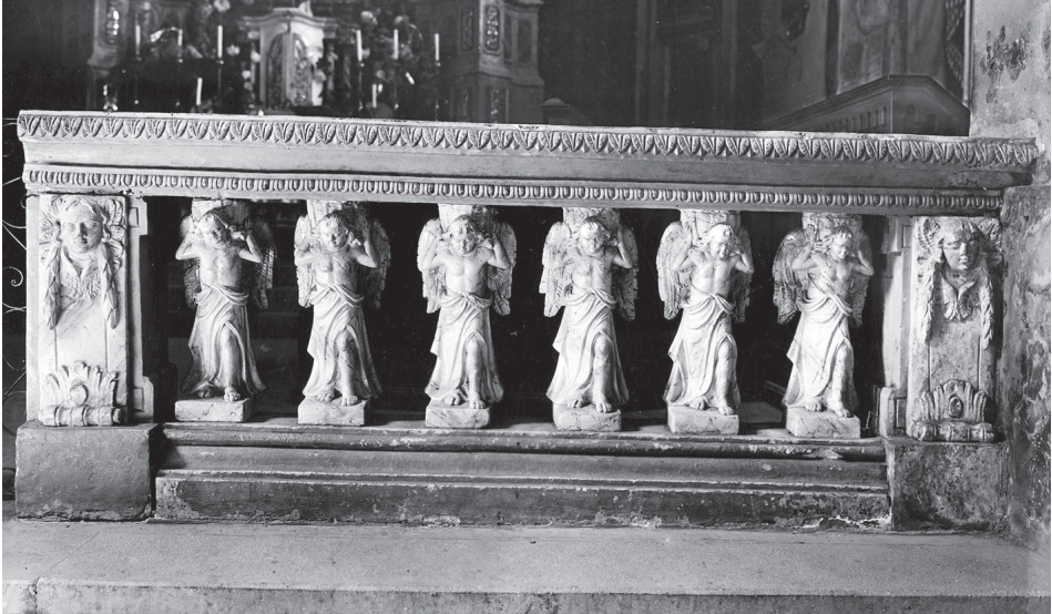
Vinica – župna crkva sv. Marka, pričesna ograda; kipar – M. Gallo, Ormož, 1820.; foto: D. Baričević

ke u kamenu. Javni spomenici bili su u vrijeme baroka jako obljubljeni u našim krajevima, a to se nastavilo još i početkom 19. stoljeća. Gallova djela u kamenu obuhvaćaju samo mali broj ikonografskih tema među kojima Imakulata (Marija Bezgrešna) zauzima posebno mjesto.