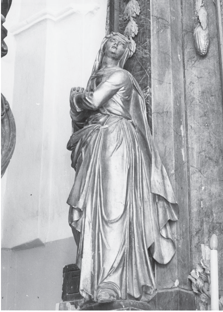
Kamenica – žup. crkva sv. Bartola, poboč. oltar sv. Križa, sv. Marija, 1803.