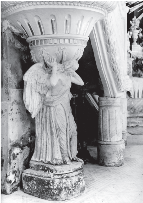
Vinica – žup. crkva sv. Marka, propovjedaonica (detalj), anđeo-karijatida, klesarski rad u kamenu; foto: D. Baričević.

Ova zapažanja o specifičnosti Gallova kiparstva mogu se još proširiti na skupinu ženskih likova, odnosno svete i mučenice s njihovim karakterističnim atributima. U odnosu na muške likove zastupljene su u znatno manjem broju. Najznačajnija uloga dodijeljena im je na glavnom oltaru kapele sv. Katarine u Malom Bukovcu . Tu uz sv. Katarinu još stoje sv. Apolonija i Lucija čiji se likovi nalaze i na pokrajnjem oltaru župne crkve u Štrigovi gdje prate zaštitnicu oltara sv. Barbaru. Nasuprot tome, sv. Barbaru na istoimenom pokrajnjem oltaru u župnoj crkvi u Svetoj Mariji na Muri prate starozavjetni sveci Zaharija i kralj David. Sve svete pripadaju istom prepoznatljivom tipu, ali Gallo ni u jednom slučaju ne opetuje doslovno isti ikonografski tip. Slične po osnovnoj zamisli, svete se međusobno razlikuju po stavu, okretu tijela i glave, pokretima ruku. Osim toga, Gallo je inzistirao na diferenciranoj odjeći, koja isti antikizirajući kostim varira u detaljima. Ti kostimi, s prilično gustim reljefom nabora, unose raznolikost drapiranjem plašteva. Svete najviše spaja u cjelinu oblik glave, lijepih crta lica i karakterističnog načina češljanja kose, koja od razdjeljka na tjemenu