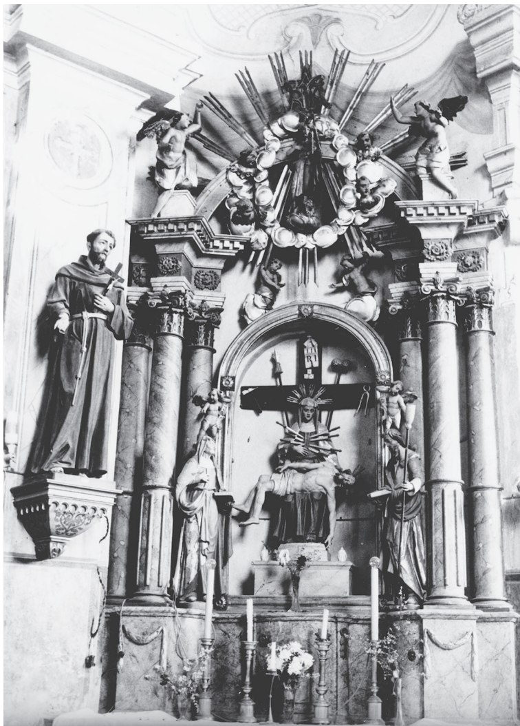
Goričan – župna crkva sv. Leonarda, lij. pokrajnji oltar M. B. Žalosne, oko 1810.; sv. Ana, sv. Joakim

i obuhvaćenom naborima drapiranog zastora. Pred tom folijom ističe se visoki uski oltar koji obuhvaća tabernakul i oltarnu sliku i ističe se dekoracijom koju, uz anđele i oblake, uskim krilima, akcentuiraju zavojite lovorove girlande, sitni štitovi i velike vaze sa cvijećem. Na lukovima bočnih prolaza stoje kipovi apostolskog para Petra i Pavla koji su značajni kao prvi primjeri jedne tipologije koju će Gallo opetovano ponoviti kod drugih djela.