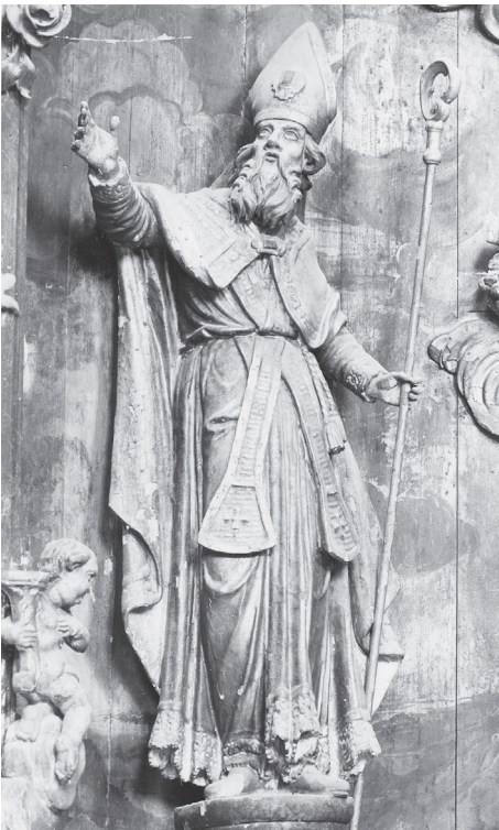
Kamenica – žup. crkva sv. Bartolomeja, pokrajnji oltar sv. Donata; 1816.

Bog Otac sa zemaljskom kuglom i Isus s velikim križem sjede na nagomilanim oblacima, s nešto u stranu odmaknutim gornjim dijelom tijela, da bi tako na sredini ostao prostor za ubicu Duha Svetoga. Okruženi su velikim gloriolama koje ih svojim oblacima, dugačkim zrakama i anđeoskim glavicama okružuju poput vijenca. Odlikuje ih izvjesna tvrdoća obrade i uglate geste. Mladenачki đakoni sv. Stjepan prvomučenik i sv. Lovro na glavnom oltaru u Meljanu imaju u istom paru đakona na pokrajnjem oltaru sv. Valentina u Natkrižovljanu svoje gotovo identične replike, kako stavom tako i odjećom.