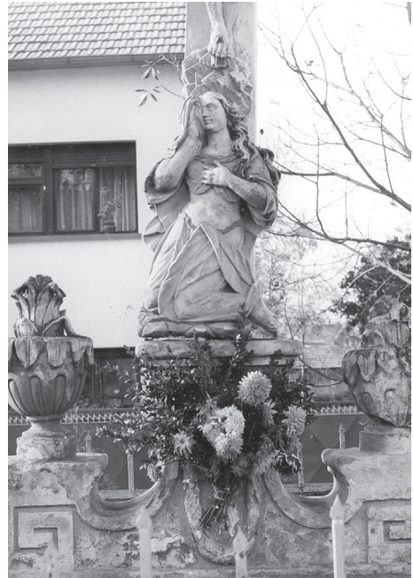
Kotoriba - kameni spomenik, raspeće s M. Magdalenom, 10. 11. 1984.

mentike. Nad meandarskim uglovima stoje velike klasicističke vaze koje zamjenjuju kipove Marije i Ivana evanđelista.