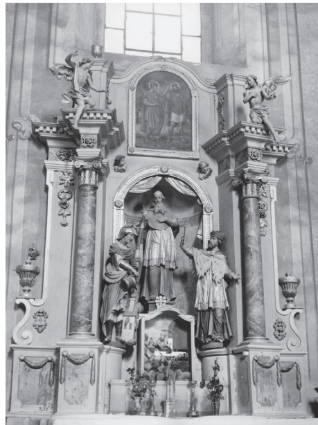
Sv. Marija na Muri – žup. crkva, pobočni oltar sv. Jeronima