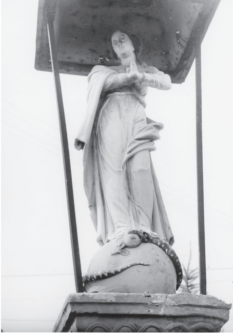
Nedelišće – Imakulata (M. B. Bezgrešna), kamen