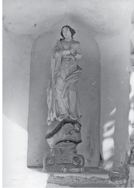
Donji Mihaljevec - poklonac Imakulate (Sv. Marija na Muri), vis. 150 cm, kamen

Veliku sličnost imaju i kipovi sv. Valentina i sv. Donata na pokrajnjim oltarima u crkvama u Natkrižovljanu i Kamenici. Njihov dominantni položaj u centru oltara naglašen je stavom u poluprofilu, dosta raskošnim biskupskim ornatom i velikim biskupskim štapom. Kod ornata prevladavaju grupe dugih paralelnih i i gusto naslaganih nabora, koji duž uskog tijela padaju sve do stopala. Isto takvo vođenje nabora odjeće imaju još neki kipovi, od kojih bi se sv. Jeronim i sv. Ivan Nepomuk, kao i Zaharija i kralj David na pokrajnjim oltarima u Svetoj Mariji na Muri također mogli pridružiti ovoj grupi.