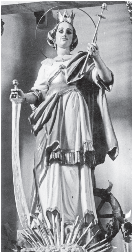
Mali Bukovec – crkva sv. Katarine, glavni oltar, sv. Katarina

Raspeti Isus, središnji lik svih oltara sv. Križa, ima vitku i izduženu tjelesnu građu i visi na križu smireno i bez okreta i pojasnica prijanja uz tijelo bez lepr-