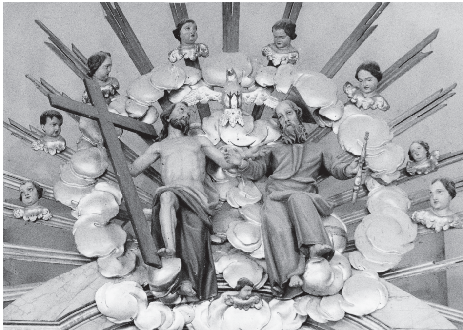
Peteranec – žup. crkva sv. Petra i Pavla, gl. oltar, atika