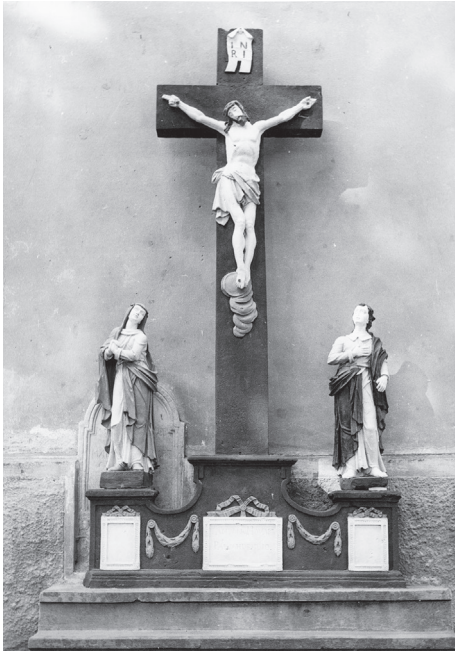
Štrigova – žup. crkva sv. Marije Magdalene, oltar sv. Križa, 1810.