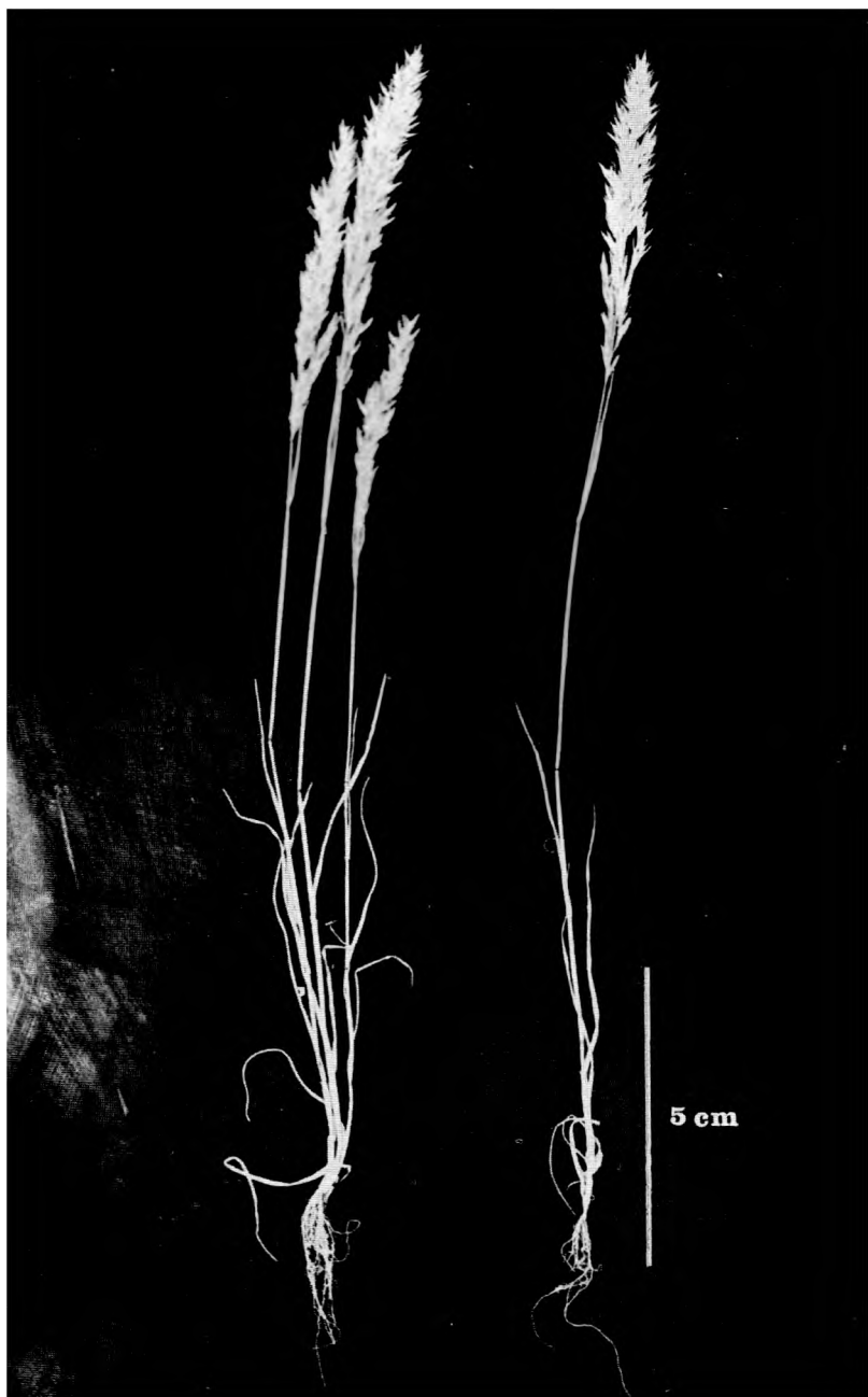
Sl. 1. — Abb. 1.