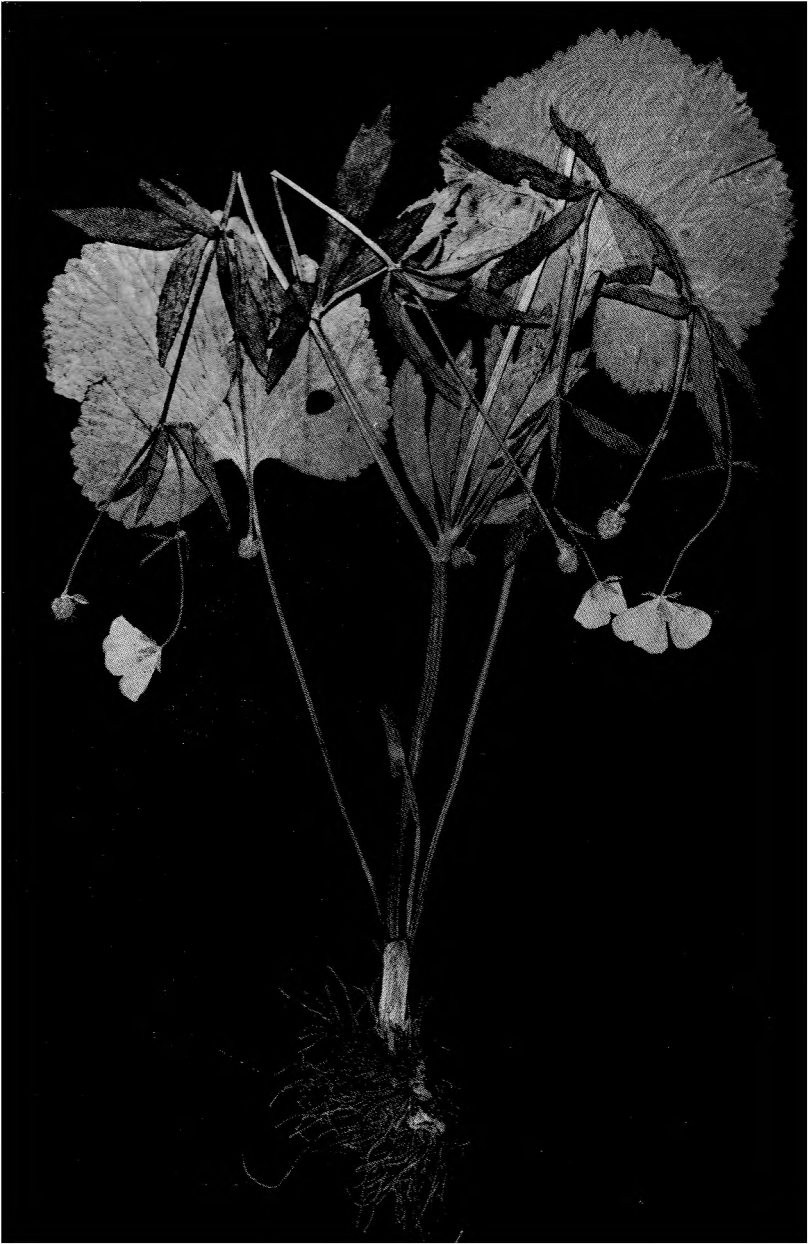
Sl. 1. — Fig. 1.