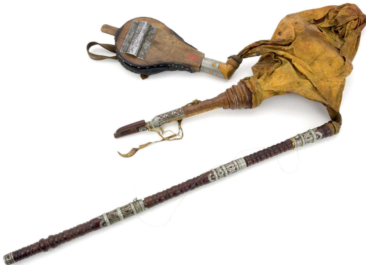
Slika 6. Dude, Veliki Raven - 19. st., POH-419/1920

balo te na tematskoj izložbi Tamburica simbol hrvatskog identiteta? . S obzirom na uvijek vrlo aktualno pitanje identiteta, u sklopu izložbene djelatnosti Muzeja nastoji se pratiti suvremene tijekove. Povijesni presjek izložbene djelatnosti pokazuje kako su u različitim vremenskim razdobljima gotovo svi muzejski izlošci iz Zbirke glazbenih instrumenata bili izloženi. Dokumentacijski popis upućuje na trinaest izložaba s glazbenom tematikom, dok je, prema arhivskim podacima Etnografskog muzeja, u javnim tiskanim medijima objavljeno šest članaka koji govore o izložbenoj prezentaciji glazbenih instrumenata u Etnografskome muzeju. S obzirom na devedeset godina djelovanja Muzeja i bogat fundus Zbirke glaz-