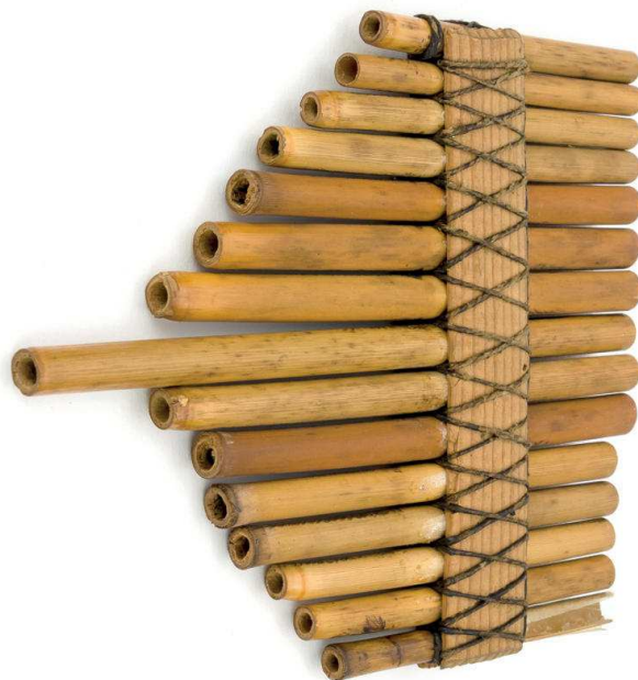
Slika 1. Panova svirala, Trški Vrh - 1. desetljeće 20. st., Inv. br. 17; snimio: Matija Dronjić

grammarchivu bečke Akademije znanosti s kojim je Etnografski muzej sklopio ugovor o tome da bečki Phonogramarchiv dade Muzeju na uporabu fonograf, uz uvjet da se originali fonogramskih snimaka predaju bečkom Phonogramarchivu, a Odsjek za pučku muziku zadržava kopije (Širola i Gavazzi, 1931a: 7; Gjetvaj, 1989: 21; Bezić, 1998: 22). Do 1945. godine, kada se djelatnost Odsjeka seli u novoosnovani Institut za narodnu umjetnost, a u Muzeju ostaje samo Zbirka glazbenih instrumenata, prikupljeno je više od 400 primjeraka tradicijskih glazbenih instrumenata iz Hrvatske, ali i s raznih područja slavenskog juga, brojna dokumentacija o prikupljenoj građi, snimljeno je više od 115 fonogramskih ploča te izrađene fotografije s terenskih istraživanja. Prema zapisniku o primopredaji građe od 26. svibnja 1989. godine, Hrvatski je arhiv preuzeo 115 fonogramskih ploča i opremu (Arhivska građa, Etnografski muzej u Zagrebu). Brojne