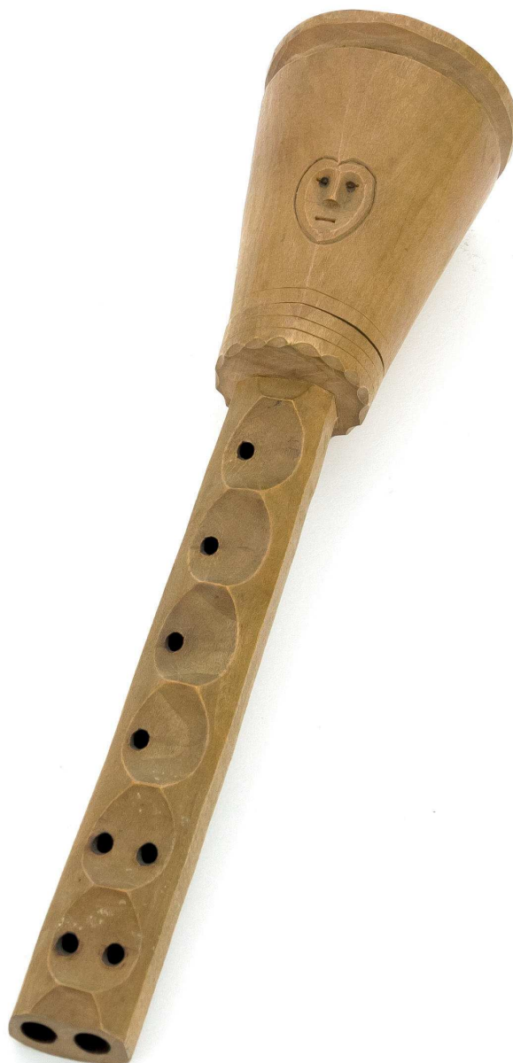
Slika 3. Diple - diple, Sinj - 1. pol. 20. st., Inv. br. 1199