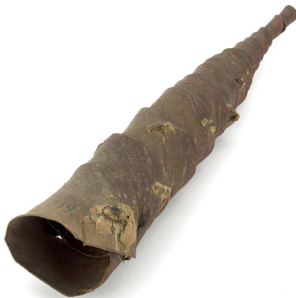
Slika 2. Rog, Lipik - 1. desetljeće 20. st., Inv. br. 719a/719b

Jednako tako, zabilježili su i neka prva promišljanja o načinu izlaganja glazbenih instrumenata iz fundusa Etnografskog muzeja na izložbama. Prva izložba glazbenih instrumenata iz fundusa tog muzeja pod nazivom Muzika u životu naroda planirana je za 1927. godinu, a organizirao ju je ... grad Frankfurt na Majni prigodom međunarodnog glazbenog festivala (Gavazzi i Širola, 1931:16). Prema zabilješkama Širole i Gavazzija o pripremi izložbe, možemo primijetiti iznimnu profesionalnost koju su pokazali autori izložbenog dijela o glazbenim instrumentima Muzeja pišući kako je ... muzejska uprava odmah izradila projekt za