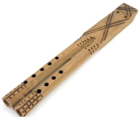
Slika 4. Dvojnice - dvojki, Gornji Hruševac, Kravarsko - 1. pol. 20. st., Inv. br. 1810

nošnjama. U stalnom postavu Etnografskog muzeja danas se nalaze četiri glazbena instrumenta: u vitrini u kojoj je prikazana narodna nošnja Istre smještene su mala i velika sopila, u vitrini s narodnom nošnjom iz Dalmacije nalazi se lijerica, a u vitrini s narodnom nošnjom iz Vrlike izložene su jedne gusle i jedne diple.