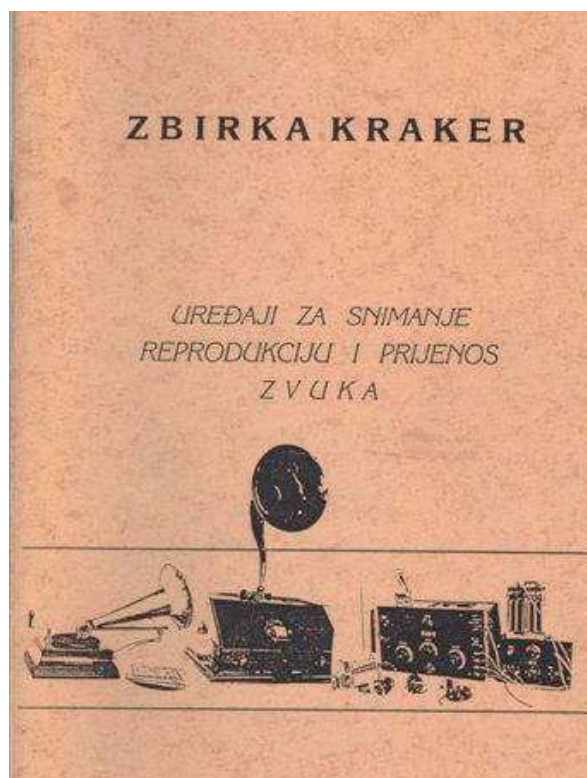
Slika 3. Katalog izložbe 1990. godine

pisi od 1906. do 1916. godine koji se čuvaju u njegovoj zbirci.