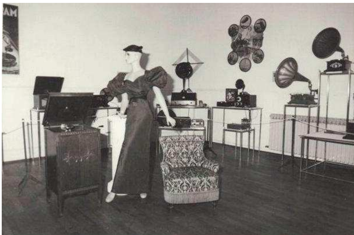
Slika 2. Postav izložbe održane u Gradskom muzeju Sisak, 1990. god.