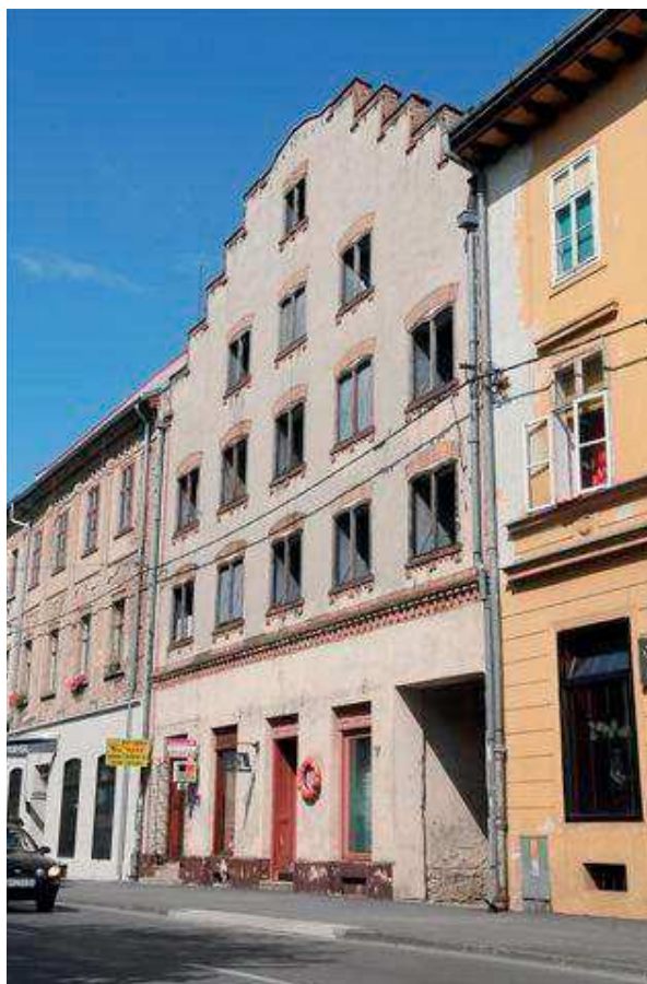
Slika 7. Holandska kuća; snimila: Blaženka Suntešić

ni pristup svojoj zbirci, Kraker u tome ne vidi problem, budući je ona prema njemu „jedan živi organizam koji ne smije biti zatvoren u svoju ljušturu već treba biti aktivni sudionik u prenošenju informacija.“ Prije svega to se odnosi na glazbu kao temeljnu odrednicu njegove zbirke, a nakon toga i na tehnički razvoj koju ta zbirka prezentira.