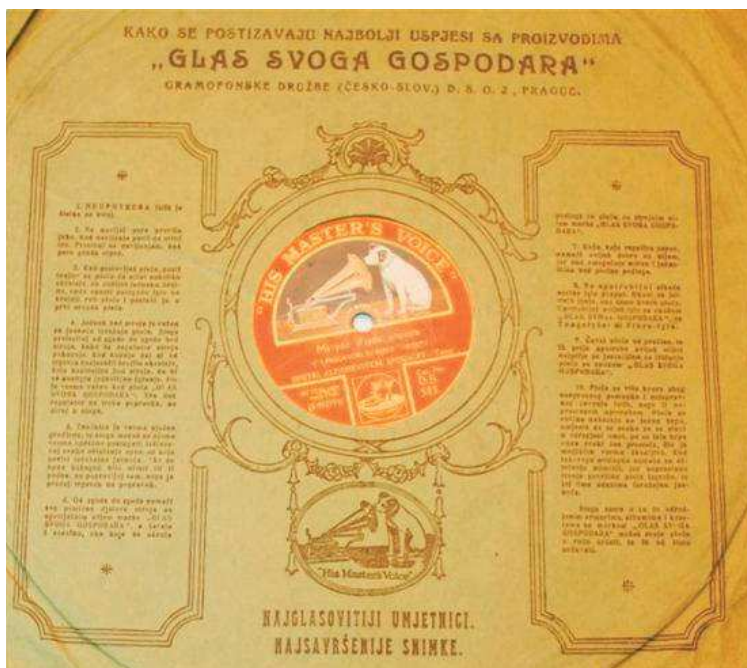
Slika 5. Jedna od ploča