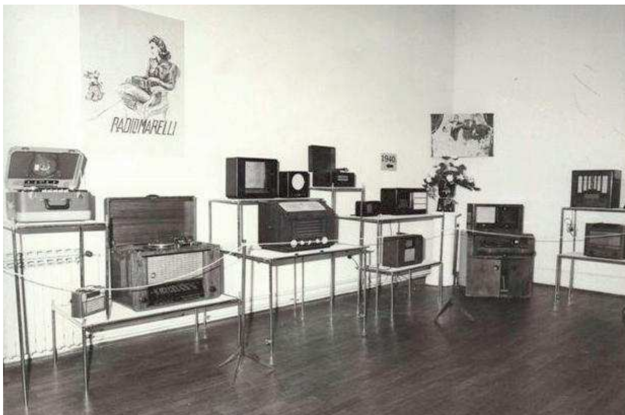
Slika 1. Detalj s izložbe održane u Gradskom muzeju Sisak, 1990. god.