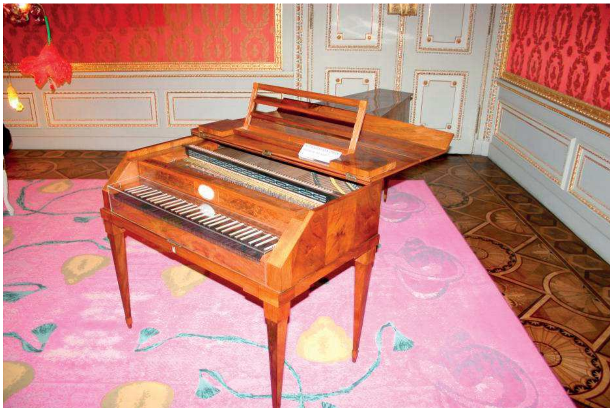
Slika 4. Dubrovački fortepiano na izložbi u Albertini, Beč, 2006.