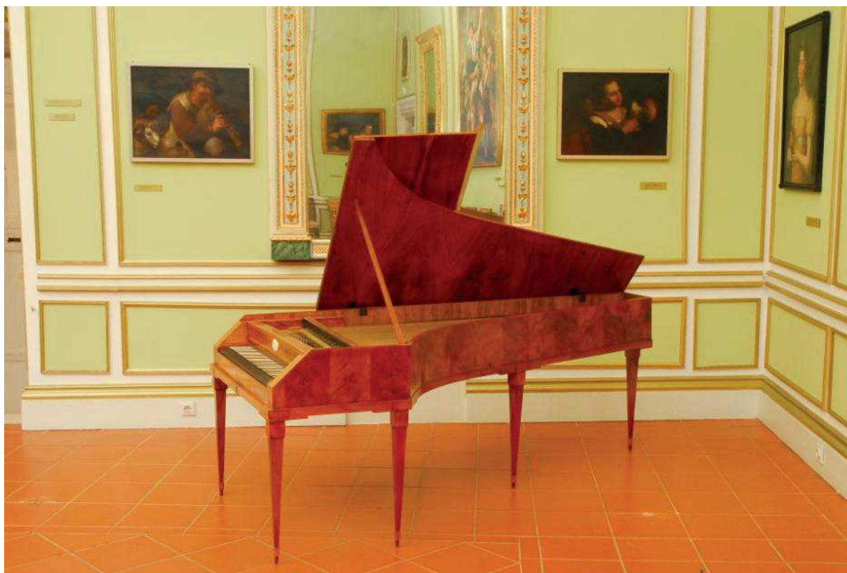
Slika 1. Fortepijano, Anton Walter, oko 1790., Dubrovački muzeji

U Njemačkoj se takvo glazbalo nazivalo hammerklavier , a usavršio ga je Gotfried Sibermann između 1739 i 1745. godine u Freibergu, gdje je imao i radionicu u kojoj je podučavao nekoliko učenika, među njima i svojega nećaka Johanna Andreasa Silbermanna, Johanna Andreasa Steina i Johannes Zumpea. Zumpe 1760. godine odlazi u London, gdje izrađuje fortepijana na osnovi Cristoforijeve pojednostavnjene i usavršene mehanike, s četvrtastim kućištem, postigavši tako snažniji zvuk. Bio je to povijesni glasovir malih dimenzija s pet oktava, a kako je bio jeftin, u Engleskoj se dobro prodavao, pa ga je i skladatelj Johann Christian Bach (sin