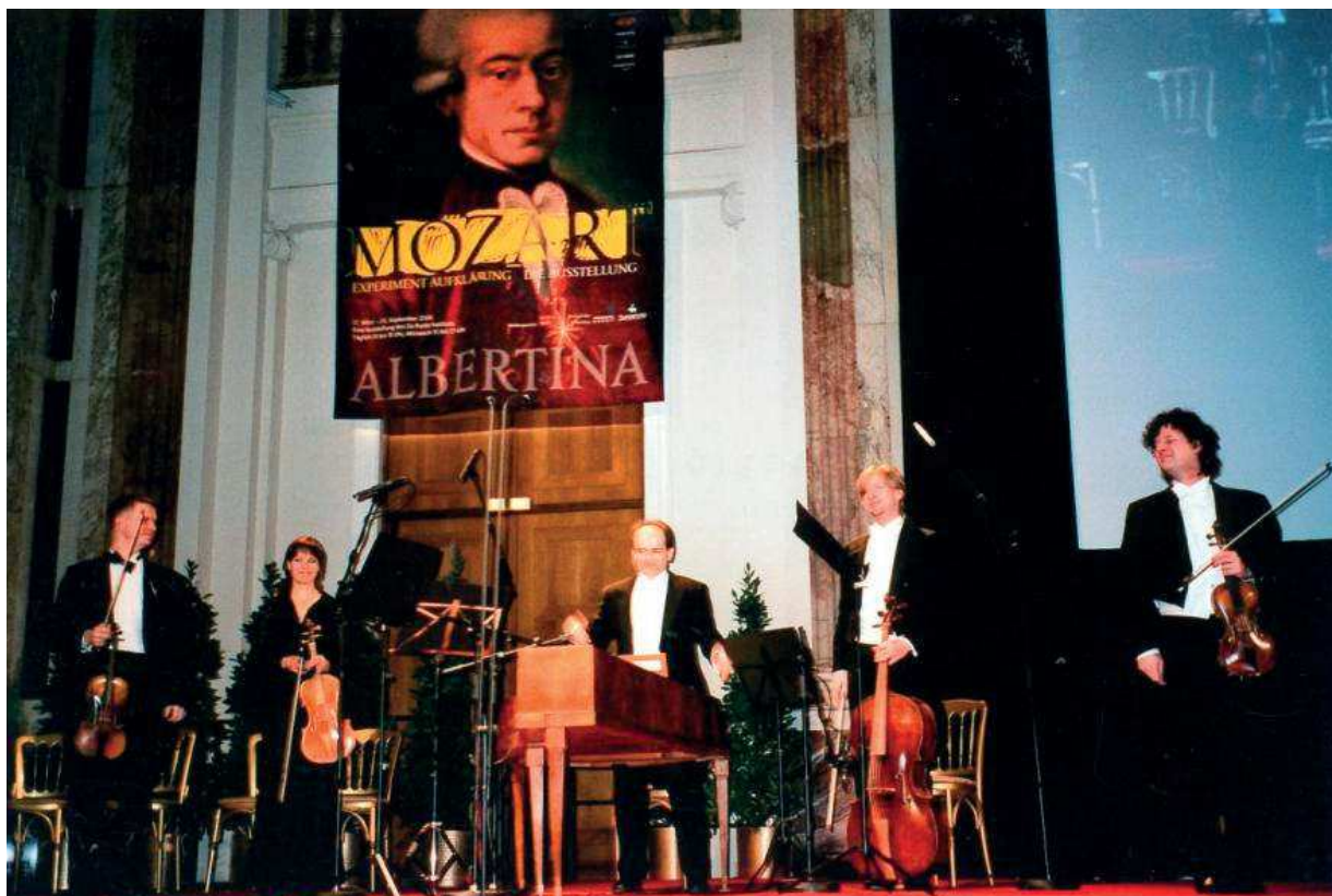
Slika 5. Otvorenje izložbe posvećene W. A. Mozartu, H. Jugović i Pleyel Trio Wien, Festsäle, Beč, 2006.

Roberta Browna. U potpunosti je obnovljen glazbeni mehanizam fortepijana, a restaurirano mu je i kućište kako bi se taj povijesni glasovir sačuvao za buduća vremena. Restauracija je završena u veljači 2006. godine, uz nadzor Stručnog povjerenstva Ministarstva kulture RH. 21 Nakon završene restauracije fortepijano je posuđen glasovitoj bečkoj galeriji Albertini za potrebe velike tematske izložbe postavljene u čast 250. obljetnice rođenja W. A. Mozarta. Izložba punog naslova Mozart 2006. – Experimental Enlightenment and Latent Romanticism in Late Eighteenth-Century Vienna trajala je od 17. ožujka do 17. rujna 2006.,