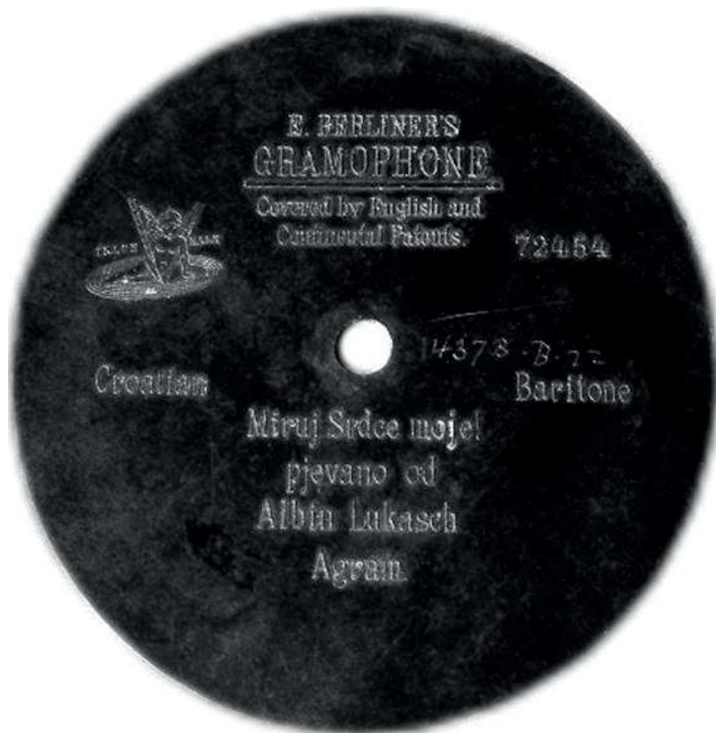
Slika 2. Jedna od četiriju najstarijih gramofonskih ploča iz 1901. s hrvatskim programom. Riječi su bile ugravirane u tijelo ploče; snimio: Veljko Lipovšćak

Povijest hrvatskih zvučnih zapisa počinje početkom 20. st. u Beču. Naime, 1901.