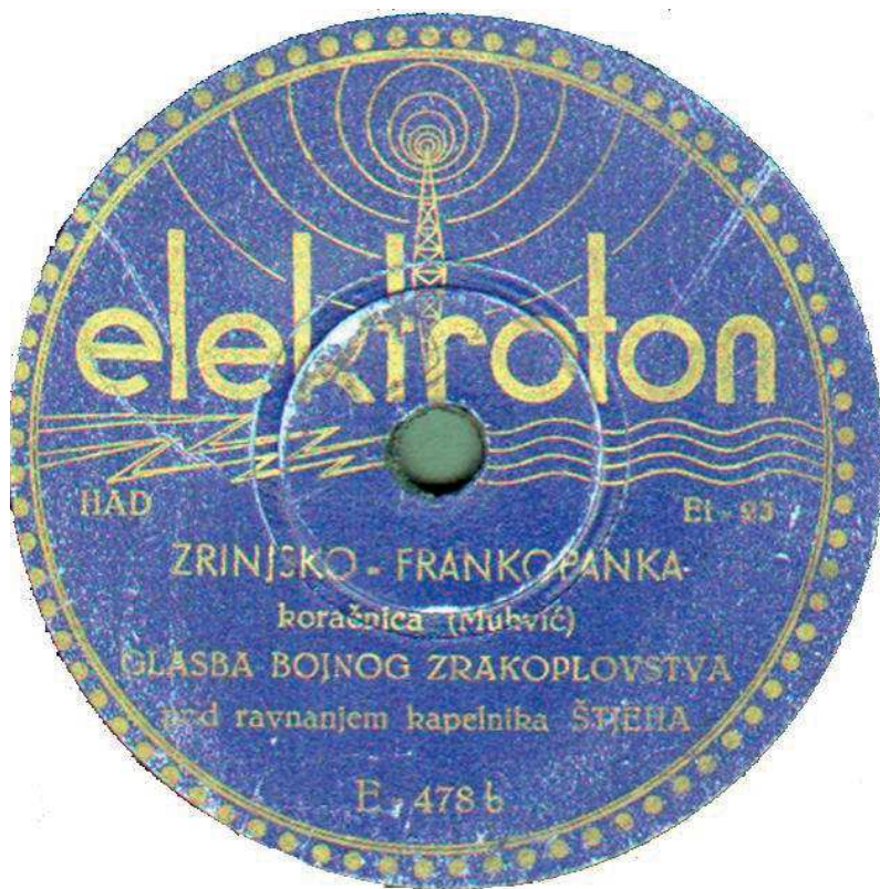
Slika 13. 1944.g. Elektroton je započeo izrađivati ploče s vlastitim snimkama

i Mariboru. I za vrijeme Drugoga svjetskog rata dobro se poslovalo, ali oblik