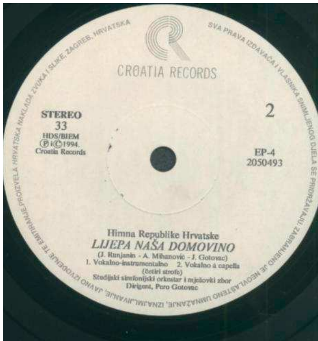
Slika 17. 1992. Jugoton postaje Hrvatska naklada zvuka i slike, a u reklamne svrhe rabi se naziv Croatia Records. 1. 8.. 1994. Hrvatska naklada zvuka i slike postaje dioničko društvo

i slike, a za promidžbene se svrhe služi nazivom Croatia Records. (sl. 17.). Ta tvrtka 1. kolovoza 1994. postaje dioničko društvo.