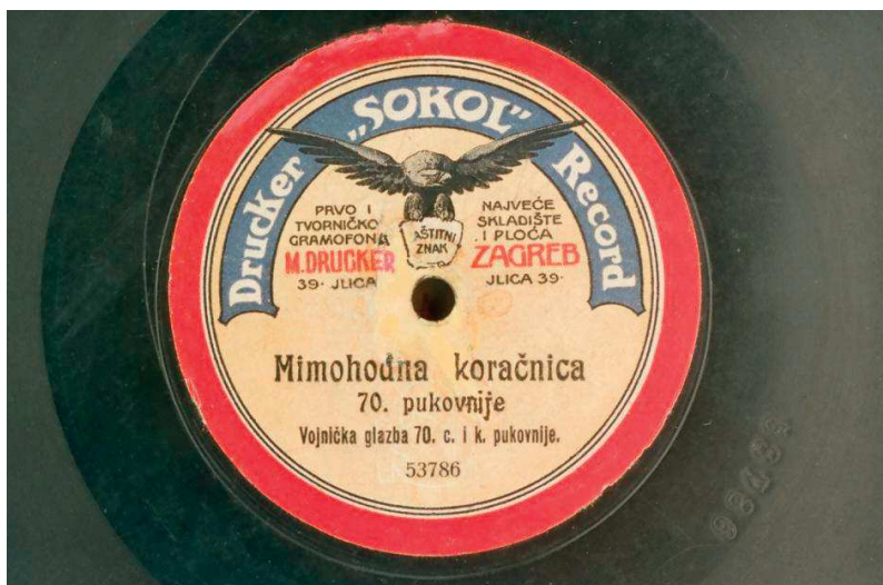
Slika 7. Naljepnica gramofonskih ploča hrvatskog izdavača ploča Drucker SOKOL Record

Najčešće snimana skladba bila je hrvatska himna Lijepa naša domovino . Skladbe Ivana pl. Zajca snimljene su na najvećem broju ploča. Ulomci iz operete Barun Trenk Srećka Albinija objavljeni su na pločama četiriju tvrtki: Gramophonea Co., Odeona, Premiera i Sokola (1909.). To su ujedno i jedine snimke te operete. Zanimljivo je bilo izdanje tvrtke Odeon na tri ploče s naslovom Diljem doma , na kojima je bio snimljen opis putovanja kroz hrvatske krajeve.