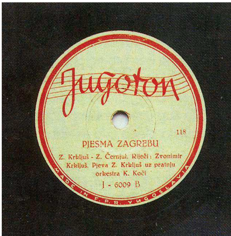
Slika 15. 1949. započela je serija ploča 6000 s domaćim programom. Izrađeno je 800 brojeva ploča; snimio: Veljko Lipovšćak

Godine 1949. napokon se počela proizvoditi serija ploča 6000 s domaćim izvođačima, a trajala je do 1959. godine. Proizvedeno je oko 800 brojeva ploča. Time završava proizvodnja