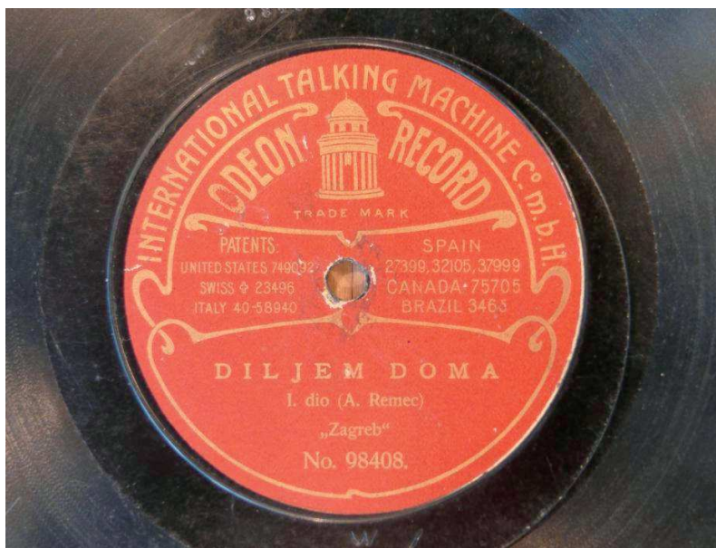
Slika 5. Njemački Odeon bio je druga tvrtka po broju snimljenih ploča u Hrvatskoj iza Gramophon Co.

osnovana Prva mađarska tvornica ploča, koja je u Budimpešti imala cijelu tehnološku