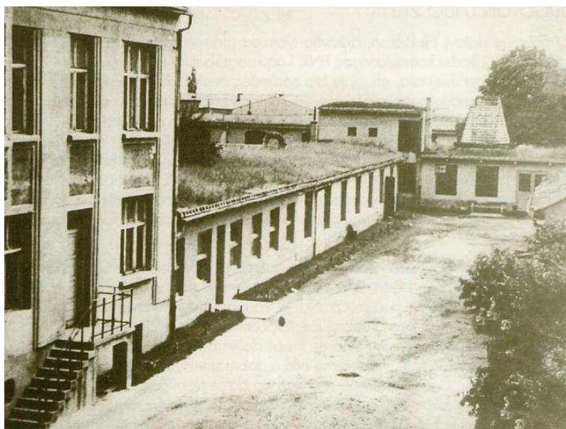
Slika 14. U ljeto 1947. Elektroton se preselio u Ilicu 213 u Zagrebu. Dne 10. 7. preimenovan je u Jugoton. Tu su se proizvodile gramofonske ploče do 30. 6. 1963., preslik iz Jugoton arhiva.

(sl. 14.). Te je godine počelo osnivanje ili preimenovanje tvornica i poduzeća koja su dobivala predmetak jugo . Jugotonu je dodijeljena sva imovina bivših poduzeća EBP-a i Elektrotona. I tako je, uz zastarjele uređaje, problematičan montažni materijal i dobru volju, 5. studenog 1947. u Zagrebu ponovno počela proizvodnja gramofonskih ploča. Za taj je početak zaslužna i češka tvrtka Gramofonové závody iz Praga, kojoj je vlast dopustila suradnju s Jugotonom. Ta je češka tvrtka poslala prvi pravi materijal za proizvodnju ploča i stručnjaka za izradu matrica u galvanoplastici. Nakon prvih proizvodnih uspjeha pojavile su se i poteškoće. U zemlji je bilo malo gramofona,