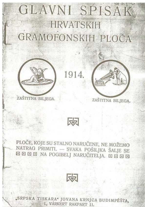
Slika 4. Katalog gramofonskih ploča Gramophon Co. sa snimkama za Hrvatsku. U katalogu iz 1914. bilo je 398 dvostranih ploča

nda i Dragutina Freudenreicha te Tamburaškoga zbora slijepih radnika.