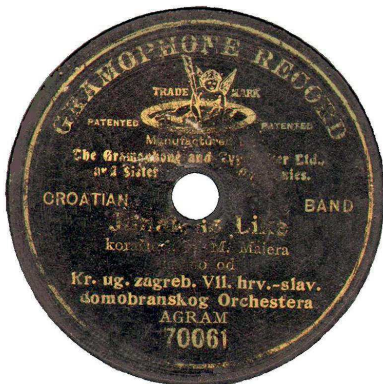
Slika 3. Gramofonska ploča iz 1902. Program je snimljen u Zagrebu; snimio: Veljko Lipovšćak