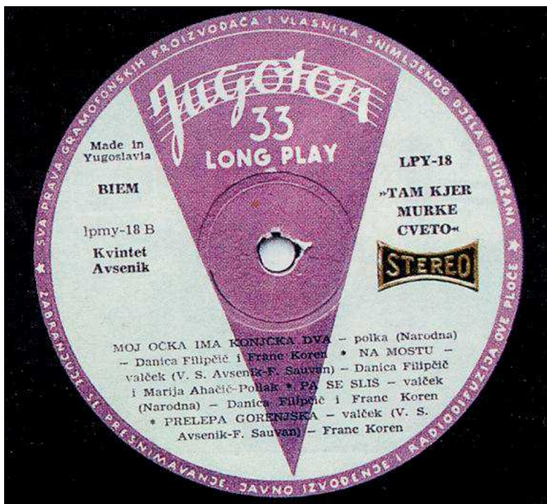
Slika 16. Jugoton je počeo 1957. izrađivati 25cm ploče od polivinilklorida. 1961. izrađena je prva ploča sa stereo snimkom LPY-18; snimio: Veljko Lipovšćak

šelakovih ploča. Ploče su snimane i urezivane na Radio Zagrebu, a matrice su se izrađivale u novom odjelu galvanoplastike u Jugotonu, u Ilici 213. To je bilo vrijeme kada se pojavila Pjesma Zagrebu (S-6044) (sl. 15), kada je drugi put snimljena cjelovita Tijardovićeve Mala Floramye na osam ploča promjera 25 cm (C-6080 do C-6087). Valja spomenuti ploču sa snimkom Podravske suite Zlatka Špoljara (C-6033), orkestralni potpuri Albinijeve operete Bosonoga plesačica te operetne arije i duete u izvedbi solista zagrebačkog kazališta Komedijska. Ostali se program sastojao od narodnih pjesama iz svih krajeva bivše države, pjesama iz razdoblja borbe i obnove te zabavne glazbe. Ivo Robić bio je rekorder po broju snimljenih ploča na 78 okr./min. U razdoblju od 1949. do 1959. snimio je 63 ploče.