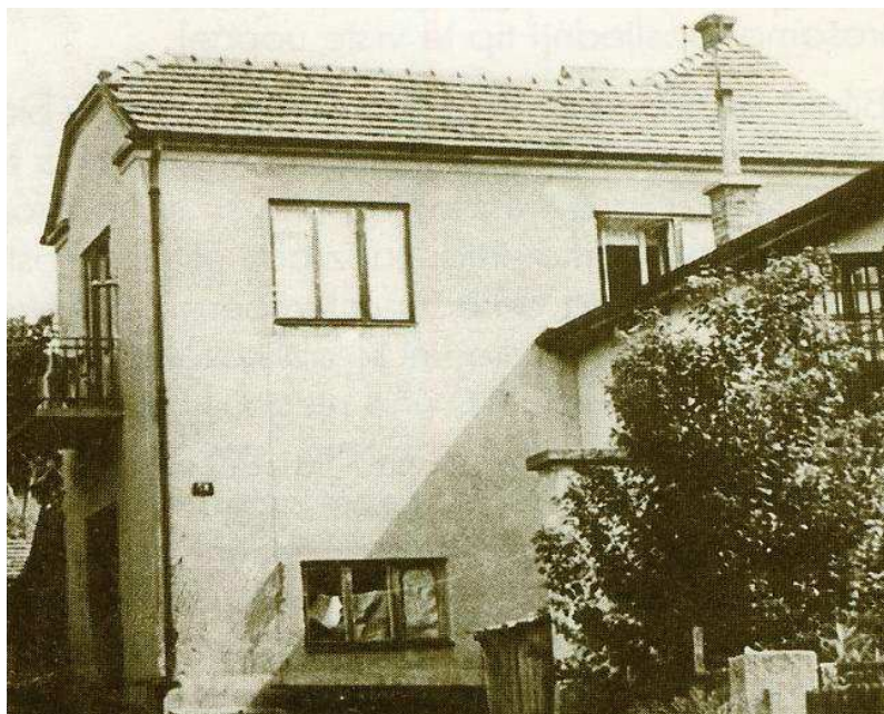
Slika 12. Od 18. siječnja 1938. u Zagrebu na adresi Sv. Duh 50b počeo je raditi Elektroton.

15 000 ploča. Imali su prodavaonicu u Ljubljani, na adresi Prohod nebotičnika.