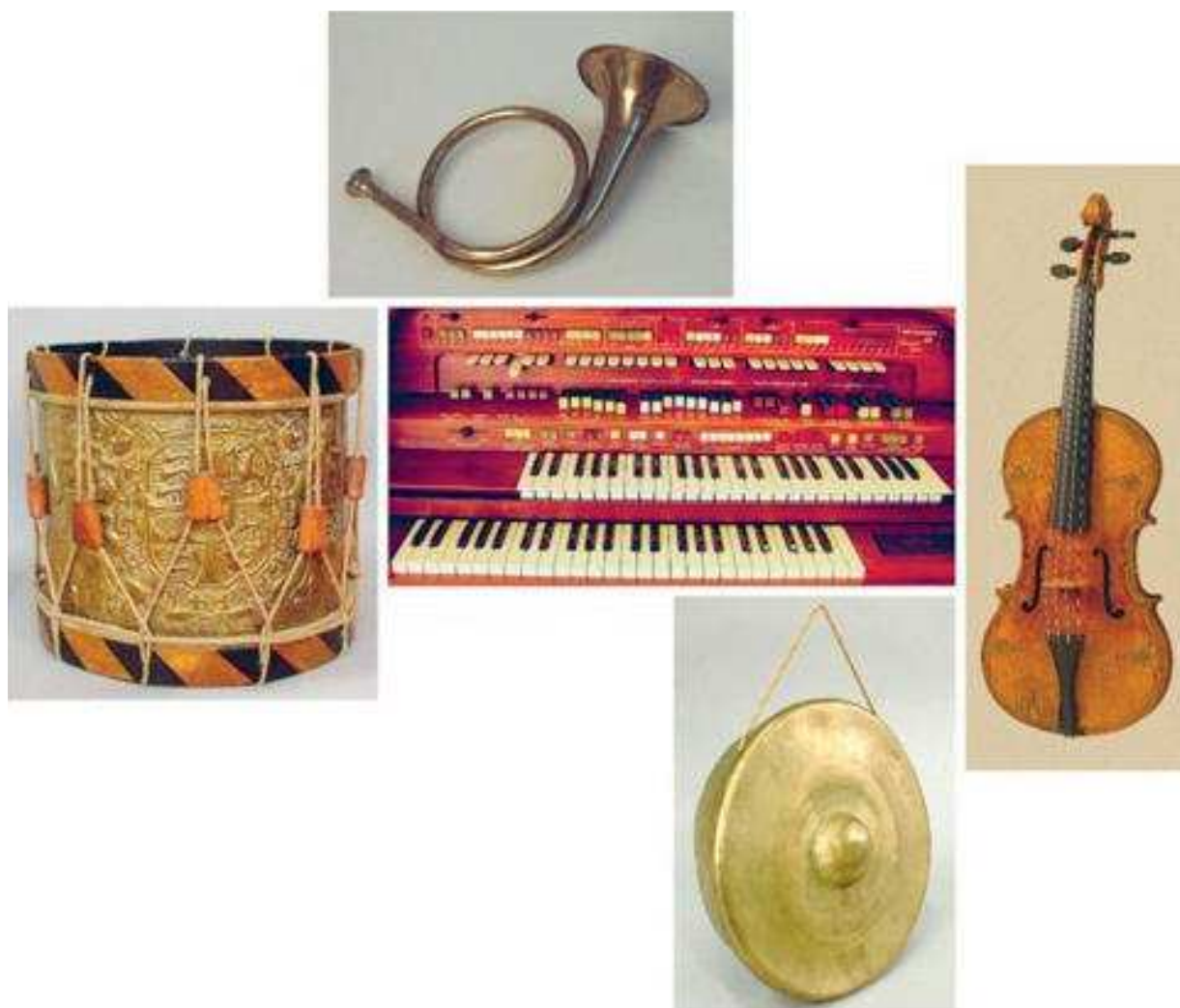
Slika 2. Pet načela stvaranja zvuka.

što su akustički stropovi s ugrađenim usmjerenim zvučnicima, stupovi s legendama na dodirnicima, izložbene vitrine s čipovima za preuzimanje detaljnih informacija, ručni iPadovi, videozapisi i audiozapisi dostupni uz pomoć video-vizualne opreme.