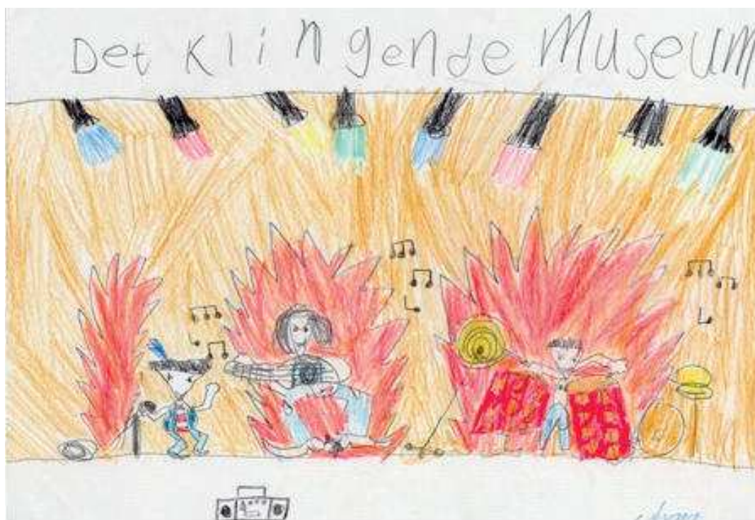
Slika 7. Na kraju polugodišta: Asger (devetogodišnjak), Zvučni muzej