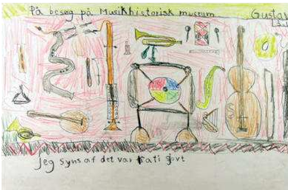
Slika 6. Na kraju polugodišta devetogodišnji je Gustav napisao: Posjet Muzeju glazbe. Mislim da je stvarno bilo zabavno.