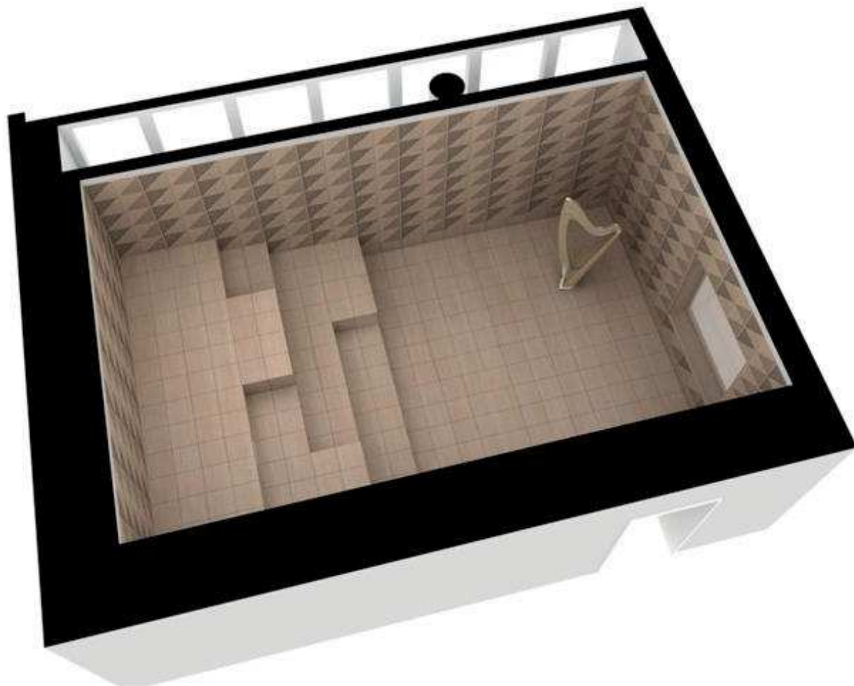
Slika 3. Projekt Igraonice, AdeptArchitects. S prozora se pruža pogled na izvaneuropsku izložbu.

predmetu, i to postizemo automatskim zavjesama i venecijanskim roletama, kao i UV filtrima na prozorima te na staklima izložbenih vitrina.