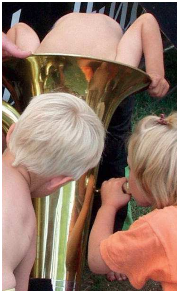
Slika 1. Potraga za zvukom glazbe; snimio: Kurt Larsen

odnosa između zvuka i predmeta, glazbenog izričaja, umjetničkog rada i tehnološkog razvoja.