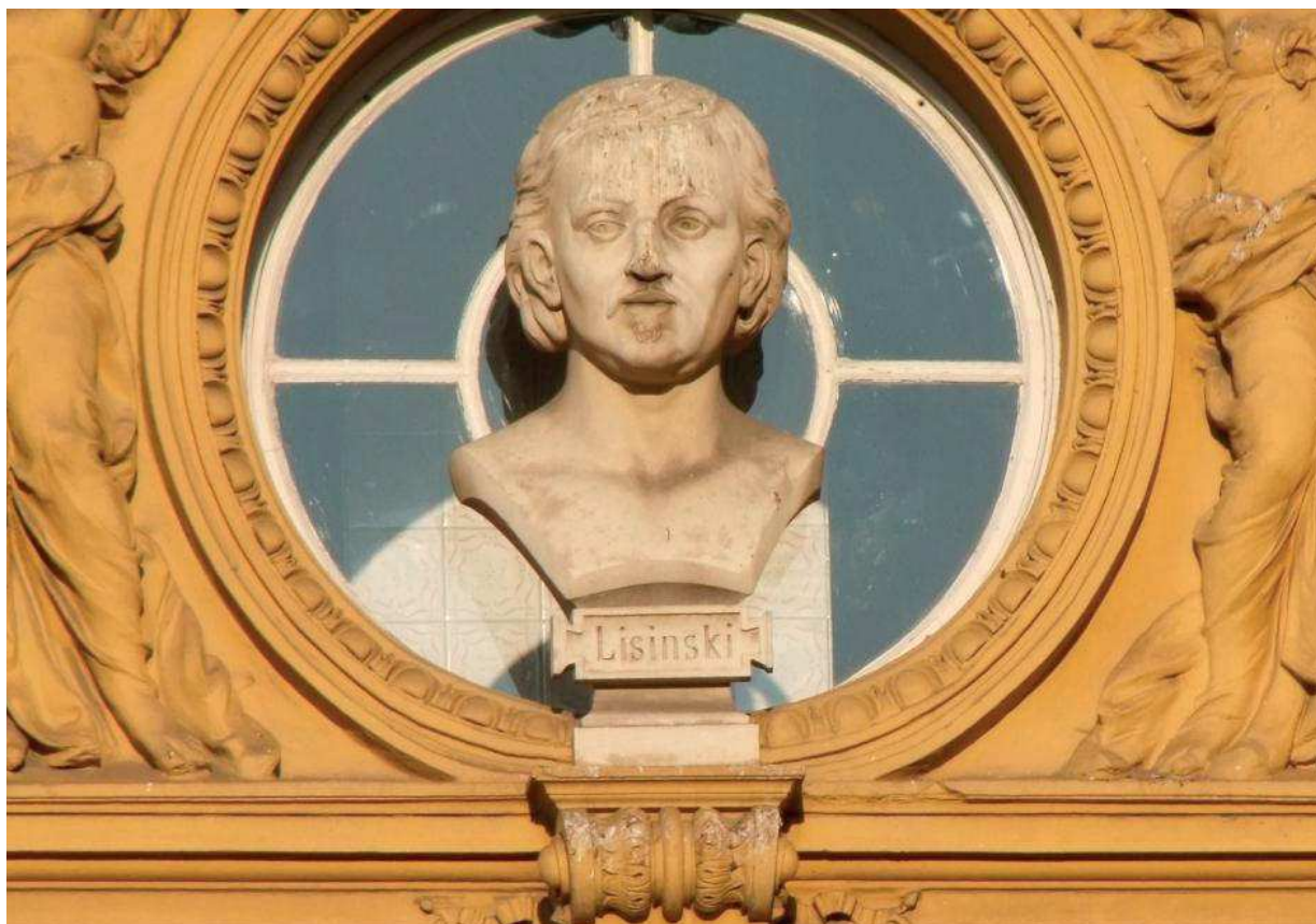
Slika 6. Bita Vatroslava Lisinskog (detalj)

Zagrebački su muzeji ujedno i koncertni prostori. Prvi je to postao Muzej za umjetnost i obrt, i to još 1952. godine. Potom su pokrenuti ciklusi koncerata u Muzeju grada Zagreba i u Hrvatskome povijesnome muzeju. Muzej Mimara postao je standardna lokacija glazbenog života Zagreba, a najbolji dokaz za to je Zbor Hrvatske radio-televizije fotografiran za internetsku stranicu Glazbene proizvodnje upravo ispred Muzeja Mimara, u kojemu godinama održava svoj ciklus