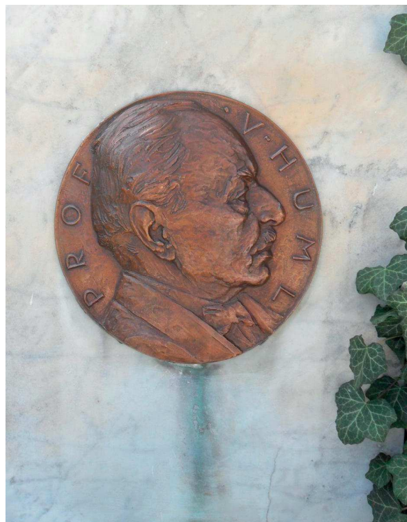
Slika 4. Portret Vaclava Humla

Premda i gradovi i muzeji imaju svoje čuvarе, oni muzejski obavljaju, čini se, lakši posao. Svakodnevno smo svjedoci da gradski čuvari ne mogu stati na kraj grafitima, pa to, nažalost, ima posljedice