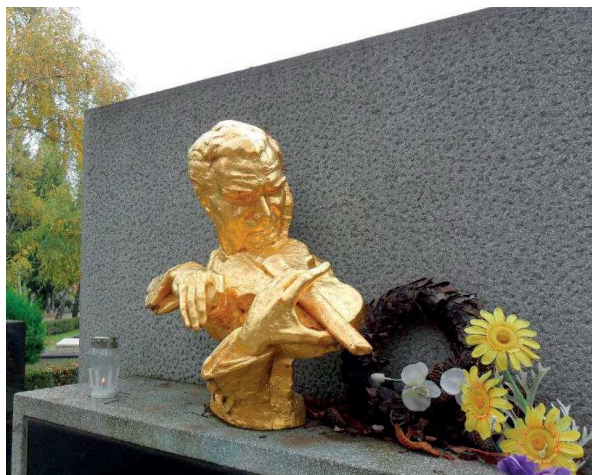
Slika 2. Bista Zlatka Balokovića, rad Augusta Augustinčića