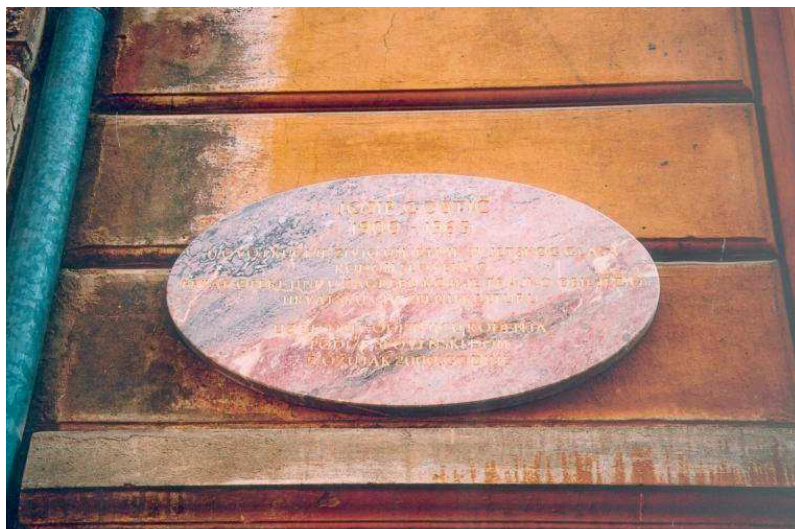
Slika 1. Spomen-ploča Josipu Gostiću

svakodnevno, premda je Robert Musil rekao kako „ništa nije tako neprimjetno kao što je to spomenik“. 9