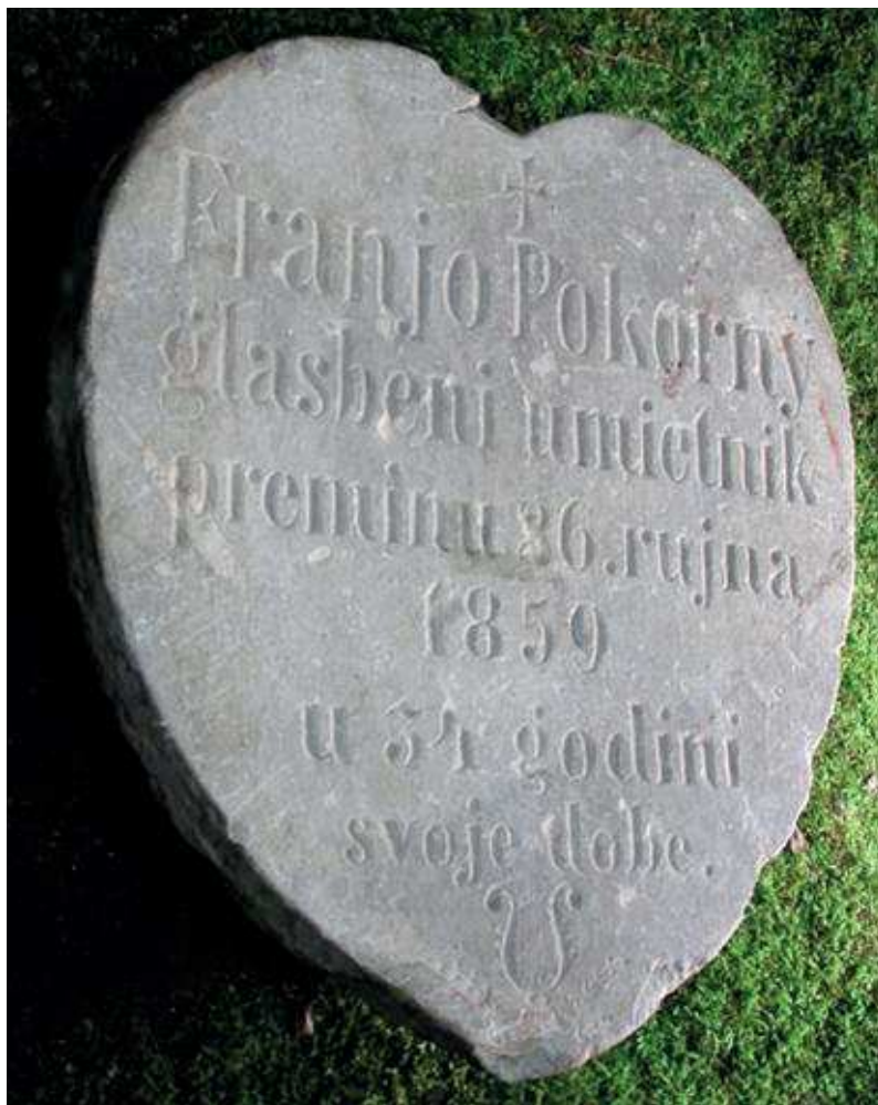
Slika 9. Nadgrobni kamen Franji Pokornom

da točna informacija dopre do javnosti ili da spomen-obilježja budu vidljiva, da se obnavljaju i čuvaju. Jer ta su spomen-obilježja, kao i svi ostali dijelovi živoga gradskog organizma, podložna promjenama, nestajanju i uništavanju.