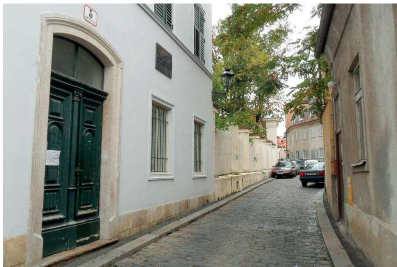
Slika 5. Spomen-ploča Milki Trnini

ulici 5, postavljena visoko iznad uobičajenog vidokruga šetača (sl. 5.). Svakako treba razlikovati taj primjer od bista koje su svojedobno bile standardni ukras na zgradama, poput biste Vatroslava Lisinskog visoko iznad vrata na zapadnoj fasadi Hrvatskoga narodnog kazališta (sl. 6. i 7.), koja stoga i nije uključena u popis spomenika u prilogu.