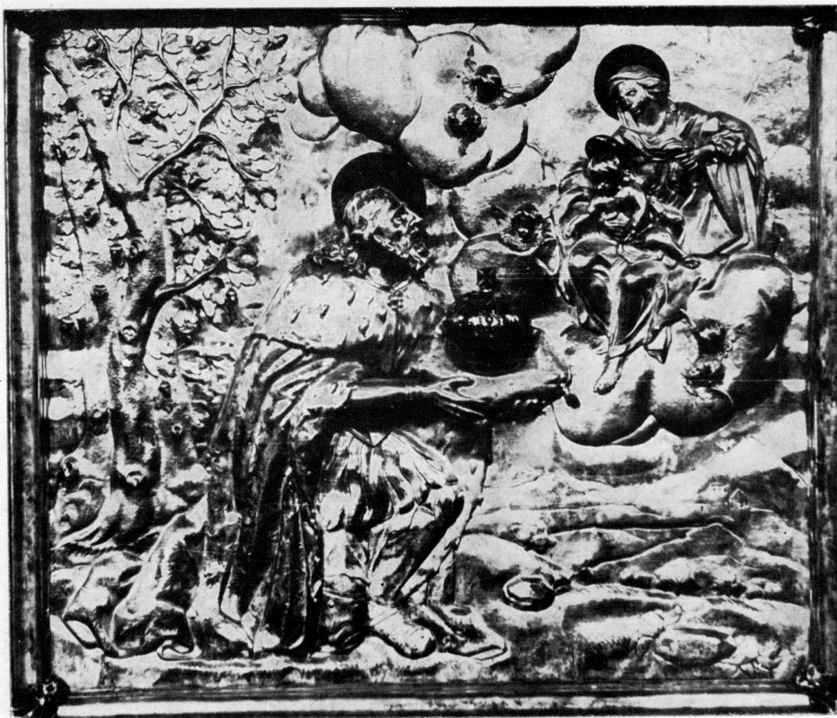
Georg Caspar Meichl: Sv. Stjepan pred Bogorodicom. Pobočni reljef antependija zagrebačke katedrale iz 1721. godine