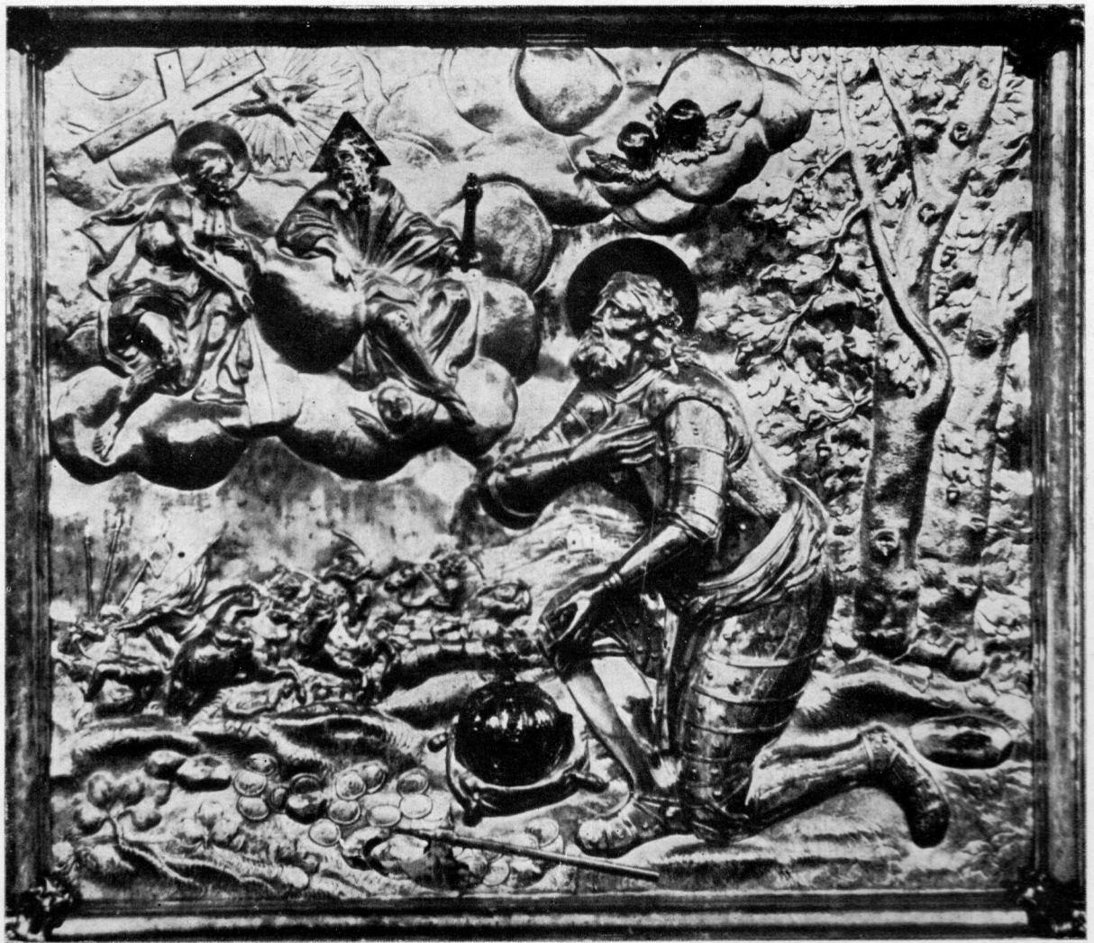
Georg Caspar Meichl: Sv. Ladislav pred sv. Trojstvom. Pobočni reljef antependija zagrebačke katedrale iz 1721. godine