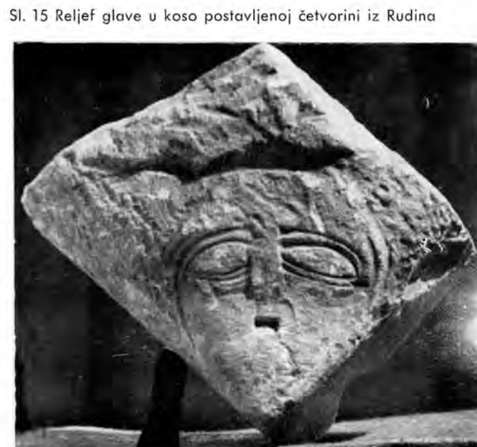
Sl. 15 Reljef glave u koso postavljenoj četvorini iz Rudina