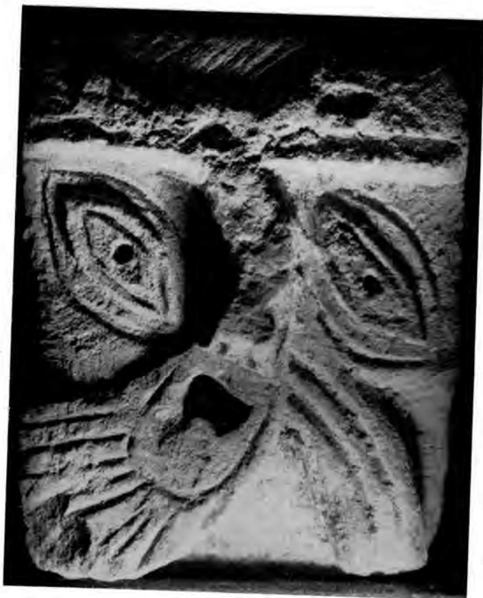
Sl. 16 Reljef glave s koso položenim očima iz Rudina