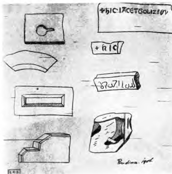
Sl. 6 Nalazi iz ruševina Rudina (crtež Gj. Szabo, 1906)