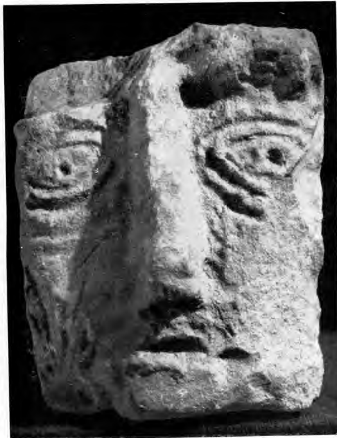
Sl. 21 Reljef golobrade glave iz Rudina