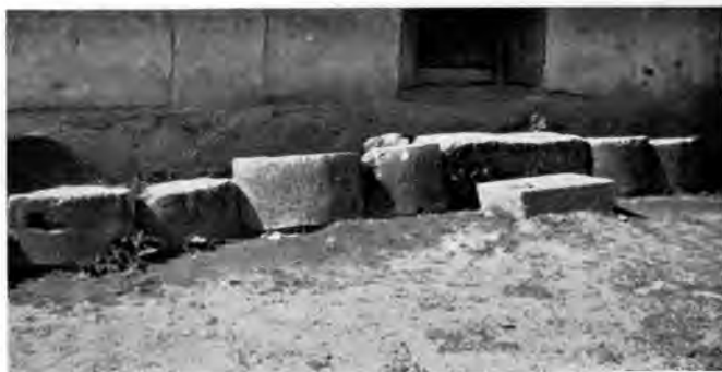
Sl. 9 Klesanci s ruševina Rudina u Šnjegoviću

G. 1210. spominju se Rudine indirektno onom prilikom kad kralj Andrija II dariva u blizini templarima zemlje ovim riječima: ... »illa uero uia descendens de Potuz ducit Rudinam« ... 15 Tom prilikom, kad se radilo o nekom drugom predmetu, ne spominje se ni samostan ni crkva, nego naprosto Rudina, — moguće kao tada već opće poznati pojam u ovome kraju. Sama riječ može da označava i tratinu. 16 No kako je riječ »Rudina« napisana velikim početnim slovom, ta okolnost može nukati na zaključak da se radi o nazivu nekog obitavališta, a ne o tratini. Međutim to ne mora da bude odlučujuće, jer se srednjovjekovni pisari ne pridržavaju ujednačenog pisanja, pa jednom jednu te istu riječ pišu razno, liko sad velikim, a drugi puta malim početnim slovom. Uvjerljiv je dokaz taj da se radi o Rudinama obitavalištu, što k toj tački vodi cesta — moguće još s obzirom na antikne nalaze u okolici — rimska. Radi se o cesti koja je iz daruvarskoga kraja (Potuz kod Daruvara) išla preko Dragovića u Požešku kotlinu. 17 Prema tome, možemo s velikom vjerojatnošću držati da Rudine već početkom XIII st. postoje i da po svoj prilici nisu bile u to vrijeme u teže pristupačnom i relativno neprohodnom predjelu, kako se to danas čini. 18