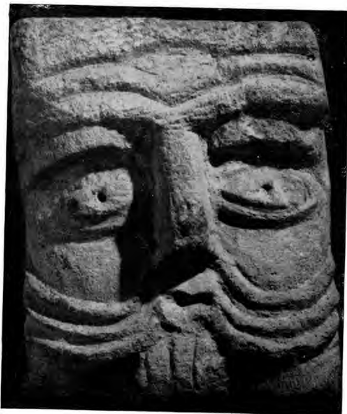
Sl. 20 Reljef bradate i brkate glave iz Rudina

meniku još dosljedno provedeno izražavanje u stilu pletera — najvjerojatnije potječe iz prve pol. XIII st. Taj križ iz Rudina, oblikovan u stilu pletera, nije osamljena pojava na području Slavonije. Srodan, dosad nepoznat križ u stručnoj literaturi, također riješen u stilu pletera, s odebljalim obodom, no bez razrađenog trolista, zapažen je g. 1958, prilikom istraživanja kotara Našice na evidencijskom putovanju u Koški (sl. 24). Još danas stoji on uklesan u luneti rustično izvedenog romaničkog portala seoske crkve (sada prežbukan, pa se teško razabiru pojedinosti); Koška je kojih 80 km zračne linije udaljena od Rudina. Taj je križ popraćen i rozetama, čestim motivom romanike, koji se vjerojatno kao solarno-lunarnog značaja nalazi kasnije i na brojnim stećcima XIV—XV st. 49 Tim općim motivom romanike dakako ne dovodim Košku u vezu s Hercegovinom i Bosnom, nego prije s Mađarskom, jer samo ime Koška dolazi od riječi Kos (mađarski: kos = jarc), pod kojim se imenom g. 1388. javlja grad (Kosvár). 50