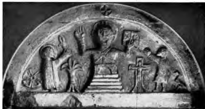
Sl. 32 Reljef s portala u Elstertrebnitzu (XII st.)

Im zentralen Teil Slavoniens (im Norden der Volksrepublik Kroatien) befinden sich westlich von Požega am Abhang eines Berges die Überreste der Ruine eines grossen mittelalterlichen Komplexes, wo einst die Benediktinerabtei des hl. Michael stand. (Bld. 1, 2) Am Anfang des XVIII. Jhs. — nach der türkischen Herrschaft über dieses Gebiet (1537—1688), nahm man an, dass sich an dieser Stelle einst eine Festung — »arx« — befunden hätte. 85 Von diesem ausgedehnten Komplex — der befestigt gewesen war (Bld. 6 mit Schiesscharte) — wurde durch Jahrzehnte Baumaterial verschleppt. (Bld. 2, 9, 10)