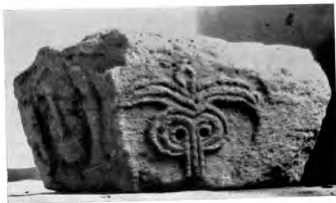
Sl. 25 Kapitel iz Rakovca (vjer. iz konca XII st.)

skog doba, u više navrata na spomenicima predromaničke — kod nas npr. u Dalmaciji. 60 Tu se radi o simboličkoj aluziji na euharistiju, što se ovdje još javlja u duhu narativne romanike u doba kad je na izmaku ornamentalna pleterni skulptura.