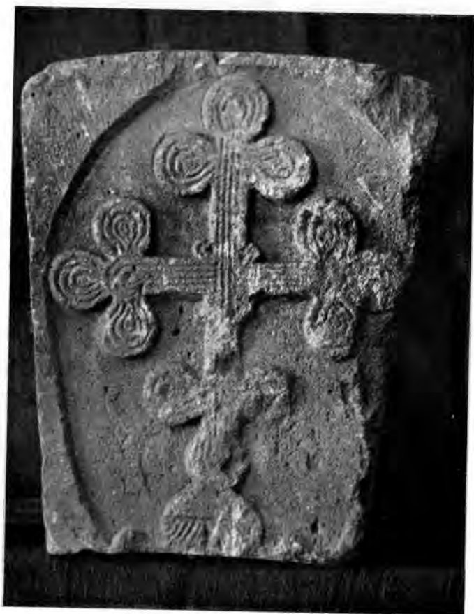
Sl. 13 Reljef križa iz Rudina

God. 1239. određuju se međe između pečuške i zagrebačke biskupije; tada se vidi da je pečuška biskupija obuhvatala cijeli požeški kraj. 19 I Rudine su se tada, dakle, nalazile unutar te dijeceze.