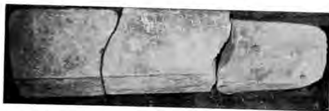
Sl. 7 Dio sarkofaga s Rudina

pisan latinicom (sl. 8). Karakteristična su slova A s produženom hastom gore i T s produženjem okomite haste, kakvi se tipovi slova kod nas upotrebljavaju još oko g. 1200. 10