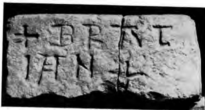
Sl. 8 Natpis s Rudina