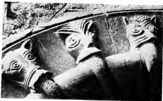
Sl. 27 »Beak-head« iz Oxforda (o. 1150)

vama, kao npr. u Linkolnu, dokle dopire lombardska inspiracija s utjecajem Modene između 1141—48.g. (sl. 31). 62