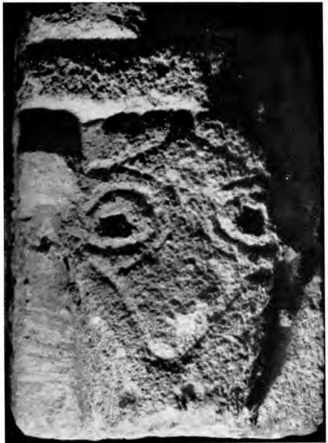
Sl. 14 Reljef glave noja iz Rudina