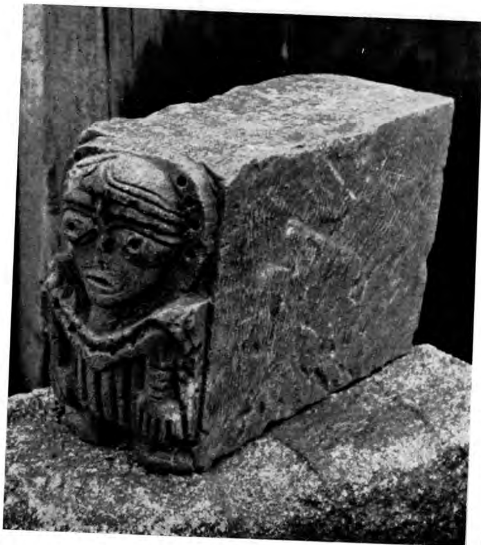
Sl. 23 Klesanac s reljefom svetačke figure (nađen u Kujniku) iz Rudina

na kamenu s dvije bradate glave (sl. 19) i kod reljefa sveca (sl. 23). Tu je sve potčinjeno oku, koje je napadno naglašeno; to još bijaše potencirano time što su svrdlane rupe zjenica po svoj prilici bile ispunjene olov- nim umecima.