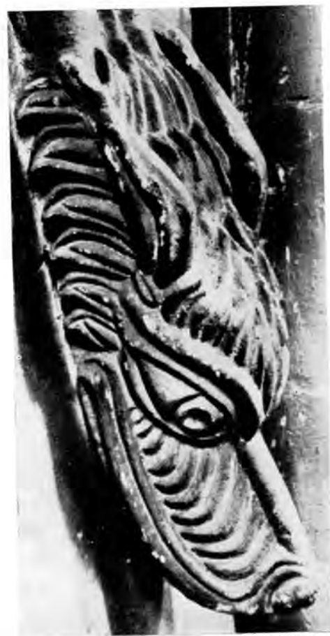
Sl. 26 Životinjska glava iz Malmesburyja (o. 1160)

Za ostale reljefe glava ne bi se moglo reći da imaju neko naročito značenje. One potječu iz nebiblijskih izvora. U njima je ispoljen smisao za ukras i humor, izražen grotesknom formom punom mašte. Čovjek je