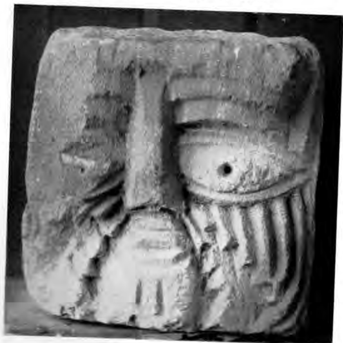
Sl. 17 Reljef glave s izbrazdanim licem iz Rudina

klesarijom križa, reljef životinjske glave, sedam reljefa ljudskih glava, te dvije cijele ljudske figure, što sve (osim sl. 17) čuva Muzej u Sl. Požegi.