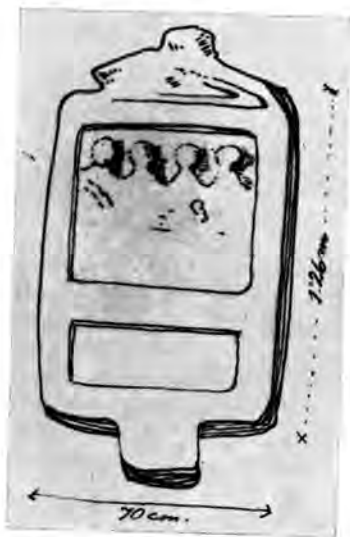
Sl. 5 Crtež antiknog spomenika iz Čečavca, podno Rudina (Gj. Szabo, 1906)

Koliko god se dugo i mnogo prekopavalo po ruševinama Rudina, čini se, teren još uvijek čuva iznenađenja, jer se 1956. našlo, osim poklopca sarkofaga (34 x 153 x 40 cm) sa strmim sljemenom (sl. 7), nadgrobnih natpisa, slijepih arkada, ulomaka kamena s geometrijskim ornamentima također i klesanac s ljudskom figurom,