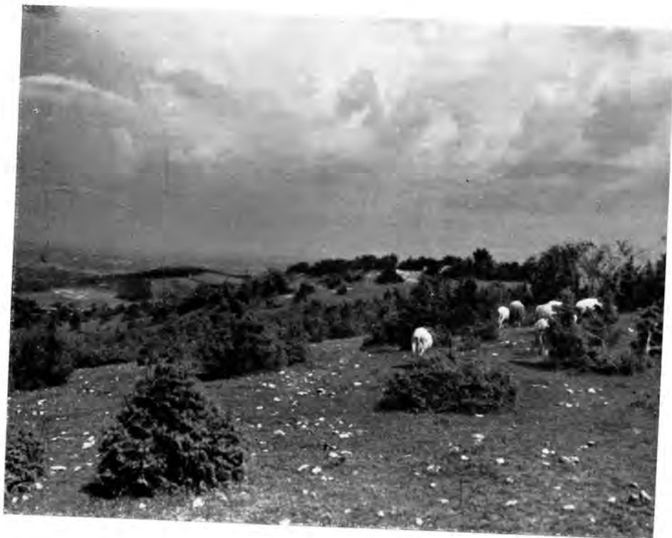
Sl. 1 Položaj Rudina na plećatom brdu

Time su donijeti novi pogledi na problem Rudina, koji se razlikuju od prijašnjih. Đuro Szabo je, naime, smatrao, na temelju onoga što je g. 1906. vidio na terenu, da je opatija na Rudinama građena u gotičkom stilu, na sličan način valjda kao opatije Svete Jelene od Podborja i u Bijeloj. To je mišljenje publicirao kao mlad ljubitelj starina, kad još nije bio ni konzervator Povjerenstva. 6 Iste godine 1906. bio je na Rudinama i Julije Kempf , brižni čuvar starina Požeške kotline, koji bijaše 1911. imenovan konzervatorom Povjerenstva za čuvanje spomenika za taj kraj. On je poslao dopis s bilješkama o Rudinama, Arheološkom muzeju u Za-