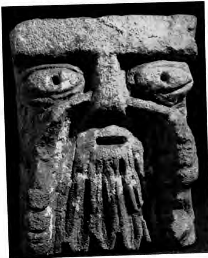
Sl. 18 Reljef glave s bradom iz Rudina

gušastom vratu. Okrugla se glava sužuje prema golobradom podbratku. Kose su označene s nekoliko crta. Brazde su na čelu takve kao da označuju dijamem. Nadočni rubovi prelaze u kratak nos. Usta malo otvorena imaju označene usnice. Na inače plastičnoj glavi naročito se ističu velike ispupčane oči s usrdlanim zjenicama. Glavu okružuje nimbus, optočen kružnim rupicama. 45