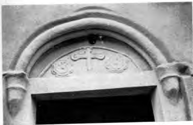
Sl. 24 Reljef križa na portalu crkve u Koški

Za stil rudinskih reljefa nalazimo, dakle, uporišta u romaničkoj umjetnosti, najviše na primjerima iz XII st. Nema sumnje da su oni bili intimno povezani s arhitekturom, kao njezin sastavni dio. Oblik je tih klesanaca takav (sl. 10, 23) da ih moramo zamišljati kao ukras plohe romaničkog zida, odnosno luka koji tek ponešto iskače iz linije zida, što se primjenjivalo na različitim dijelovima arhitekture širom zemalja gdje bijaše rasprostranjen romanički stil.