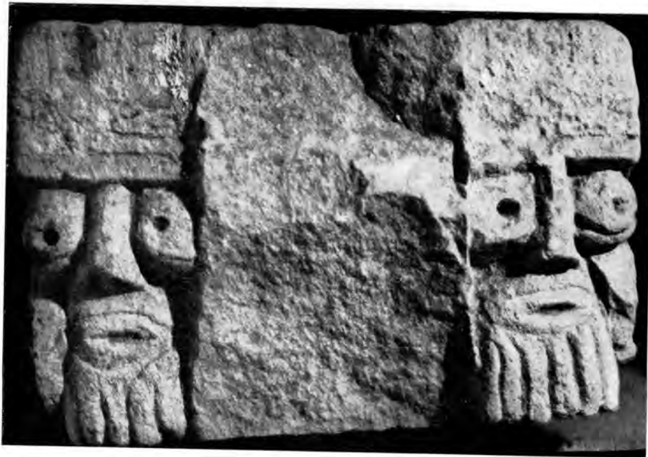
Sl. 19 Reljef dviju bradatih glava iz Rudina

Razrješavanje pletera u više od tri prutka ovdje nije odlučujuće toliko koliko okolnost da haste rudinskoga križa svršavaju izrazitim i pomno oblikovanim trolistima, koji su karakteristična pojava u ranoj gotici od prve pol. XIII st. 48 Prema tome — iako je na tom spo-