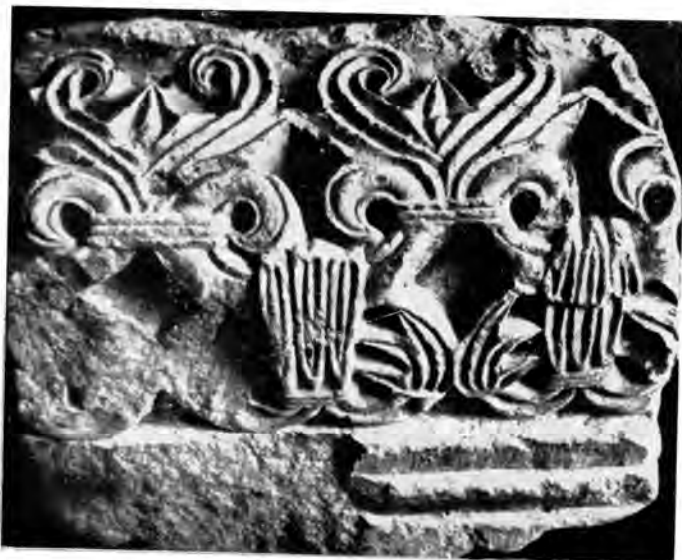
Sl. 28 Fragment iz stare katedrale u Veszprému

Tu češću pojavu u romanici da se proporcije ljudskog lika izvanredno skraćuju, vidimo i u reljefu sveca (sl. 23). Svetokrug oko glave tumači da se tu radi o nekoj svetačkoj figuri. Ruke spuštene niz tijelo nemaju nikakva atributa koji bi mogao dati putokaz da bi se moglo znati koga prikazuje. Da predstavlja osobu visokog položaja ili u zemaljskoj ili u nebeskoj hijerarhiji, moglo bi se moguće zaključiti po tome što je gornji obod haljine bio ukrašen plastičnim ukrasom koji ima evocirati dragulje: isto su tako morale biti ispunjene