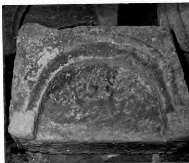
Sl. 11 Kamen s motivom slijepe arkade iz Rudina