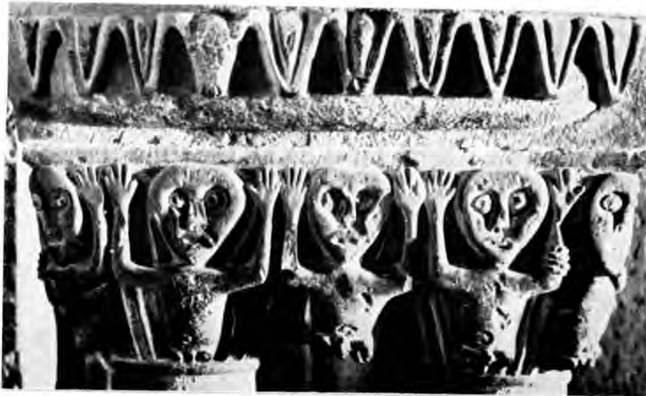
Sl. 33 Detalj s »atlantima« s propovjedaonice Gropina (Arezzo)

Zagrebu 70 , a da ne govorimo o nizu pojedinačnih što drvenih, što kamenih gotičkih plastika 71 . Stoji međutim da rudinski materijal zasad predstavlja najbogatiju skupinu na temu romaničke plastike kontinentalne Hrvatske, u kojem je dijelu romanička djelatnost ostala oskudno sačuvana. Jer i arhitektonsko-plastički figuralni dekor iz zagrebačke kapele sv. Stjepana 72 , iz Đakova, 73 iz Glogovnice, 74 Iloka 75 i Koške, kao i brončana raspela iz Martinšćine 76 i Siska 77 govorili su samo fragmentarno o tome da je val romaničkog likovnog oblikovanja zahvatio i sjeverne hrvatske krajeve.