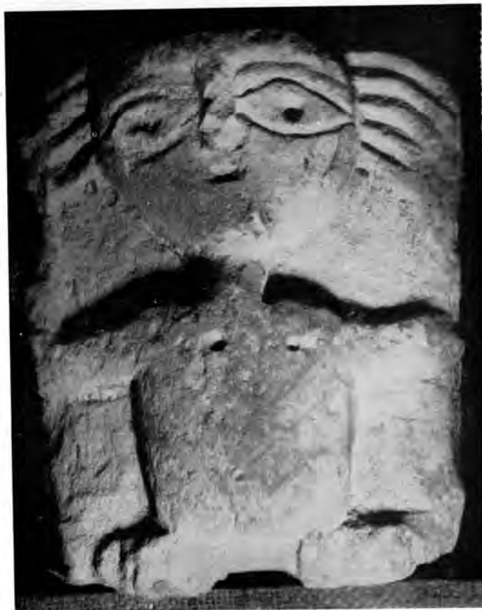
Sl. 22 Reljef nage ljudske figure (»atlant«) iz Rudina