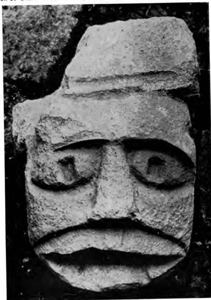
Sl. 30 Glava iz Corbeaua (XI st.)