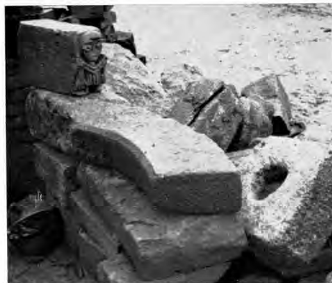
Sl. 10 Klesanci s Rudina nađeni u Kujniku