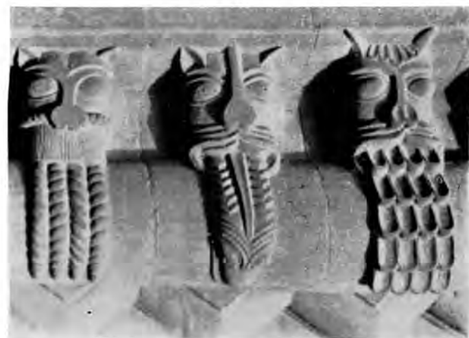
Sl. 31 Detalj portala s »beak-head« u Lincolnu (o. 1145)