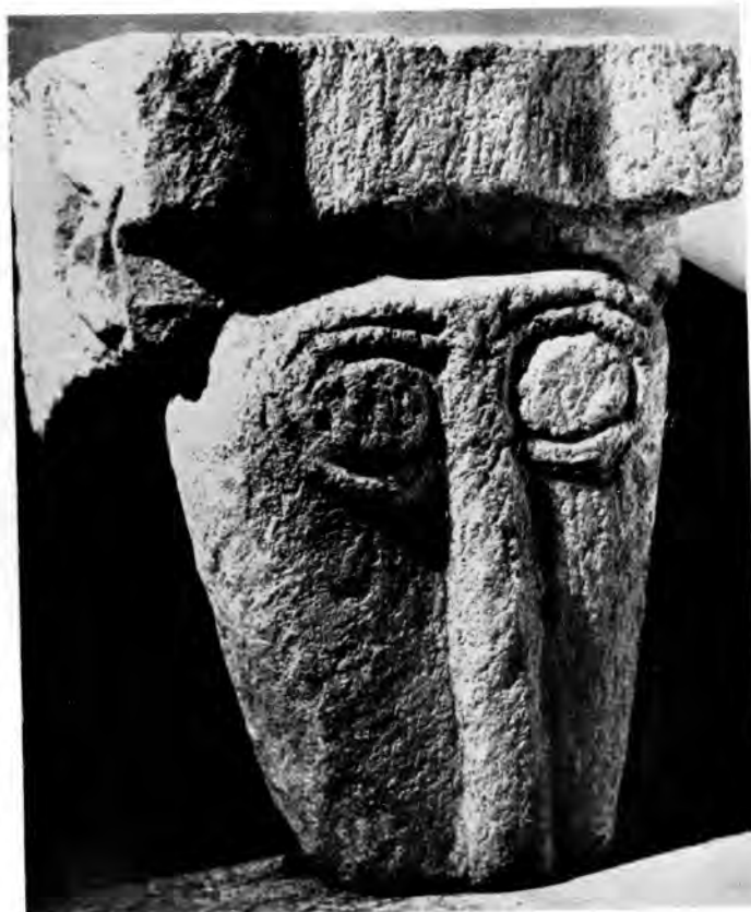
Sl. 29 Glava iz Modillona (XI/XII st.)