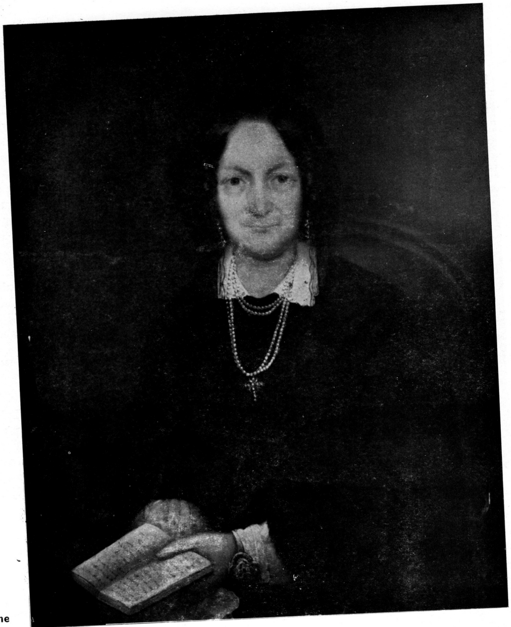
Josip Tominc, Portret nepoznate tene

starija lica. On ih ne uljepšava niti pomlađuje, ali njegov kist pokazuje istančanim osjećajem vrednote koje im je život utisnuo.