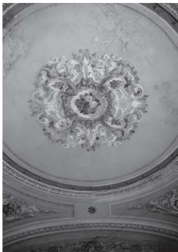
Slika 1. Oslík florealno-vegetabilnih motiva. Kurija Matačić-Dolansky. XIX. stoljeće.

po nebu. Hestija je prikazana u liku odrasle žene prekrivene bijelim velom, odjevene u zelenu haljinu, sa žuto-narančastom draperijom, lepršavih nabora iza leđa. Stoji pred gorućim žrtvenikom i promatra posudu s plamenom koju je podigla ljevicom. Heba je prikazana u liku žene ovjenčane crvenim cvijećem, odjevene u bijelu haljinu i plavu draperiju. Tijelo i glavu okreće udesno. Ljevicom drži vijenac cvijeća, a u šaci desnice metalni pehar.