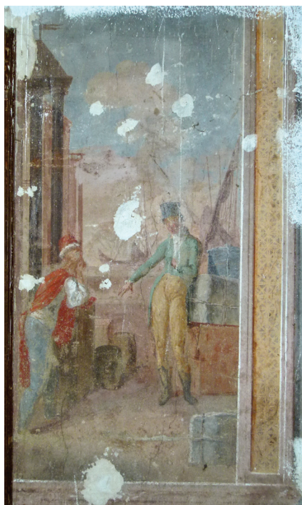
Slika 5. Detalj prizora dvojice muškaraca u razgovoru. Detalj zidnoga oslika Kurija Matačić-Dolansky. Oko 1800. godine.