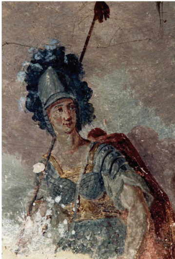
Slika 7. Artemida. Detalj zidnoga oslika. Kurija Matačić-Dolansky. Oko 1800. godine.

Usporedba načina slikanja volumena, prikaza anatomije, fizionomije lica i korištenja perspektive pokazuje da su oslik radila dva slikara, jedan spretniji od drugoga. Onaj spretniji je Artemidu prikazao u prirodnijem položaju, tijelo joj je skladnije, ruke i vrat su mišićavi i zaštićeni oklopom od sjajnoga metala ispod kojeg se naziru male okrugle grudi i uzak struk (sl. 7). Šljem s perjanicom koji nosi, slikar je prilagodio crtama lica i sjenčao ga da postigne voluminoznost. Na četvrtastom licu rumenih obraza linijom je nacrtao okrugle oči, trepavice, četvrtasti nos okrugloga vrha, usne, jednim potezom okruglu bradu. Takav tip četvrtastoga lica s kružnim vrhom nosa ponovio je pri Eos i Iridi. Spretniji je slikar naslikao i prizor rasprave između rimskoga kralja i vojnika, u nevještom perspektivnom skraćanju: prostorija se promatra iz dvije točke gledišta, prve povišene iz koje se vidi popločenje i druge snižene iz koje se vide tjemeni svodova. Skraćenje popločenja izvana u dubinu ne odgovara skraćanju podija, čije se stranice šire u dubinu.