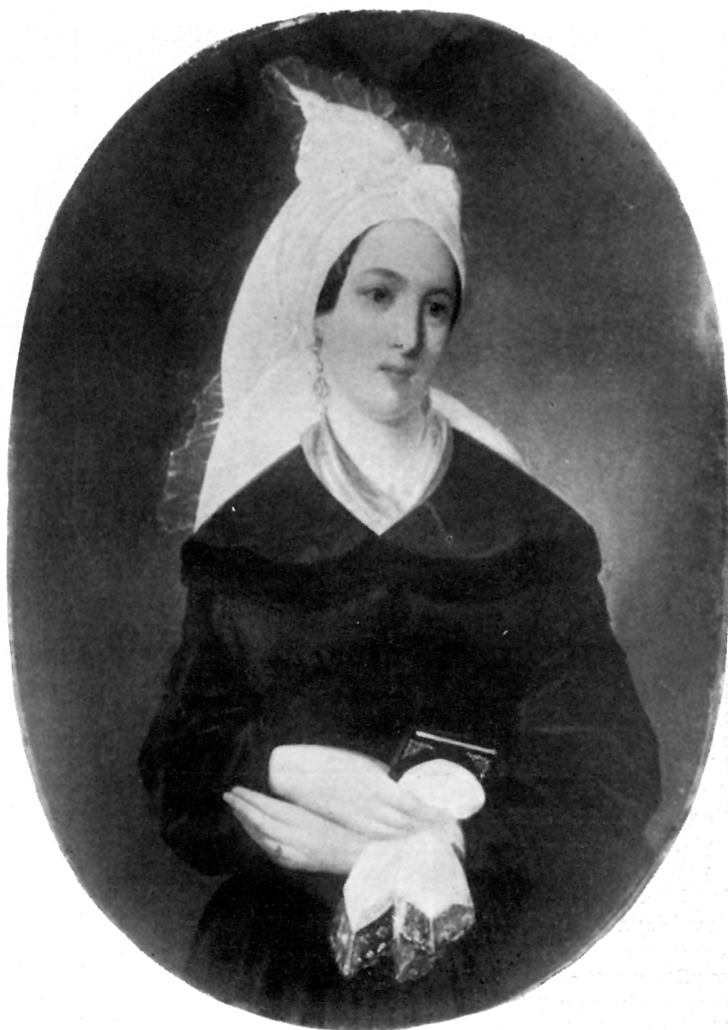
2 PORTRET LJUBLJANSKE GRADANKE — Ljubljana, Narodna galerija

da treba započeti rad nastaviti. 7 Bilo je potrebno, osim već pronađenih arhivskih podataka o njegovu školovanju u bečkoj Akademiji, oživjeti ambijent u kojemu se Stroy kretao, pronaći njegove suvremenike — slikare i profesore kod kojih je učio te pratiti njihova kretanja u Akademiji i izvan nje. A kada je i to dovršeno bilo je omogućeno pratiti njihovo djelovanje, njihove životne putove i konačno gledati njihova djela u bečkim galerijama. 8 A to je, nakon izvršenih arhivskih traganja, pomoglo da se uoče poneke bliske i srodne crte i utjecaje suvremene sredine na Stroyev slikarski opus.