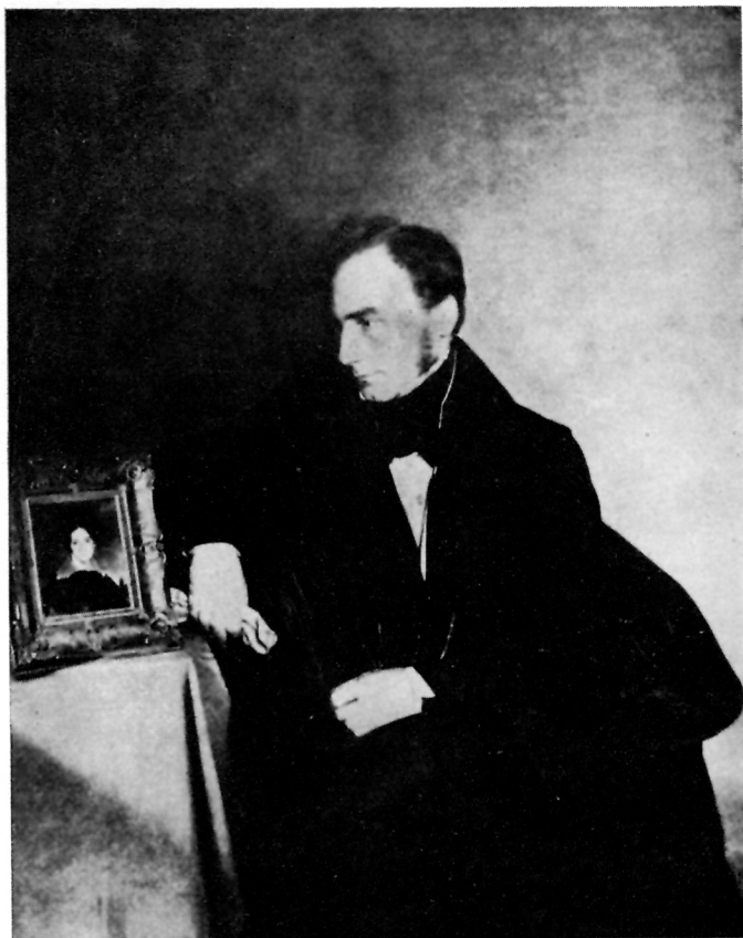
3 Franz Eybl, PORTRET SLIKARA FRANZA WIPPLINGERA, Wien, Österreichische Galerie des XIX u. XX Jhs. (1833)