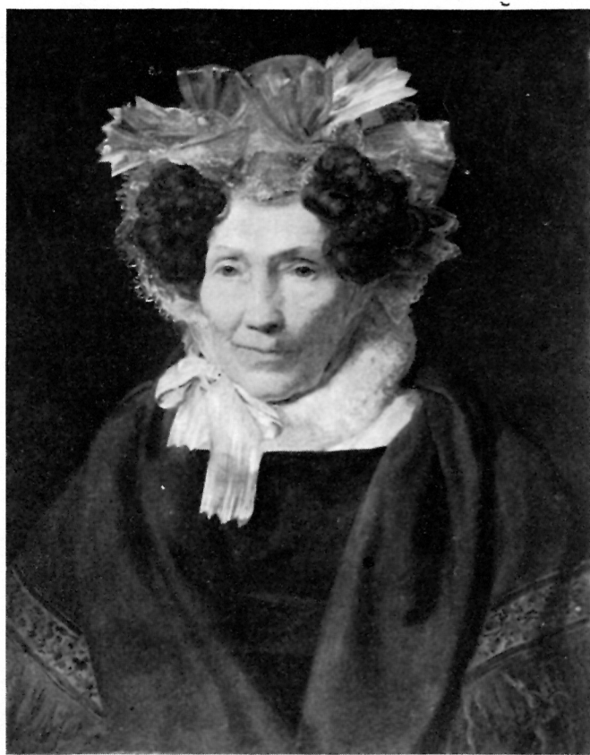
4 Ferdinand Georg Waldmüller, PORTRET STARE GOSPODE, Wien Österreichische Galerie des XIX u. XX Jhs. (1833)

tom vremenu, još uvijek velikog umjetničkog prestiža Italije, prešutio u svom oglasu Veneciju ili Rim. No ipak to pitanje zasada ostaje otvoreno.