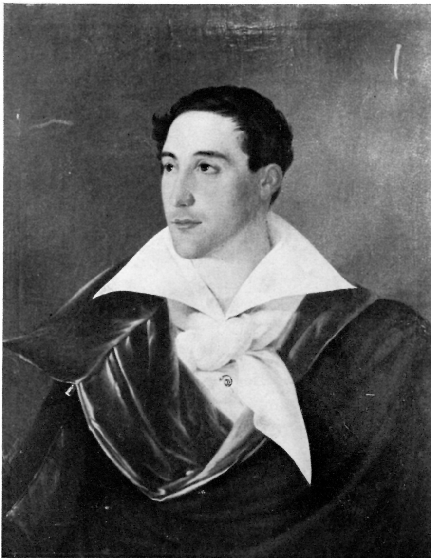
6 PORTRET MUŠKARCA S BIJELIM OVRATNIKOM Zagreb, Moderna galerija