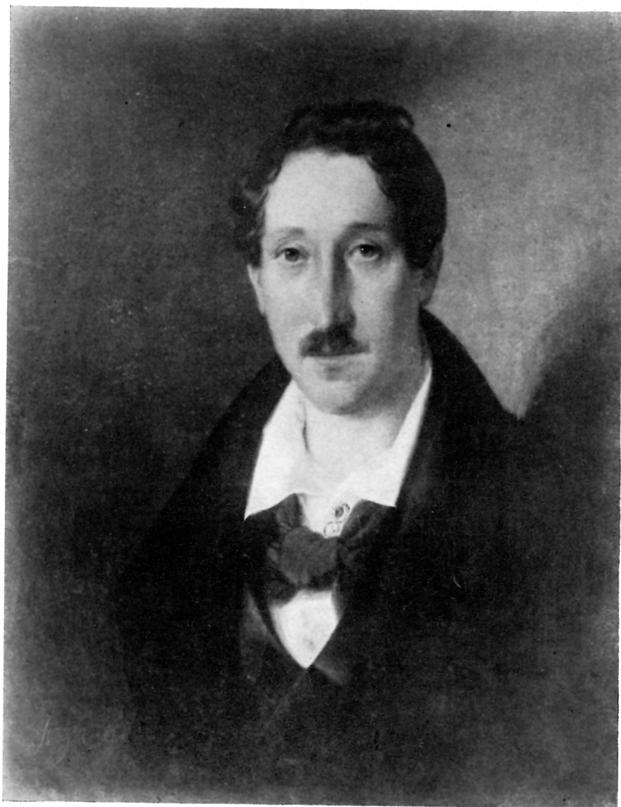
7 PORTRET MUŠKARCA S CRVENOM KRAVATOM — Ljubljana, Narodna galerija