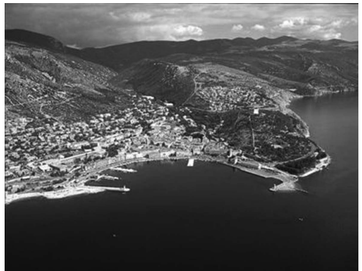
Senj danas, pogled na prijevoj Vratnik

Većina znanstvenika pretpostavlja kako je Oktavijan,