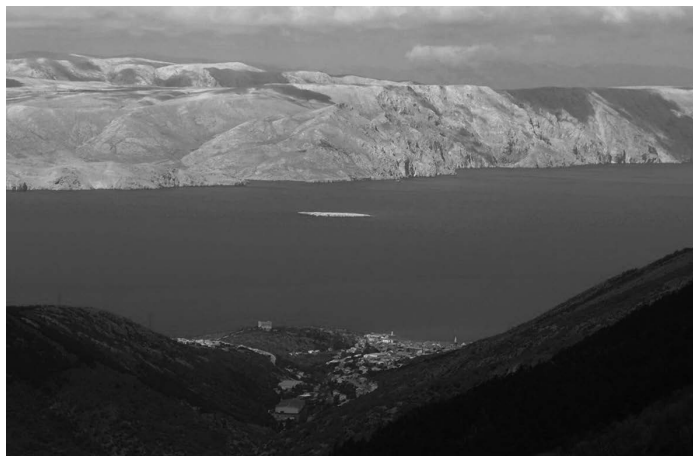
Pogled s prijevoja Vratnik na Senj, Krk i otok Zec

Kasna antika vrijeme je osiromašenja i odumiranja života u Seniji. Sve su češći sukobi Rimljana s barbarima u unutrašnjosti kontinenta i na granicama Carstva. U tim nemirnim vremenima seobe naroda, preko prijevoja Vratnik spustila se neka ratoborna skupina koja je opljačkala i spalila grad, a u povijesnom kontekstu tada prestaje razdoblje antike u Seniji. Nasilnoj smrti antike svjedoče tragovi rušenja i paljenja koji su uočeni u arheološkim istraživanjima na raznim antičkim građevinama. Barbari prekidaju zlatno doba grada, ubrzo propada Rimsko carstvo i Senia, kao mnogi drugi gradovi našeg područja, dolazi pod vlast Istočnih Gota. Njihova vlast potrajat će do sredine 6. stoljeća. Senia još uvijek postoji kao grad, ali više nema ono značenje koje je imala u vrijeme rimske vladavine. Trgovina kao glavni pokretač grada brzo opada. Krajem ostrogotske vlasti Senia potpada pod bizantsku provincijalnu vlast. Dolaskom Avara i Slavena početkom 7. stoljeća raspada se bizantski upravni sustav na ovom području i to je vrijeme konačnog rušenja Senije (SPOMENICA, 2013: 11).