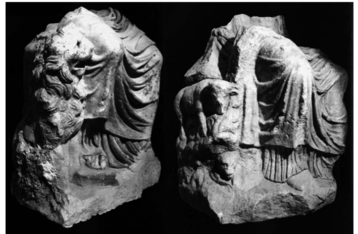
Skulptura A i B

odnosno Kibeles 9 . Pronađene su i dvije oštećene skulpture božice 10 . Rađene su od bijelog mramora i prikazuju božicu u sjedećem položaju, ali od obje je sačuvan samo donji dio. Skulptura A prikazuje božicu koja sjedi na tronu, od kojega su vidljivi rukohvati, a s obje strane trona prikazani su lavovi. Skulptura B također prikazuje božicu na tronu, ali za razliku od skulpture A, gdje je božica prikazana u svom klasičnom obliku, na njoj nisu prikazani lavovi, već životinje u planinskom ambijentu. Na desnoj bočnoj strani je bik koji brsti grm, ispod njega je ovca i malo desno je lav koji vrebava. Na lijevoj se strani raspoznaju bik i jarac. Smatra se kako neobična ikonografija prikazuje zapravo životinje u pejzažu (Glavičić, 2013: 7-39).