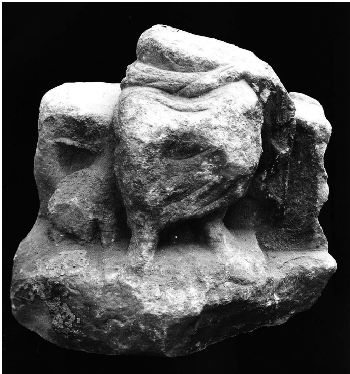
Mali kip Serapisa

Godine 1898. u zidu palače Vukasović otkriven je mali mramorni kip boga Serapisa 13 . Kao u slučaju Kibelinih kipova i ovaj je sačuvan samo od torza prema dolje. Znamo da se radi o prikazu egipatskog boga jer se ispod baze nalazio posvetni natpis. Inače bog je prikazan kako sjedi na tronu, s desne strane sačuvan je prikaz drva ili stupa na koje se božanstvo naslanja, a s lijeve strane prikazana je neka životinja. Radi se o kipu malih dimenzija pa se može pretpostaviti da je bio postavljen u privatnoj kući, ali zbog posvete vjerojatnije je bio postavljen u nekom manjem svetištu (Glavičić, 2013: 81-89).