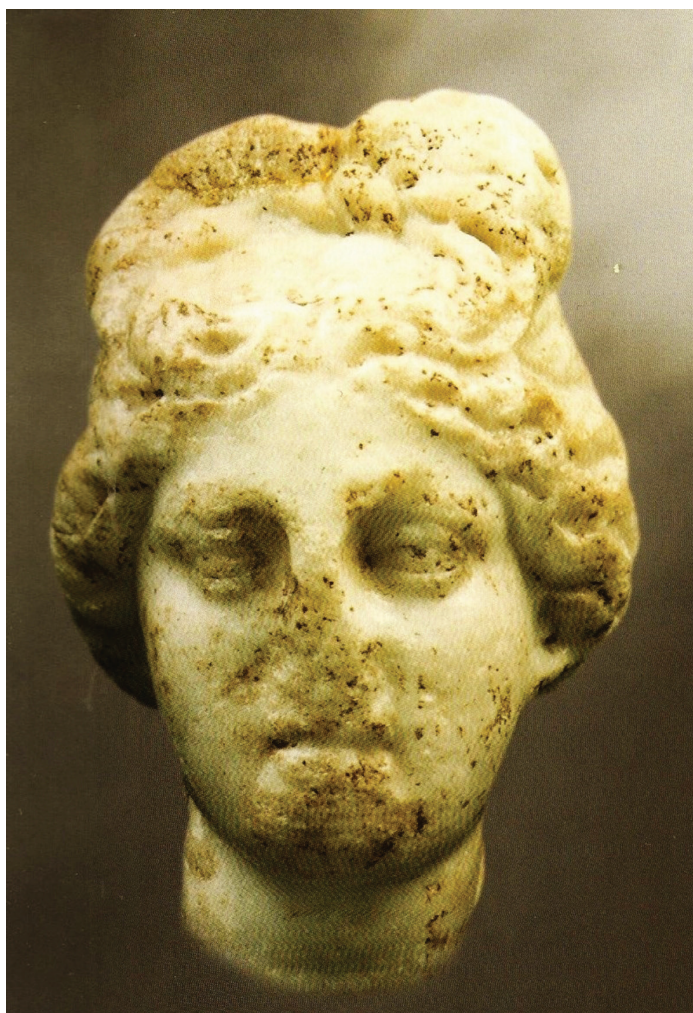
Glava božice Dijane

Skulptura božice Dijane nije pronađena, ali zato postojanje njezina kulta u Seniji potvrđuju dva posvetna natpisa i glava božice, koja je otkrivena kao spolija 1949. godine. Prvo se smatralo kako glava pripada Kibelinoj skulpturi A, no prema lomu i promjeru vrata glave ona ne može pripadati tom torzu. Osim toga glava je prikazana s dugačkim pramenovima iznad čela spletenima u čvor ( krobilos ), što nikako nije tipično za Kibelu. Glava može prikazivati Dijanu ili Veneru, s obzirom da je već potvrđen kult Dijane u natpisima, smatra se da mramorna glava prikazuje božicu lova 11 . Datirana je u prvu polovicu 3. stoljeća (Glavičić, 2013: 39 – 59).