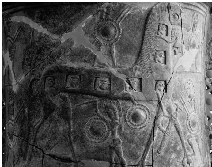
Najraniji poznati prikaz Trojanskog konja na vazi iz Mikonosa, oko 670. godine prije Krista.

Troja je kao velik grad postojala skoro dvije tisuće godina brončanoga doba, od oko 3000. do 950. godine prije Krista. Nakon što je bila napuštena prije početka željeznoga doba, Troju su ponovno naselili grčki kolonisti oko 750. godine prije Krista te je opstala kao razmjerno malen grčki grad tijekom cijele antike. Mnogo naraštaja različitih ljudi živjelo je u brončanodobnoj Troji. Danas nije lako identificirati nijednu od tih populacija, ali većina ih je ostavila znakove prosperiteta, bogatstva i moći. Unatoč tome, grad je s vremena na vrijeme bio izložen katastrofama. U različitim vremenskim razdobljima pogodili su ga požari, potresi i rat nakon čega je uvijek slijedila ponovna izgradnja.