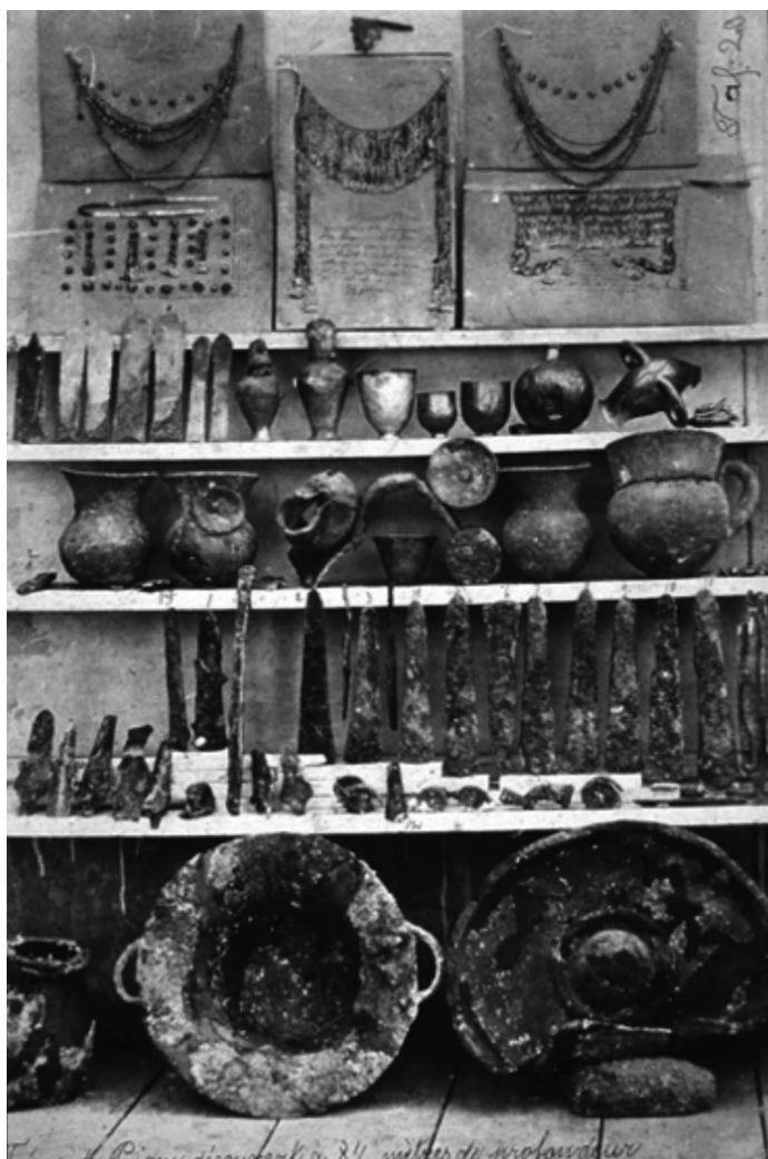
Artefakti što ih je u Troji II pronašao Heinrich Schliemann (tzv. "Prijamovo blago"). Blago je podijeljeno 1880. godine pa je ova fotografija zasigurno nastala prije toga.

Troja sloj VIIa. „Prijamovo blago“ sastoji se od brončanih pladnjeva i kotlova koji su iznutra ispunjeni zlatnim, srebrnim i brončanim peharima, zlatne „zjedlice za umak“, vaza, 13 brončanih vršaka koplja. Najljepši dio blaga, nazvan još i „Helenin nakit“, sastoji se od dekorativnih predmeta: zlatnih narukvica, ukrasa za kosu, četiri naušnice, dvije veličanstvene zlatne dijamante (jedna je izrađena od 16,000 sićušnih komada zlata). Schliemann je čak fotografirao svoju suprugu – Sophie Schliemann ukrašenu „Heleninim nakitom“ što je rezultiralo jednom od najpoznatijih fotografija 19. stoljeća (Wood, 1998: 56-59).