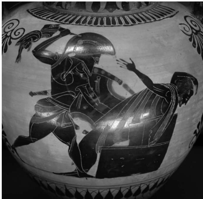
Ratnik u punoj ratnoj opremi ubija kralja Prijama. Detalj atičke amfore, 520. – 510. godina prije Krista.

Držak bodeža tipično je bogato ukrašavan, često kao simbol statusa borca. Homer u Ilijadi spominje korištenje borbenog mača, iako znanstvenici danas smatraju kako se to oružje pojavilo stotinjak godina poslije. Osim ubodnog oružja, na glasu su bili trojanski strijelci koji su koristili lukovi od rogova životinja. Takav luk mogao je dosegnuti daljinu od tri do sedam stotina stopa. Vršak strijele često je bio umočen u otrov (Ratovi kroz stoljeća, 2009: 31-32).