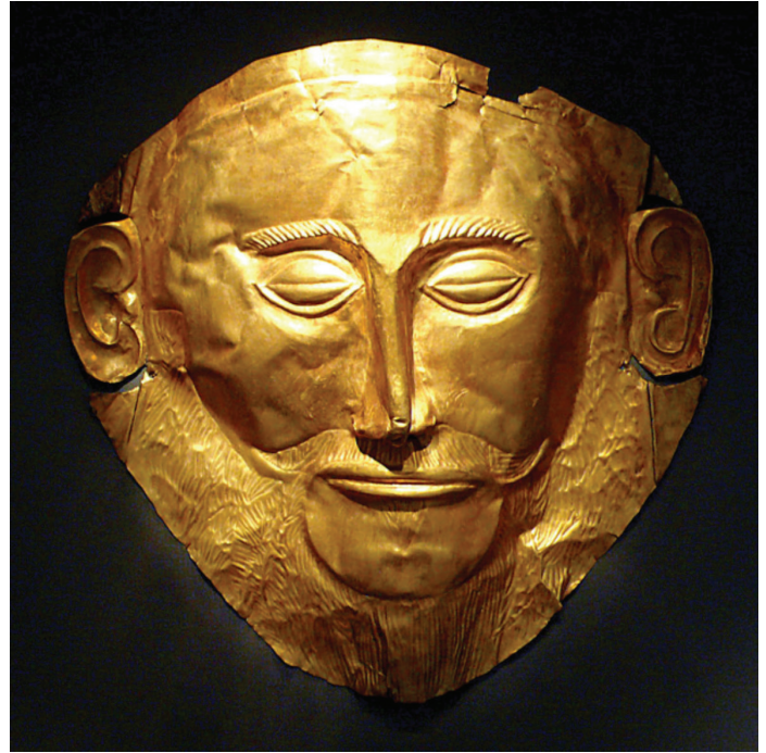
„Agamemnonova maska“ što ju je 1876. godine u Mikeni otkrio Heinrich Schliemann. Danas se vjeruje da je nastala prije legendarnog Trojanskog rata.

dijalektom, a formirao se tijekom 18. stoljeća prije Krista. Mikenska civilizacija trajala je od 16. stoljeća do oko 1200 godine prije Krista. Pisali su tekstove na glinenim pločicama pismom nazvanim linear B. Povijest linearnog B pisma sa sigurnošću određuje osobitosti civilizacije koju je mikenski narod širio na području Egejskog mora (Drevne civilizacije, 2006: 36 – 37).