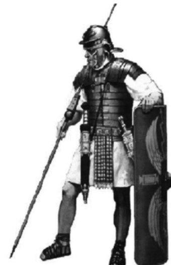
Post Marian Reform

Rimski vojnici prije i poslije reformi Gaja Marija