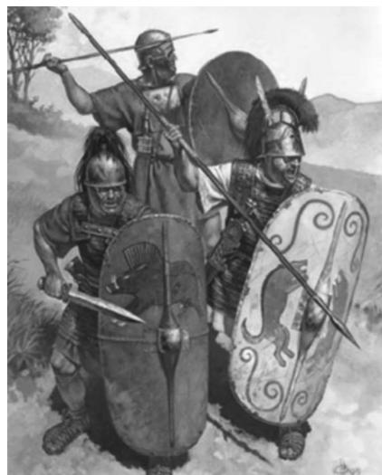
Pre Marian Reform

Mijenja se i organizacija vojske. Uvode se kohorte, koju su činile tri manipule 2 . Svaku kohortu čine šest centurija po 80 vojnika te je na kraju svaka kohorta imala 480 teško naoružanih pješaka. Sama legija broji deset kohorti što sveukupno dovodi do toga da legija ima otprilike 4800 vojnika. Rimska vojska tim reformama postaje stalna i profesionalna gdje građani Rima mogu