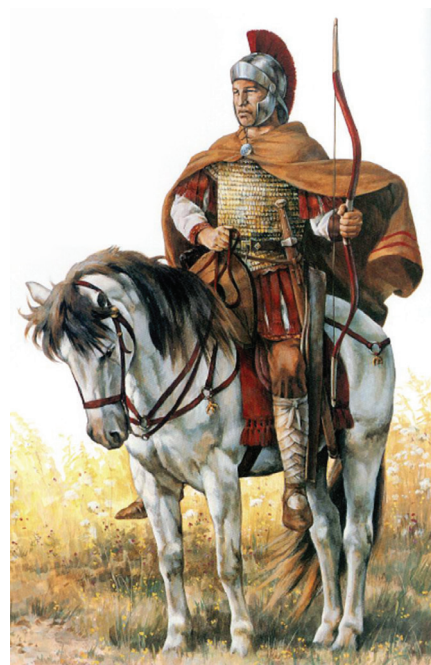
Rimski konjanik strijelac iz 6. stoljeća

Rimski uspjesi iz 530. godine počeli su ostavljati