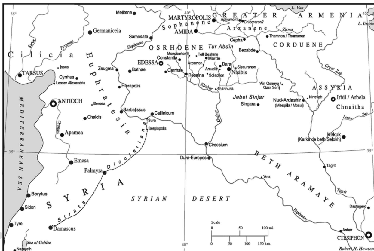
Zemljovid Bliskog Istoka u kasnoj antici

U već podmakloj dobi, Sasanidski vladar Kavadželio je osigurati prijestolje svom najdražem sinu Hozroju. Međutim, Hozroj nije bio najstariji i otac se pribijavao