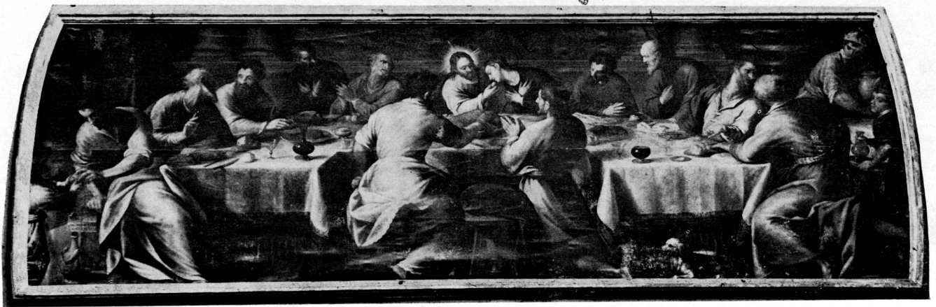
2 »Posljednja večera« u sustolnoj crkvi u Portogruaru

Oko stola, koji ima isti oblik, položaj i identično nabrani stolnjak kao na hvarskoj, na isti način postavljene flaše i čaše s vinom i skoro jednako raspoređene kriške kruha i tanjuri s hranom, grupirani su apostoli od kojih su neki identični s hvarskim u svojim impostacijama, pozama, fizionomijama, a i kolorističkim odnosima njihovih haljina. Naročito su frapantne analogije grupa Krista i Ivana, apostola lijevo od Krista i dvojice s leđa prikazanih apostola u bogato nabranim plaštevima s prvoga plana. Grupa apostola i prosjaka nalazi se u Hvaru na desnoj, a u Portogruaru na lijevoj strani. Slična je i arhitektura s bazama stupova u pozadini, dok su najveće razlike u lijevom i desnom dijelu kompozicije. Više nego li bilo koji zamorni komparativni opis o tim identičnostima, sličnostima, srodnostima i razlikama, najbolje govore reprodukcije obiju slika koje prilažemo uz ovaj članak. 3