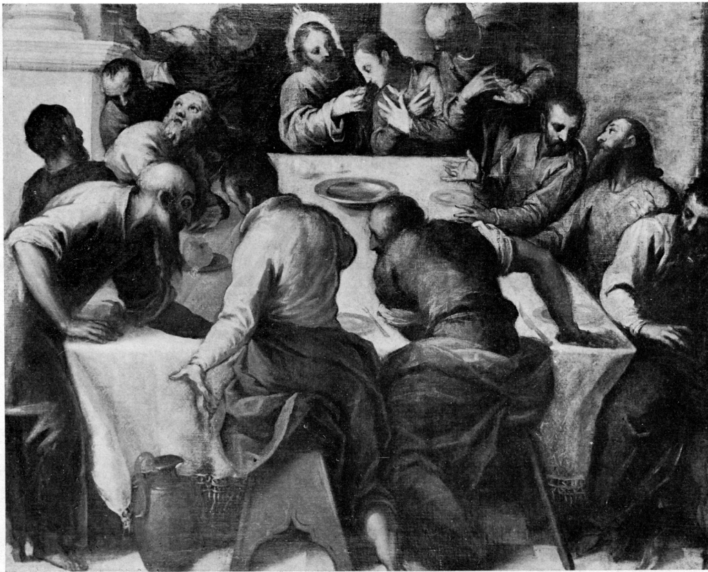
5 »Posljednja večera« Jacopa Palme Mladeg u Narodnoj galeriji u Pragu

obradbi materije i profinjenijim kolorističkim nijansama.