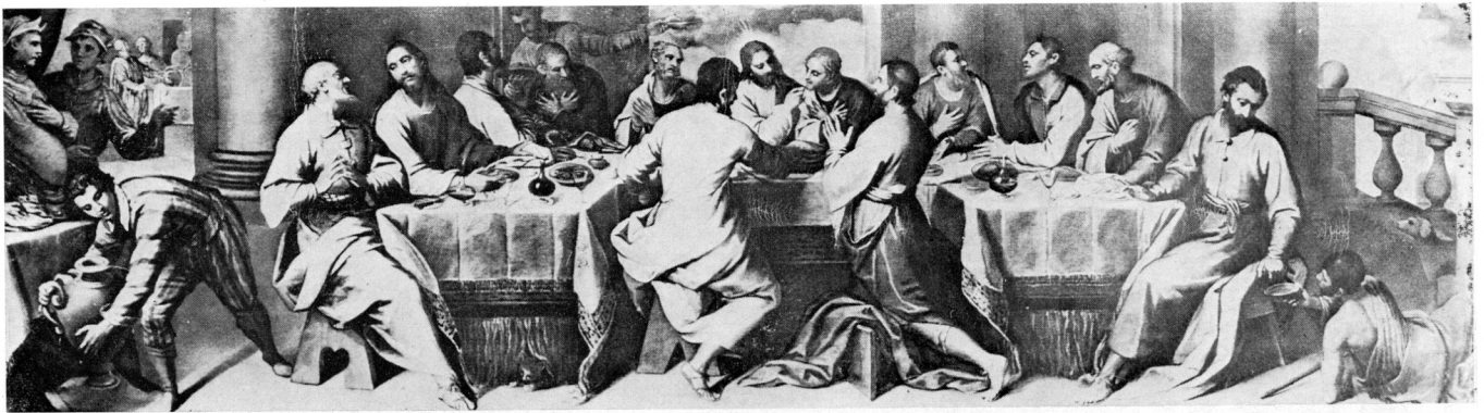
1 »Posljednja večera« u franjevačkom samostanu na Hvaru