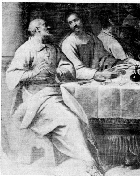
3—4 »Posljednja večera« u franjevačkom samostanu na Hvaru (detalji)

Ako uporedimo obje slike što se tiče kvaliteta, bez obzira što je ona u Portogruaru na vrlo visokom mjestu tj. na visini od oko 15 m iznad portala i velikog natpisa na unutrašnjem zidu pročelja crkve, a i prilično prljava, tako da ju je teško analizirati u pojedinostima, čini mi se, da je hvarska nešto kvalitetnija, što se može osjetiti u izrazitijim fizionomijama, većoj mekoći u