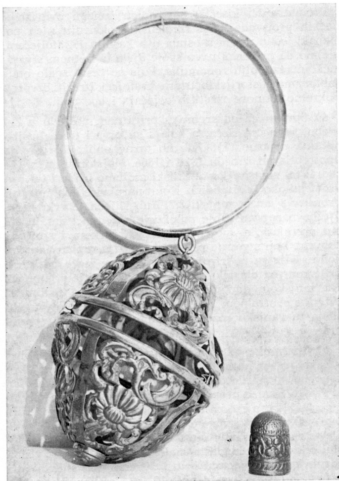
b) SPREMNICA OD SREBRA (Beč oko 1880.) — Zagreb, Muzej za umjetnost i obrt