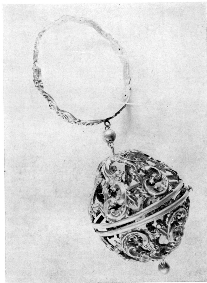
c) SPREMNICA OD SREBRA (oko 1850—1860.) — Zagreb, Muzej za umjetnost i obrt

kuglicom kao međučlanom spremnica povezana karičicama s obručom, koji se stavlja na ruku. Taj obruč je uzak, plošan i u svojoj donjoj polovici bez ukrasa, kako zbog toga što je taj dio manje vidljiv, a i zato da ta polovina, na kojoj visi spremnica, bude što čvršća. Vidljiv gornji dio obruča urešen je na proboj nizom povezanih kolutova, a u sredini tog niza smještena je štitolika pločica, na kojoj je ugravirano slovo A, valjda inicijali imena prvotne vlasnice. Promjer tog obruča iznosi 7,5 cm, a promjer kuglaste spremnice 8 cm. Čitav predmet visok je 22,5 centimetra.