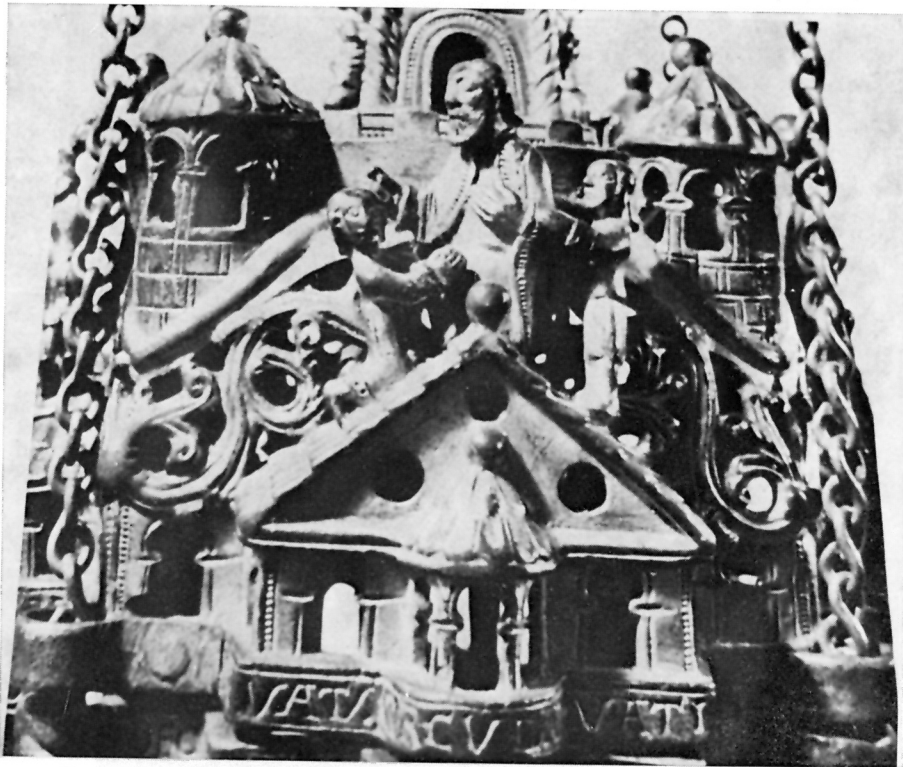
Grozbertusova kadionica iz riznice Trierske katedrale (oko 1100. g.)

oko 1100. gotovo identična s arhitekturom na rapskim pločicama: križna osnova s prizmatičnim krovom na križu, i s kupolama na visokim postoljima u uglovima između krakova križa.