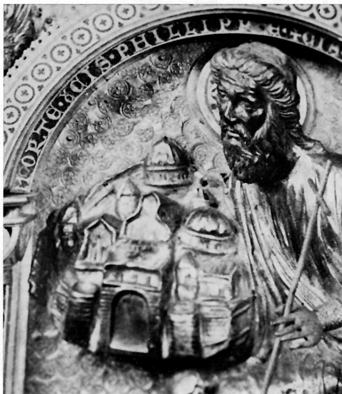
Relikvijar Triju kraljeva iz katedrale u Kölnu