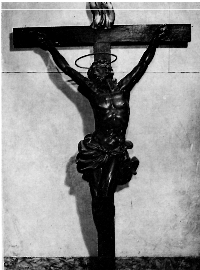
1 Giacomo Piazzetta, Raspelo — Stari Grad, Dominikanska crkva