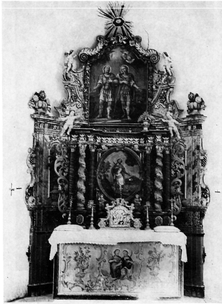
12 Oltar kapele sv. Ivana i Pavla, snimljen 1939. g. — Danas više ne postoji

ura sačuvana u Dijecezanskom muzeju u Zagrebu i ona svjedoči o kvaliteti cjeline. Umjesto božjeg oka nalazi se slab reljef sv. Trojstva. Isti umjetnici koji su postavili oltar izradili su oko 1745. i sačuvanu ropovjedaonicu s likovima Krista i četiri evanđelista.