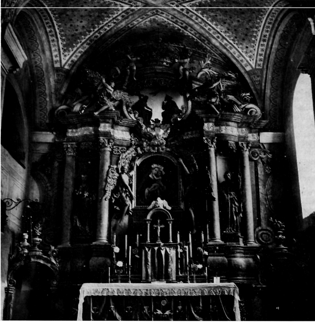
11 Gora, Crkva uzašašća Bl. Dj. Marije — Glavni oltar

iskoj crkvi međuprostor za bočne oltare. Svetište s glavnim oltarom zauzima samo jedan jaram koji se ritmički nastavlja na lađu, bez naglašene cezure, a od ađe je viši tek za dvije stube. Barokni konstruktivni elementi aplicirani su na gotičkoj osnovi. Bočna kapela obogaćuje tlocrt, ali ne utječe na uzdužni, osno usmjereni prostor. Za modernizaciju gotičke jezgre bitna arhitektonska komponenta naglašena je vertikalnim rastom stubova, zanemarivanjem završnog vijenca, isticanjem podjele prostora pomoću jakih jarmova i ritmiziranjem svoda koji raščlanjuju lukovi pojasnica (popruga) nad zidnim stubovima. Stubovi su raščlanjeni pilastrima i završeni oštro profiliranim vijencima (sl. 8). Prostorna dinamika postignuta je karakterističnim ritmom »slavoluka« (zidnim stubovima i naglašenim ukovima svodnih popruga) pa su četiri jarma crkve u jednakim razmakom u jednakom taktu zajedno s drugim jarmom, u kojem je do obnove 19. st. bilo zidano barokno pjevalište, sačinjavala jednu sažetu cjelinu određenu oltarnoj zoni, koja je u svojoj čitavoj dimenziji ispunjena monumentalnim glavnim oltarom.