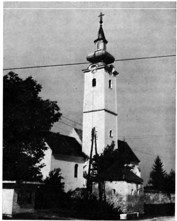
3 Gora, Crkva uzašašća Bl. Dj. Marije — Jugozapadna kula, dio cinkture i zvonik

nesen je novi inventar u crkvu i porušena je stara cinktura koja je zamijenjena potpuno novom od kamena koji je nanio narod. Cinktura je dovršena 7. listopada 1742, a gorski župnik Ivan Mravinec napravio je crkvenjakom Matijom Melnjakom obračun i nakon splate troškova za zidanje cinkture i ostalih radova učinjenih u posljednjih šest godina (popločivanje crkve pokrivanje kripte klesanom kamenom pločom) ostalo je »Rh. 208« gotovine. U protokolima kanonskih vizitacija opisana je ova zanimljiva i jedinstvena cinktura s četiri branič-kule na uglovima, koje su bile pokrovljene šindrom. Glavni ulaz cinkture smješten je pred pročeljem crkve, a sporedni južno, preko puta župnoj kuriji. Cinktura je građena kao utvrda predviđena za obranu i povlačenje naroda pred neprijateljem (sl. 3).