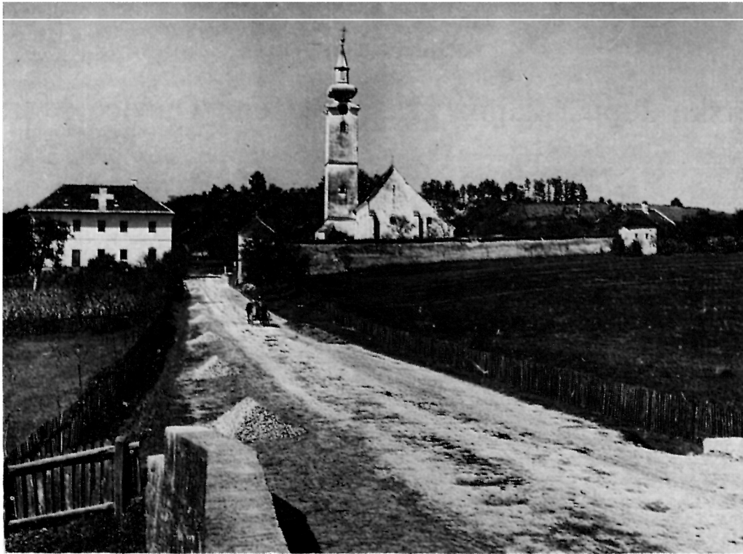
1 Gora, Crkva uzašašća Bl. Dj. Marije — Pogled na crkvu s istoka 1939. g., kad je i sjeveroistočna kula cinkture bila sačuvana. Na brdu iza crkve nazire se kapela sv. Ivana i Pavla.

Radikalna barokizacija crkve dovršena je 1736. Barokizaciju je poduzeo zagrebački prepošt Pavle Četković. Tada je pod svod stavljena lađa, probijeni su veliki barokni prozori, čitava crkva je popločena kameom, sazidano je pjevalište umjesto starijeg drvenog, a pokraj sakristije je uz lađu prizidana pravokutna svelena kapela bratovštine posvećena sv. Ani. Zatim je uz