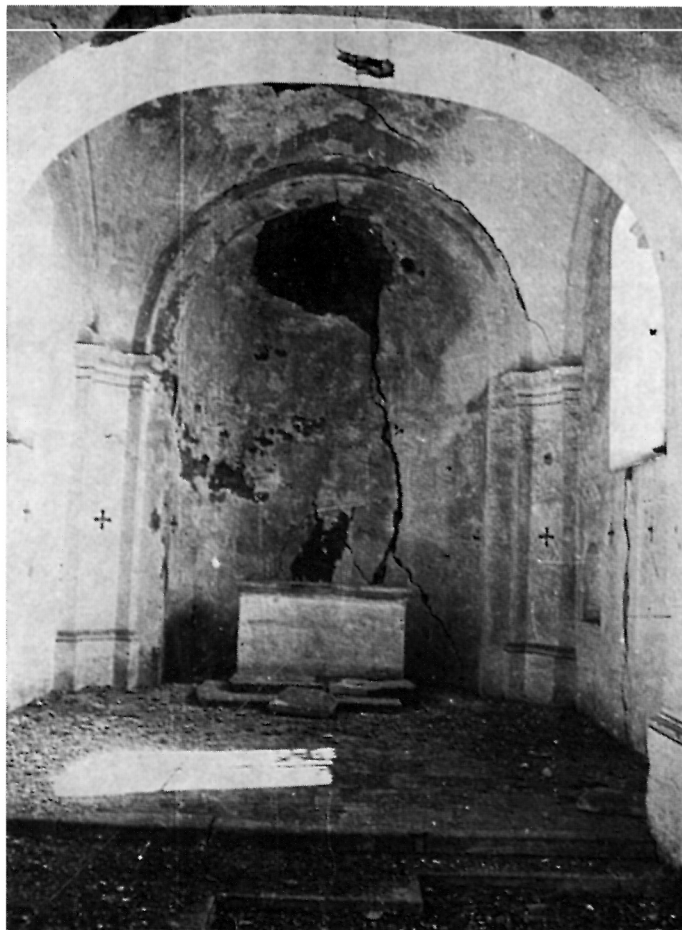
13 Unutrašnjost kapele sv. Ivana i Pavla u današnjem stanju