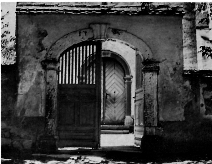
10 Gora, Crkva uzašašća Bl. Dj. Marije — Ulaz u cinkturu i glavni ulaz crkve

pošt Sigismund Sinersperg. Crkva u Gori je tipičan primjer kako je sačuvana stara srednjovjekovna jezgra ruševne građevine nakon turskih prepada (sl. 7). To je jedan od mnogih primjera kako se od starog objekta sačuvalo sve što je bilo moguće, kako se uklopio novi stil u staro tkivo i kako se modernizirala građevina. Razlog se te pojave ne može tumačiti štednjom i siromaštvom, jer patronatsko pravo velikih prepošta nad gorskom župom i darovnice pojedinaca pokazuju baš protivno. Pravi razlog je pijetet prema starini, ali ne u smislu današnjeg suvremenog čuvanja spomenika kulture, nego u religioznoj tradiciji i posebnom odnosu sredine prema proštenjarskim crkvama koje su u narodu uživale osobit ugled. Kaptol nije u tom slučaju ni smio prići radikalnoj restauraciji, jer se crkva osim darovnicama uzdržavala i dobrovoljnim priložima župljana. Zbog toga su, da bi se mogle provesti ideje tridentinskog koncila i u vezi s umjetničkim oblikovanjem crkve, osnivane bratovštine. U Gori je osnovana brojčano jaka bratovština pod zaštitom sv. Ane, pa su u barokizaciji građevine neposredno sudjelovali i članovi bratovštine dograđivši uz crkvu kapelu sv. Ane.