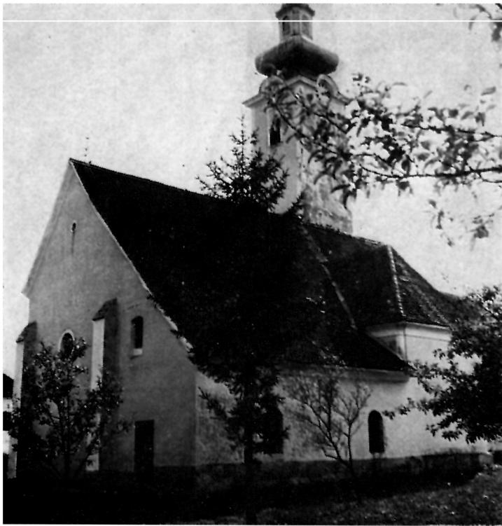
1 Gora, Crkva uzašašća Bl. Dj. Marije — Pogled sa sjeveroistočne strane na kapelu sv. Ane, sakristiju i zvonik