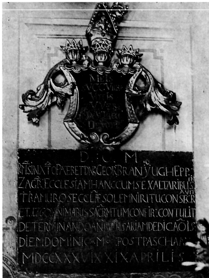
4 Posvetna ploča u svetištu crkve snimljena 1939. g. Grb biskupa I. Branjuga danas više ne postoji

Od inventara su nakon barokizacije u crkvi zadržana dva stara oltara, sv. Jurja i sv. Ivana, koje je 1717. dao izraditi Sigismund Sinersperg, a ostali su oltari novi. Tako je prilikom posvete crkve 1736, od biskupa Jurja Branjuga, crkva imala šest oltara. 13