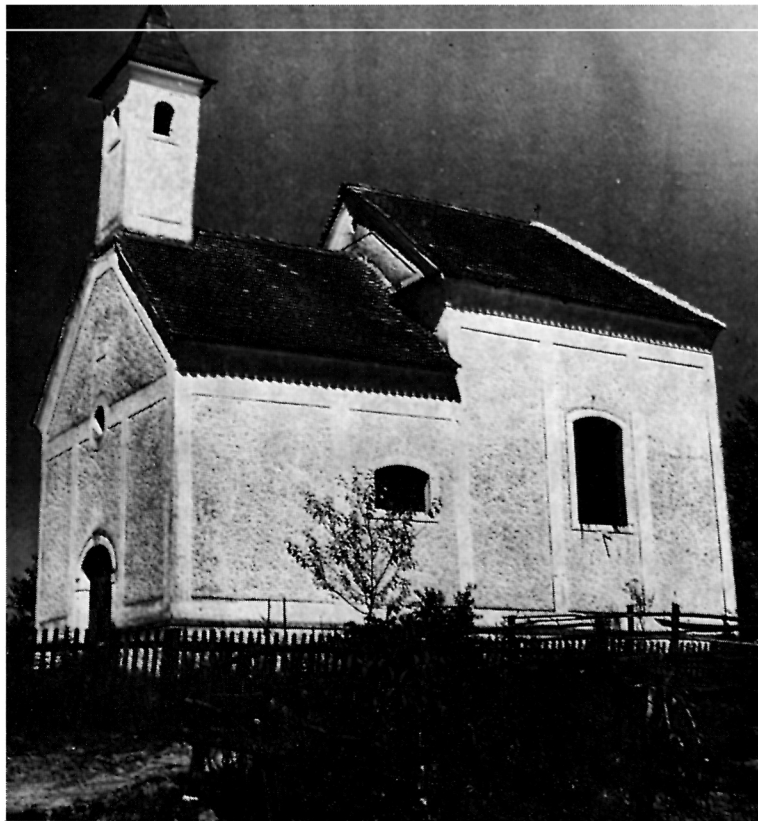
5 Kapela sv. Ivana i Pavla slikana 1939. g. Danas u kritičnom stanju

osnovao također Sigismund Sinespergh za mise »Fl. 400«. Iz to je osnovao i jednu zakladu u korist crkve svotom od 1400 forinti. Prepošt čazmanski Stjepan Doičić također je osnovao zakladu od »Fl. 500«. Župnik I. Mravinec, vicearcidakon gorski, osnovao je zakladu od Fl. 500«. Sve su se darovnice čuvale u zagrebačkom kapitolu, osim darovnice I. Mravinca posuđene knezu Ćarlu Auerspergu, zbog koje je izbio spor i parničenje. Patronatsko pravo su u čitavom tom razdoblju držali