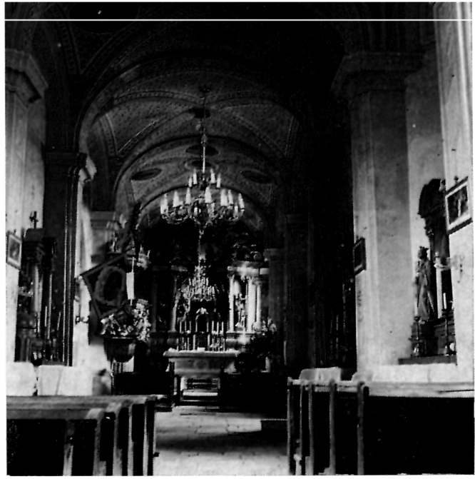
8 Gora, Crkva uzašašća Bl. Dj. Marije — Pogled prema svetištu

- 1855—1860. crkva je popravljena novcem iz Beča. Učinjeno je najnužnije, pokriven je krov crijepom, obijeljeni su zidovi. Oltar i. Ane unesen je novi (L. M. str. 327).