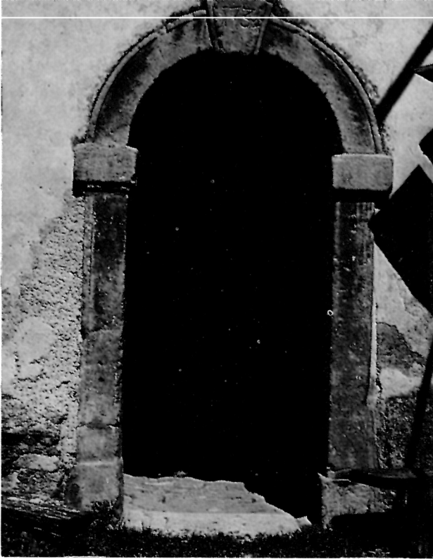
9 Gora, crkva uzašašća Bl. Dj. Marije — Vrata zvonika iz 1734. g.