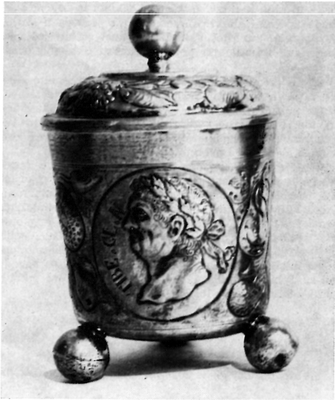
4 Cilindrična čaša s glavama rimskih imperatora, vjerojatno rad augsburškog majstora Balthasara v. Salisa (1675—1694) — Zagreb, privatna zbirka

zanim dekorativnim vrpcama. Ispupčeni su reljefni dijelovi ornamentacije pozlačeni, a podloga je srebrna.