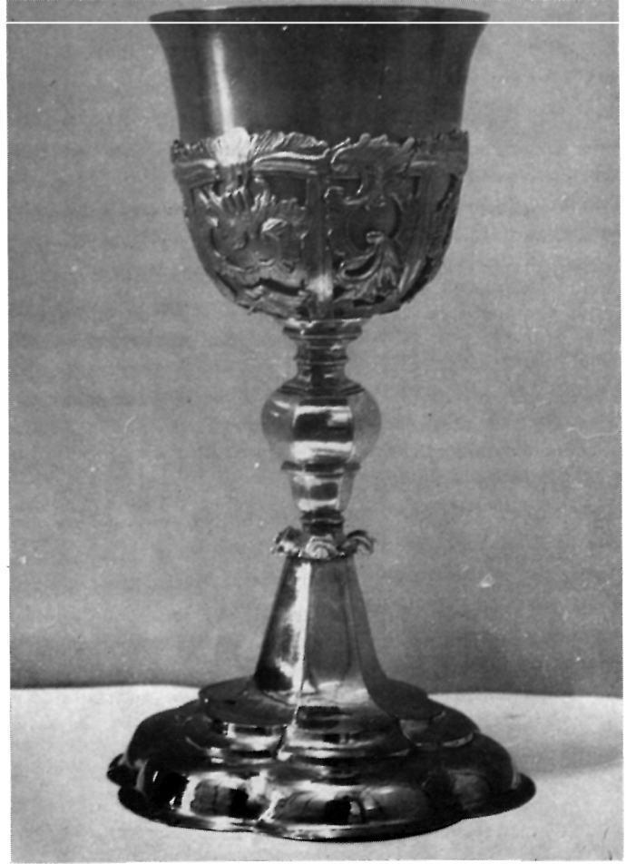
7 Pozlaćeni kalež, vjerojatno rad augsburškog zlatara Eliasa Buscha (1704—1759) — Zagreb, privatna zbirka

Ova malena skupina profanog srebra iz najznačajnijih centara njemačke zlatarske umjetnosti iz razdoblja aroka, tj. iz Augsburga i Nürnberga, sakupljena i sačuvana u jednoj privatnoj zbirci u Zagrebu, predstavlja,