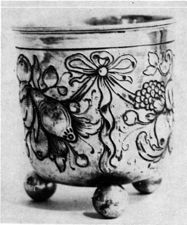
3 Cilindrična čaša s voćnom ornamentacijom, vjerojatno rad augsburškog majstora »MB« iz sredine 17. st. — Zagreb, privatna zbirka

najstori u Nürnbergu i specifičan tip pokala u obliku cvijeta kandilke sa ili bez poklopca.