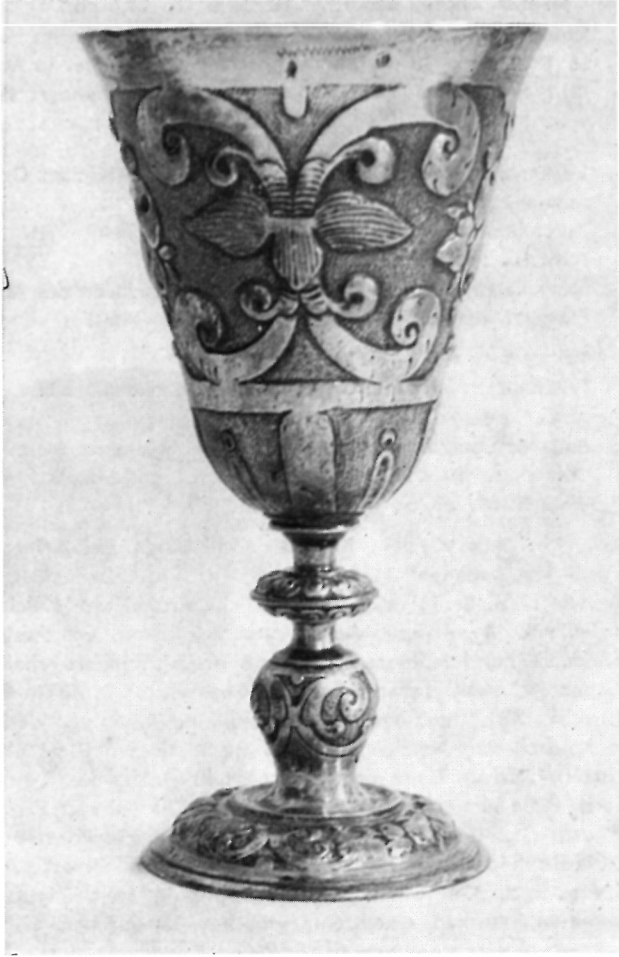
6 Srebreni pokal, vjerojatno rad augsburškog zlatara Tobiasa Brauna (prije 1620—1635) — Zagreb, privatna zbirka