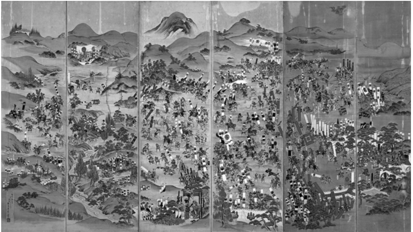
Prikaz Bitke kod Sekigahare 1600. godine