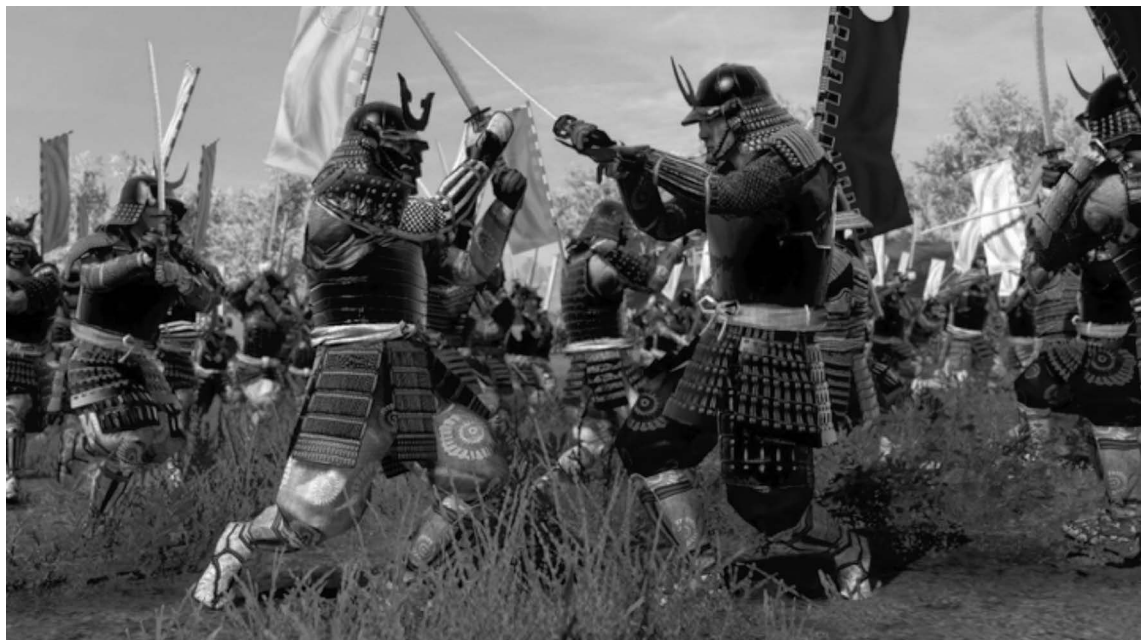
Prikaz borbe dva samuraja

Samuraji su se koristili raznim oružjima te su usavršavali svoju tehniku sa svakim pojedinim oružjem do savršenstva, a za svako oružje razvili su posebnu vještinu i filozofiju koju su njegovali. Najpoznatije oružje samuraja je katana 5 , koje bilo najčešće oružje među samurajima. Isto tako koristili su se i kopljima yari 6 i naginata 7 . Od dalekometnog oružja služili su se i lukom yumi . 8 Tijekom sredine 16. stoljeća Portugalci donose europske puške-arkebuze, a Japanci su ih zvali tanegashima 9 . Samuraji su ih nevoljko koristili jer su to oružje smatrali nečasnim, ali zato su puške koristili obični vojnici koji se