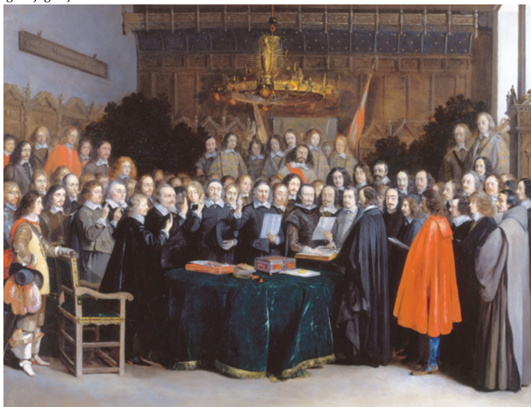
Ratifikacija Westfalskog sporazuma

Na vjerskom je području sporazum donio priznanje kalvinističke vjeroispovjedi u Carstvu uz katoličku i luteransku. Na snazi je ostalo vjersko pravilo cuius regio, eius religio , ali je sporazumom dozvoljeno onima koji ne prihvaćaju službenu religiju svoje države da se odsele. Kao normativni datum za vjersku kartu Carstva obilježen je 1. siječanj 1624. te je zabranjeno plemstvu 23 da nameće religiju podanicima.