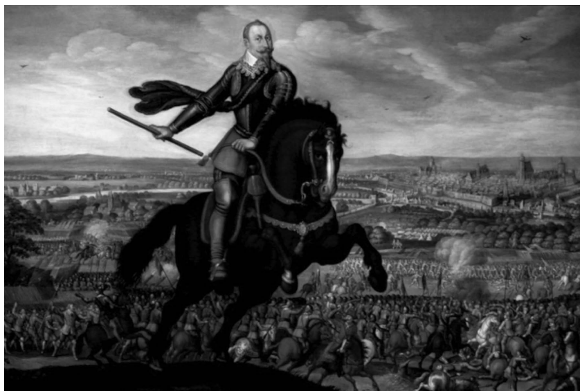
Gustav II. Adolf kod Breitenfelda

na švedsku stranu, a slijede ga Hessen-Kassel i Saska, dok je to nešto ranije učinio i Brandenburg. Takva se koalicija u rujnu 1631. sukobljava s carskom vojskom kod Breitenfelda 17 i odnosi pobjedu te Gustav napreduje na jugozapad osvajajući Erfurt, Würzburg, Frankfurt, Mainz i većinu Donje Falačke do kraja godine, dok Tilly teško ranjen, bježi u Frankoniju. Uz to, dio njegovih trupa osvaja i Češku. Iz Falačke Gustav kreće prema Bavarskoj i kod gradića Rain na rijeci Lech (travanj 1632.) ostvaruje značajnu taktičku pobjedu nad carskom vojskom prelazeći rijeku i otvarajući put prema Austriji smrtno ranjavajući Tillyja. (Cooper, 2008: 327) (Wilson, 2009: 500) U teškoj situaciji i nedostatku vrhovnog zapovjednika, car ponovno postavlja Wallensteina koji temeljito reformira vojsku početkom sljedeće godine. U svibnju Gustav upada u Bavarsku i ulazi u München, a potom u Nürnberg, gdje ga opkoljavaju Wallenstein i Maksimilijan prethodno vrativši Češku pod svoju kontrolu. Kako je njihova taktika bila izgladnjavanje, Johann Georg od Saske pokušava smanjiti pritisak na Nürnberg napadajući Šlesku, ali i sam biva napadnut kod Steinaua na Odri (kolovoz) od španjolskih pojačanja pristiglih iz Češke, koje teškom mukom uspijeva odbiti. Španjolski poraz primorava Wallensteina da oslabi svoju vojsku slanjem postrojbi u Šlesku što iskorištava Gustav u neuspješnom napadu kod dvorca Alte Veste (rujan) te kod Lützena (studenj), gdje unatoč neodlučnom ishodu, i sam pogiba. (Wilson, 2009: 492-511)