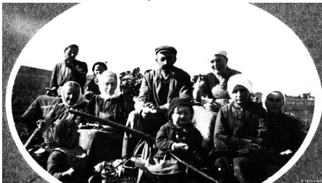
Folksdojčeri - protjerivani iz rodnoga kraja

u ostalim dijelovima Europe radi kasnije usporedbe sa situacijom u FNRJ. O situaciji u Sovjetskom savezu neće biti govora jer je ondje odnos prema „domaćim“ Folksdojčerima bio mnogo rigorozniji nego u ostalim dijelovima Europe. Što se tiče stanja u već spomenutim državama, prvo bih htio spomenuti sudbinu Folksdojčera u Poljskoj. Na prostoru današnje Poljske sredinom 1945. godine živjelo je oko 4, 5 milijuna Folksdojčera. U to se vrijeme nova vlast već ustalila i počela provoditi dogovorenu politiku preseljenja. Do 1950. godine preseljeno je oko 3, 15 milijuna „domaćih“ Nijemaca. Tijekom preseljenja smješteni su u mnogobrojne logore te je pod utjecajem raznih bolesti, hladnoće, pothranjenosti, ali i pojedinačne osvete umrlo između 20 000 i 60 000 Folksdojčera (Sienkiewicz, Hryciuk, 2008: 187; Spieler, 1989: 40). Veliki je raspon o broju umrlih posljedica trenutačnog neslaganja mnogobrojnih povjesničara koji su istraživali problem. Za područje Čehoslovačke situacija je relativno jasnija u literaturi. Svi se slažu da je gotovo čitavo njemačko stanovništvo iseljeno. To u brojkama znači oko 2, 5 milijuna ljudi, s tim da je tijekom preseljenja i u logorima umrlo između 15 000 i 30 000 ljudi (Haar, 2007: 17).