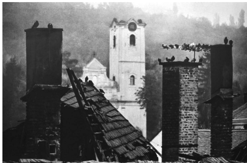
Spaljena rimokatolička crkva; Pakrac, jesen – zima 1991.

prostor postao premalen za silne zarobljenike, odlučilo se logor premjestiti u Bučje. Tamo su zarobljenici bili raspoređeni u zgradi šumarije (u kojoj je bilo sjedište tzv. milicije), zgradi osnovne škole te u zgradi veterinarske stanice. Zatvorenici su trpjeli izživljavanje psihičke i fizičke prirode. Premlaćivanja su bila svakodnevna, lomilo im se prste, rezalo dijelove tijela, tjeralo da stoje na hladnoći gotovo goli te su tjerani na težak fizički rad. Također su dobivali samo dva obroka dnevno i to uglavnom ono što je ostalo čuvarima. Nužda je bila vršena uglavnom u jednu posudu koja se nalazila u sobi u kojoj su obitavali zarobljenici. Razni veterinarski preparati ubrizgavani su im u tijelo od čega su mnogi preminuli. Broj osoba koje su prošle kroz ovaj logor nepoznat je, no pretpostavlja se da je u njemu bilo tristotinjak logoraša. Logor je bio u funkciji od 19. kolovoza do 13. prosinca 1991., kada su preostali zarobljenici prevezeni u logor u Staroj Gradiški.