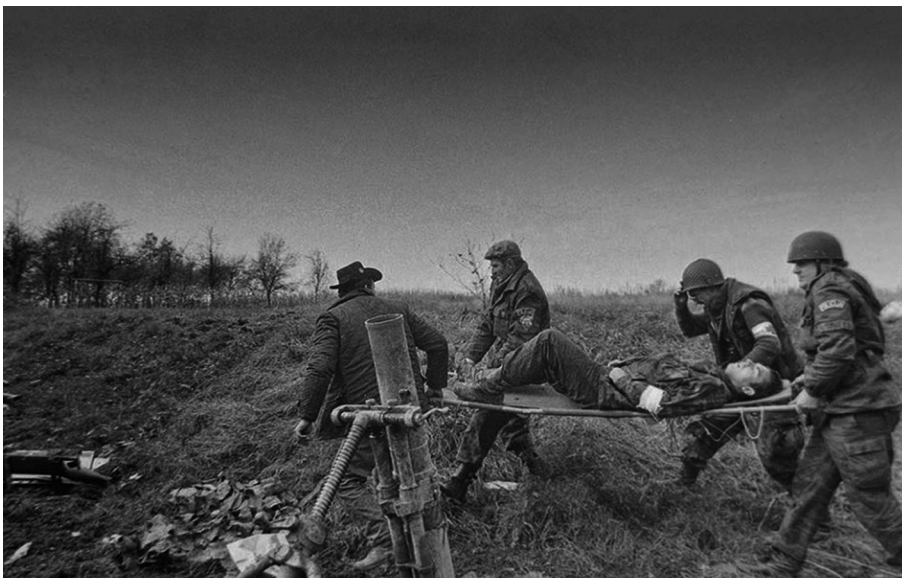
Spašavanje ranjenika; Prekopakra, studeni 1991.