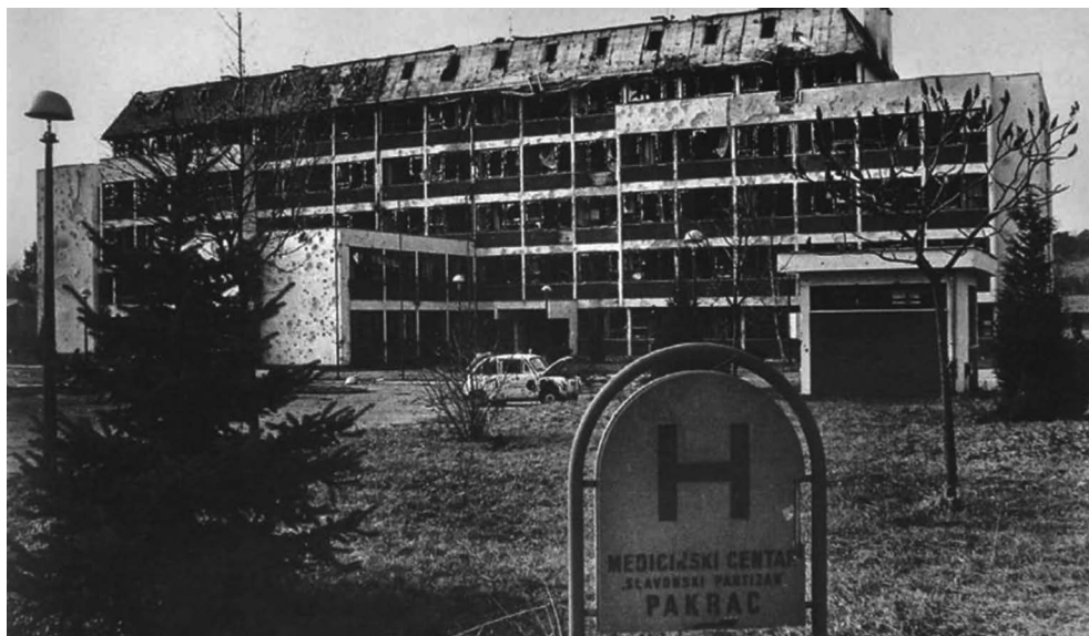
Uništena bolnica; Pakrac, jesen – zima 1991.

artiljerijom, uključujući i protuzrakoplovne strojnice unatoč jasno istaknutom znaku Crvenog križa. Dana 24. rujna 1991. banjalučki V. korpus JNA dolazi na pakračko područje te time počinje pravi pakao za bolnicu, ali i cijeli Pakrac. U bolnici i psihijatriji zajedno tada je bilo 338 bolesnika, a već sljedećeg dana bolesnici iz novog odjela evakuirani su u Kutinu. U bolnici tada ostaje oko 260 psihijatrijskih bolesnika i pripadajuće medicinsko osoblje. Dana 26. rujna konvoj Međunarodnog Crvenog križa, koji je pokušao evakuirati bolesnike, zaustavljen je od strane pobunjenih Srba i JNA u selu Dobrovac zapadno od Lipika (Ćurak, 2008: 121, 122).