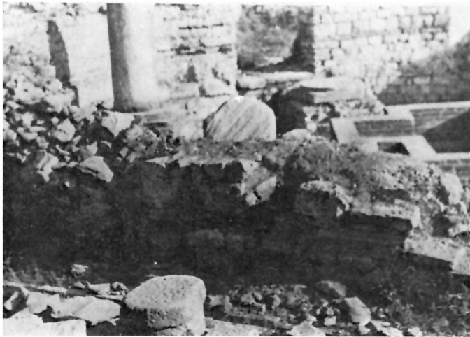
6 Krstionica prije početka konzervatorskih radova