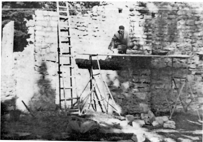
2 MANASTIRINE, radovi na obnovi lezena na južnom zidu bazilike

Kompleks na Manastirinama , koji se sastoji od poganskog i starokršćanskog groblja, dvanaest većih memorija, trobrodne bazilike s nartekсом i tiješka za vino, nalazi se udaljen od okoli stotinu i pedeset metara sjeverno od tzv. Porta Suburbia III u sjevernim gradskim bedemima.