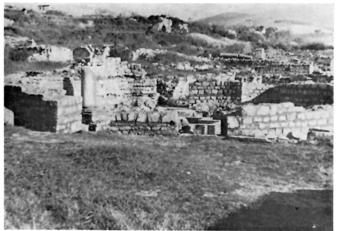
7 Krstionica nakon završetka konzervatorskih radova