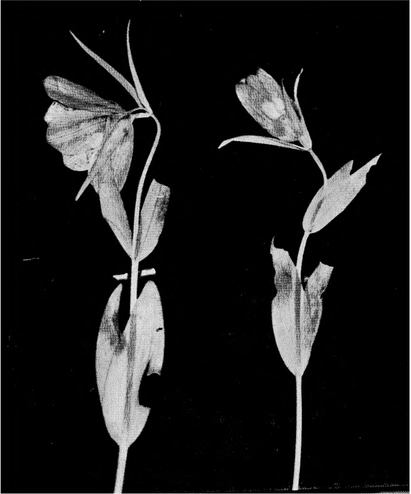
Sl. 2. (Abb. 2) — Fritillaria ionica var. ochridana