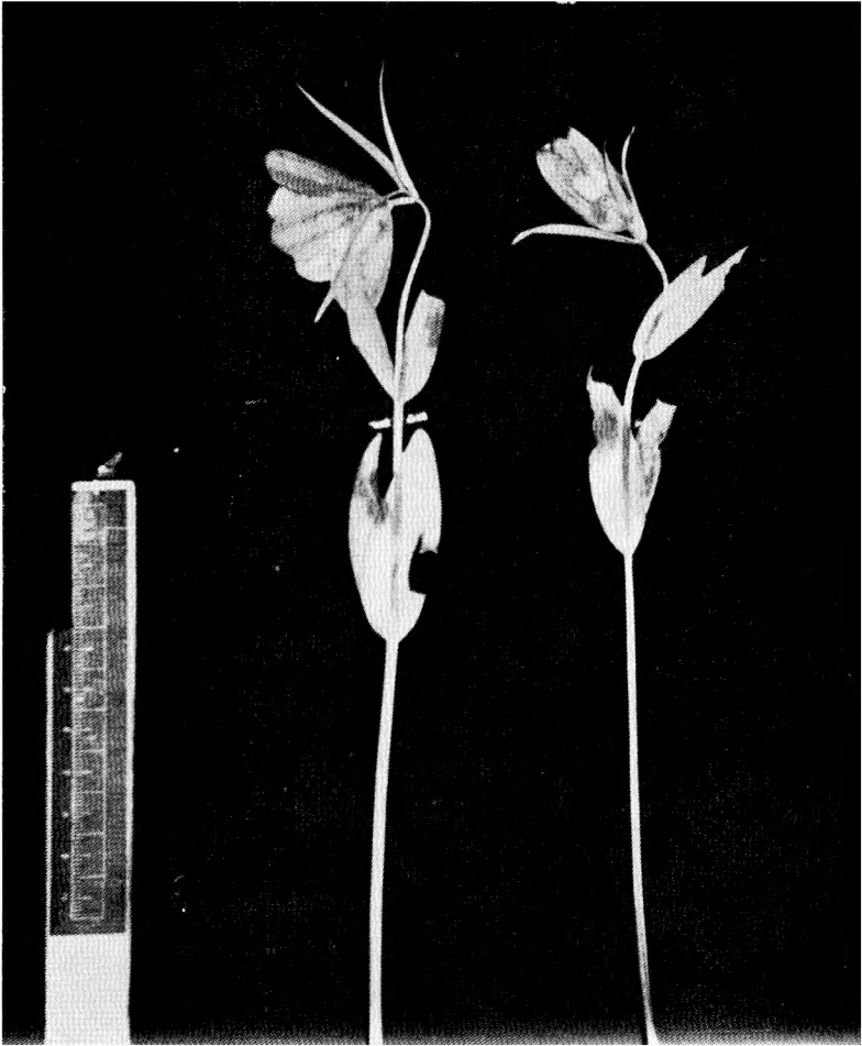
Sl. 3. (Abb. 3) — Fritillaria ionica var. ochridana