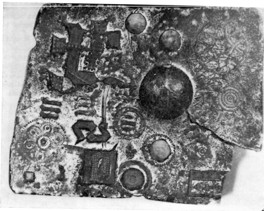
2 Našice, zlatarski kalup, druga strana

kružnice, a drugi četiri. U desnom gornjem uglu vidimo još jedan kružni motiv s promjerom od 2,7 cm. On ima više elemenata. U sredini je malo točkasto udubljenje. Oko njega smješteno je u pravilnom poretku još dvanaest udubljenja, šest na udaljenosti od 1 cm i šest na udaljenosti od 0,7 cm. Ako bismo ih spojili, dobili bismo dva šesterokuta. Pored udubljenja motiv sadržava i niz dvostrukih kružnih lukova. Lukovi su paralelni, isprepleteni i raspoređeni po određenom redu. Na jednoj strani lukove čine urezi.