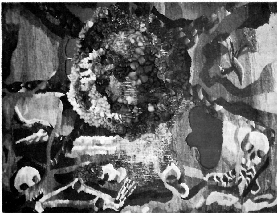
3 Мира Спировска, «Илинденска епопеја», таписерија (волна и памук, 152 × 194 цм, 1971. — детаљ)

дува апстрактни геометризирани мотиви. Ваквата постапка му овозможува интервенции и во текот на самото креирање, лишено овој пат од строгите шеми, скици и картони, неопходни при изведувањето на класичната таписерија.