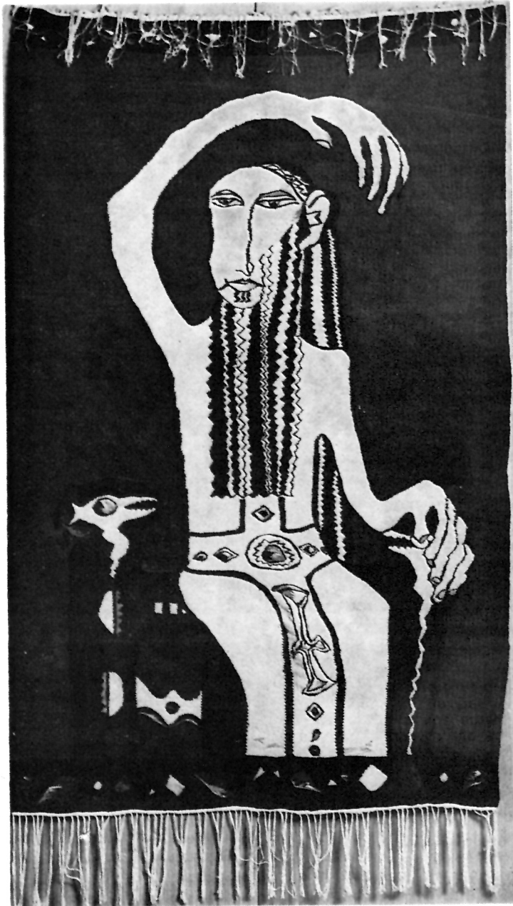
1 Димче Коцо, Средновековен достоинственик, таписерија (памук и волна, 164 × 100 цм, 1970/71.)

на одредени ликовни решенија. Грубата селска волна употребена при ткаењето придонесува за рустичноста на фактурата, а вешто применетата стилизација на формите го нагласува ритмот во композицијата.