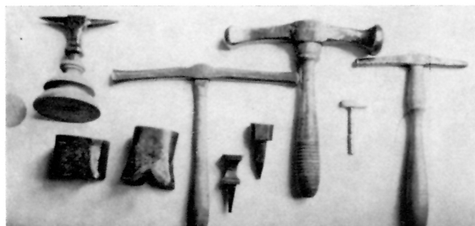
2 ZLATARIJA MARINOVIC, Čekići i nakovnji — Muzej Korčule