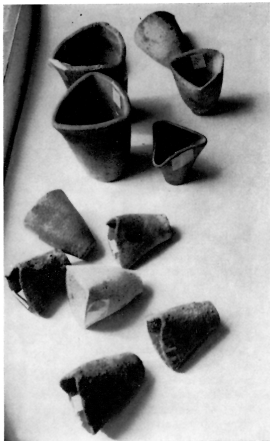
4 ZLATARIJA MARINOVIC, Glinene posude za topljenje zlata — Muzej Korčule