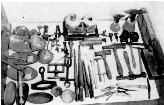
1 ZLATARIJA MARINOVIC, Razni zlatarski alat — Muzej Korčule