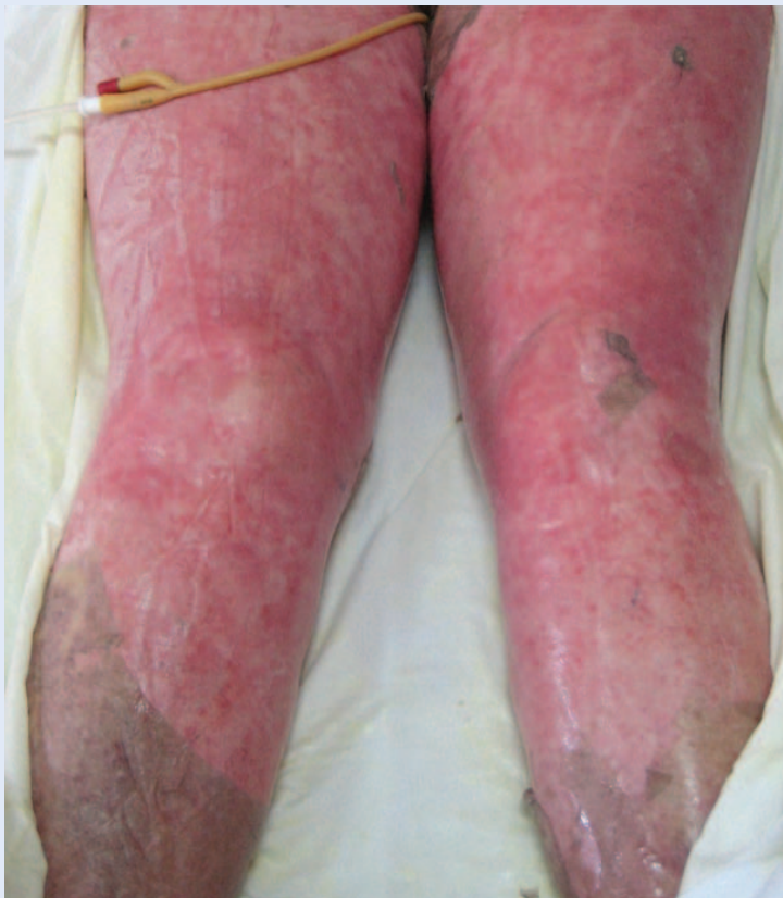
Slika 4. TEN: potpuno ogoljenje dermisa na velikoj površini kože

pacijenta. Određuje se kao i u slučaju opekline, pri čemu se u izračun ubraja samo nekrotična koža koja je već odljuštena (bule, erozije) i koža koja se može odljuštiti (Nikolsky-pozitivna područja), dok se Nikolsky-negativna eritematozna područja isključuju 3,4 . Prema površini zahvaćene kože pacijent se klasificira pod dijagnozu SJS-a (< 10 %), TEN-a (> 30 %) ili preklapanja SJS-a i TEN-a (10-30 %) 1,2 . Često se pripadnost određenoj skupini ne može sa sigurnošću odrediti odmah po nastupu bolesti pa se, ovisno o kliničkom tijeku, dijagnoza može i promijeniti tijekom prvih nekoliko dana. U svrhu procjene rizika i prognoze akut-