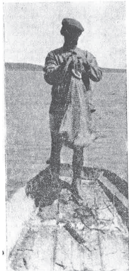
Pokusni ribolovi sačmaricom na Ribnjačarstvu Grudnjak daju vrlo dobre izgledе za bogat ribolov

Osijek u studenu. — Znajući da nema ribe ako joj se ne posveti dovoljna pažnja, ribari Ribarske zadruge u Petrijevcima energično su pristupili mnogim mjerama za što uspješniji ribolov u jesenskoj sezoni.