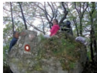
Na vrhu Kamenih svati

Kad smo vidjeli srnu ili zeca to je bilo veliko veselje.