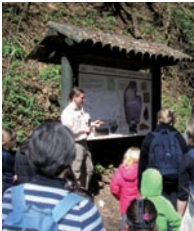
Na ulazu u špilju Veternicu