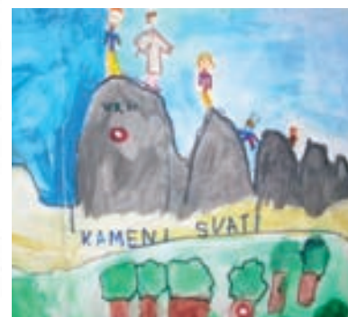
Kameni svati, tempera

S obzirom na reakcije djece i pohvale roditelja, može se zaključiti da je projekt omogućio djeci i roditeljima da kvalitetno provedu svoje slobodno vrijeme i potaknuo ih da tako poboljšaju kvalitetu života obitelji, a u nekim segmentima i svoje odnose prema prirodnom okruženju i ljudima oko sebe. Odgajateljima je donio osobno zadovoljstvo samim izletima i njihovom refleksijom na kvalitetu programa, te novo pozitivno iskustvo u građenju partnerstva i prijateljstva s roditeljima.