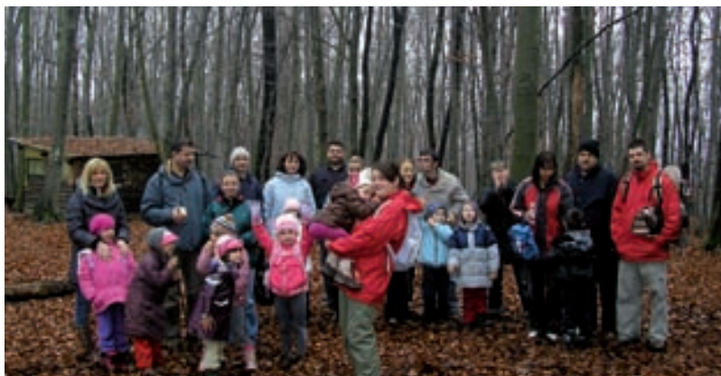
U šumi Januševac

Uočava se tendencija obitelji da slobodno vrijeme uglavnom provode sjedeći pred ekranima i kupujući u trgovačkim centrima. Ovakav stil života negativno se odražava na cijelu obitelj pa tako i na dijete. Pomanjkanje kretanja, osim što negativno utječe na zdravlje svih članova obitelji, lišava dijete učenja kroz neposredno iskustvo u kontaktu s prirodnim okruženjem. Kretanje, osobito u prirodi, svojevrsan je ventil za psihičku napetost kao posljedicu suvremenog načina života.