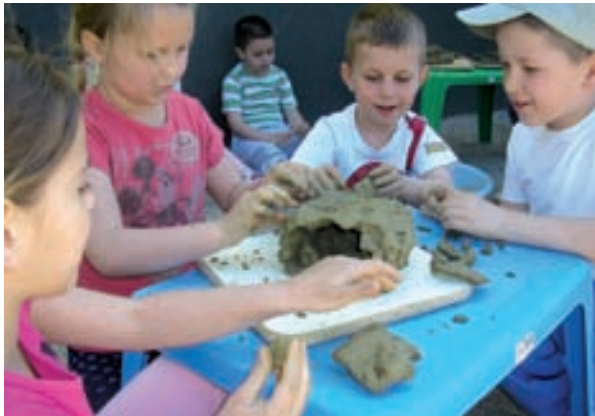
Doživljaj posjeta špilji Veternica