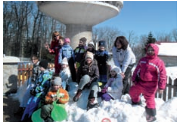
TV toranj na Sljemenu