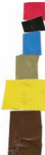
TV toranj, kolaž i maketa