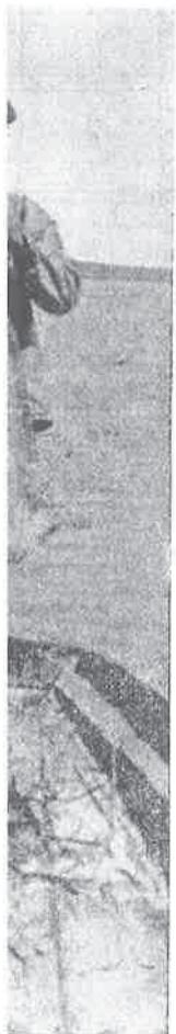
naricom na k daju vrlo at ribolov t. Plevnik

Osijek u studenu. — Zapaženo je u posljednje vrijeme, da se ribarske zadruge ne pridržavaju izdatih propisa u pogledu težine ribe koju love, već izlovljavaju pojedine revire do kraja. Takav je slučaj bio i tu skoro s Ribarskom zadrugom Erdut, koja nekoć nije imala prijave u tom pogledu. Ribari ove zadruge predali su poduzeću »Šaran« preko 250 kg ribe kečage, crvenperke, bočorike i deverike u ne većoj težini od 2 do 4 deke. To je upravo zločinački postupak, jer se zna da bi u idućoj godini ta riba najmanje deset puta bila teža. Za prehranu naroda bio bi to velik dobitak. Međutim ribari u Erdutu nisu mislili na općenarodnu imovinu i štetnost ovakova svog rada, već su u