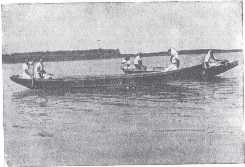
Hranidba ribe na Ribnjačarstvu Grudnjak