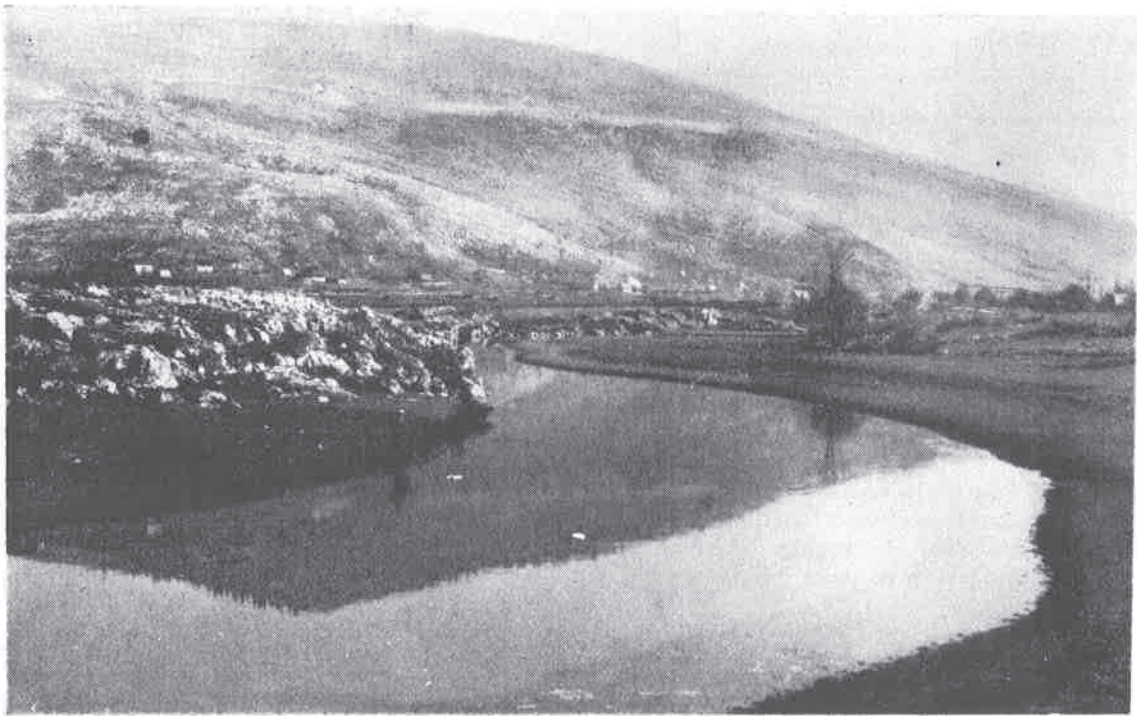
Rijeka Gacka nedaleko izvora

Gacka je rijeka ponornica. Ona izvire u krajnjem južnom dijelu Gacke doline, na podnožju brda Vjenac. Protječe Gackim poljem i cijepa se na tri kraka: jedan, lijevi, ponire u donjem Švic-kom jezeru, drugi kod Kopolja, a treći u Gušić polju.