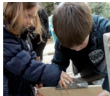
Djeca su imala priliku iskušati se u obradi drva i korištenju stolarskog alata

Ovakvo sadržajno bogatstvo željeli smo prezentirati, prvenstveno roditeljima bez čije podrške i sudjelovanja mnogo toga ne bismo ostvarili. Od Općine smo na korištenje dobili prostor galerije Laurus. Postavili smo izložbu na temu 'Moj Lovran' koja je sadržavala pojedinačne i grupne radove djece, zajedničke radove djece i roditelja, te fotodokumentaciju događanja. Program otvorenja izložbe bio je vrlo bogat. S nekoliko prigodnih točaka nastupila su djeca, a zatim su roditelji prikazali lutkarsku predstavu koju su pripremili za djecu. Za zabavni dio programa bila je zadužena najpoznatija lokalna grupa čiji je član i jedan naš nono. Realizirali smo postavljene ciljeve cjelogodišnjeg projekta. Ponosni smo na postignute rezultate, na sve ono što su djeca doživjela, na svu suradnju i podršku koja nam je pružena. Upravo tom suradnjom smo