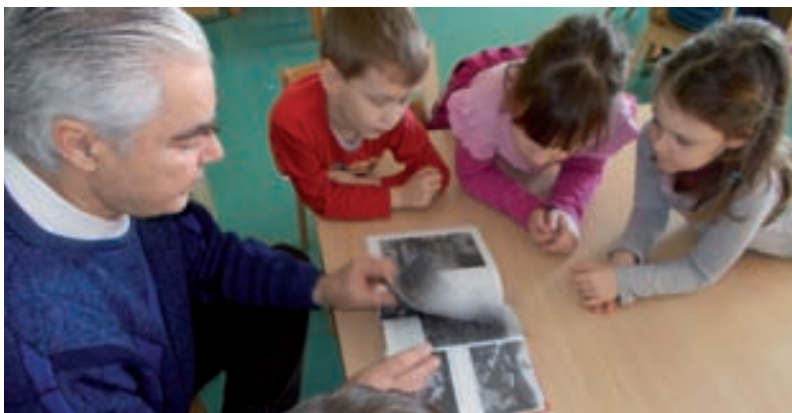
Njegovanje interesa za prirodni okoliš, za život i rad ljudi te za običaje kraja

Jedan naš nono, koji je nekada bio kuhar, uz stare fotografije i izvornu glazbu govorio nam je kako se nekad živjelo, što se jelo, što se u vrtu uzgajalo,