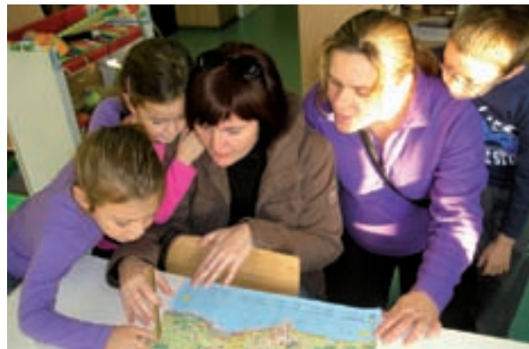
Prepoznavanje poznatih mjesta na karti