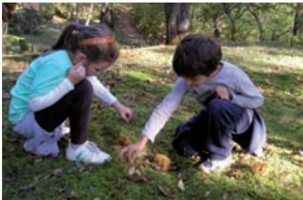
Posjet šumi maruna na obroncima Učke