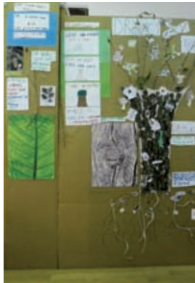
Proučavali smo biljke, drveće, bilježili svoja znanja i zapažanja

Treba nam još jedno stablo, da naše nije samo.