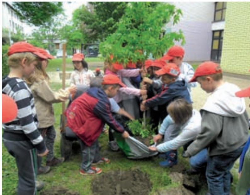
Sadnja stabla u našem dvorištu

S radom na projektu započeli smo stvaranjem poticajne prostorno-materijalne sredine u našoj sobi dnevnog boravka i na hodniku. U suradnji s roditeljima obogatili smo centar početnog čitanja i pisanja. Prikupili smo pisane materijale (časopise, slikovne materijale, enciklopedije prirode, druge educa-