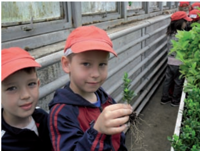
Posjet Šumskom vrtu i arboretumu

tivne časopise) koje smo svakodnevno proučavali, listali, čitali i razgovarali o vrstama drveća, šumama, stanovnicima šuma, rastu drveća i sl. Izradili smo različite slagalice, memory , slovarice, brojevne slike i sl., tako da su djeca bavili se temom usvajala i predvještine čitanja i pisanja. Pritom su svakodnevno imala priliku bilježiti svoja zapažanja. Formirali smo centar istraživanja prirode u koji smo smjestili prirodne materijale (kora drveća, grane, lišće, obluci, obrađeno i neobrađeno drvo, presjeci debla s vidljivim godovima). Djeca su svakodnevno proučavala koru stabala, tvrdoću drveta, boju drveća u jesen, a u likovnom centru različitim tehnikama bilježila su svoja zapažanja. Od prirodnih materijala izradili smo interaktivni plakat kojeg su djeca kontinuirano nadopunjavala novim sadržajima. Odvajali smo i prikupljali stari papir kojeg smo zajedno s djecom reciklirali. Od recikliranog papira djeca su izrađivala pozivnice, čestitke i stvarala nove slike. U hodniku smo formirali eko-centar. Posijali smo i posadili različite biljke. Djeca su svakodnevno brinula o biljkama te pratila rast i bilježila promjene. Svakodnevno smo dolazili do novih zaključaka o životu drveća, a svoja zapažanja djeca