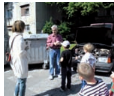
Djeca u akciji – dijeljenje letka stanovnicima Folke