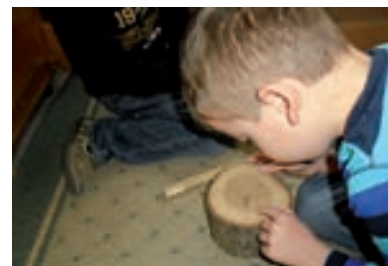
Proučavanje drveta, kore i plodova