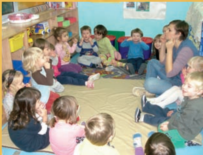
Ritual jutarnjeg kruga

U našu je odgojnu skupinu, od mlađe jasličke skupine, uključeno dijete s višestrukim poteškoćama. Zbog visoko utjecajnih teškoća komunikacije praćenih velikim teškoćama senzorne integracije, proces organiziranja podrške uključenosti i razvojnom procesu dje-