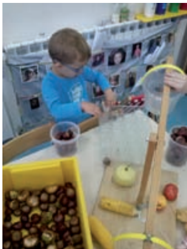
Aktivnosti istraživanja, manipuliranja materijalima i aktivnog učenja