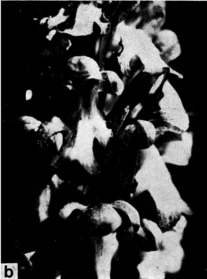
Sl. 1 b — Fig. 1 b