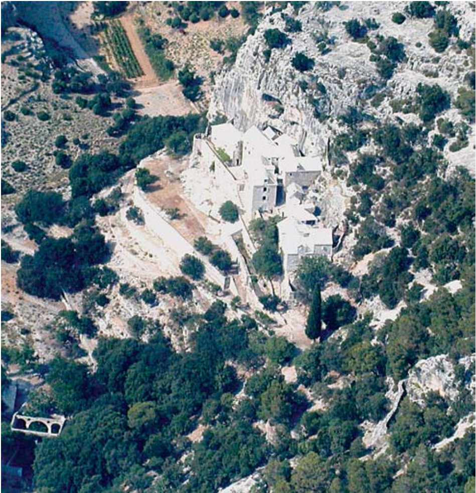
Pustinja Blaca, zračni snimak