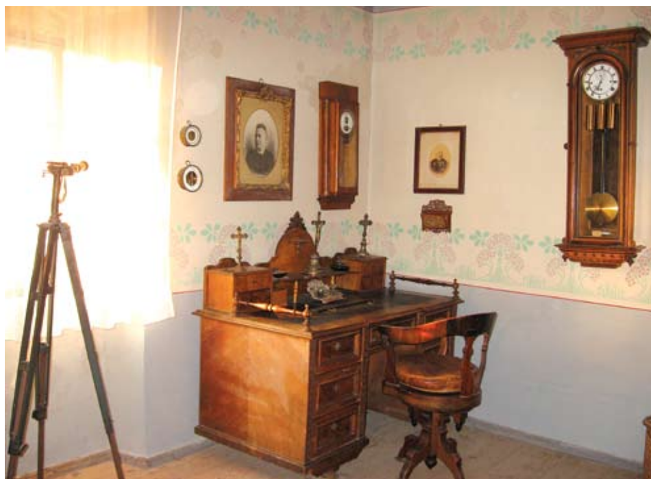
Soba upravitelja Pustinje