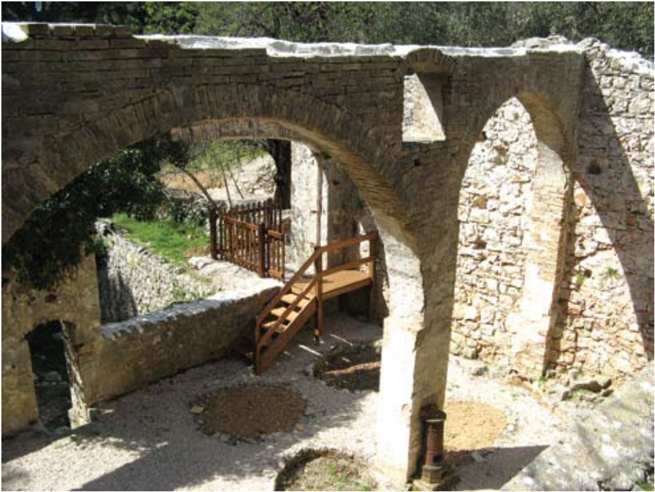
Unutrašnjost "limunare" ispod Pustinje