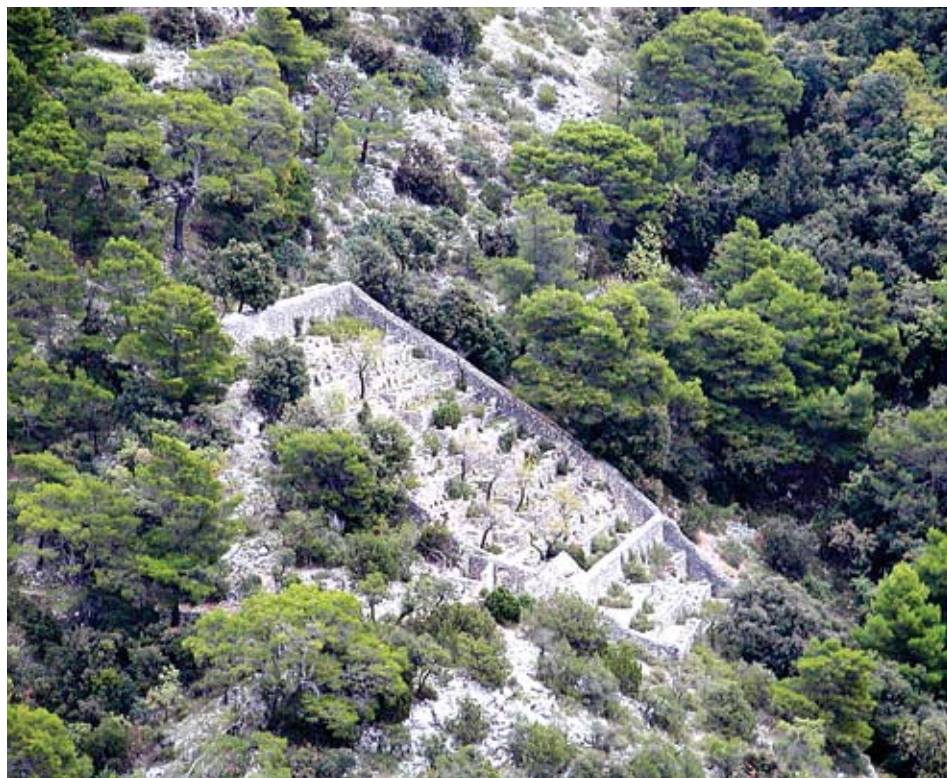
Pčelinjak južno od Pustinja