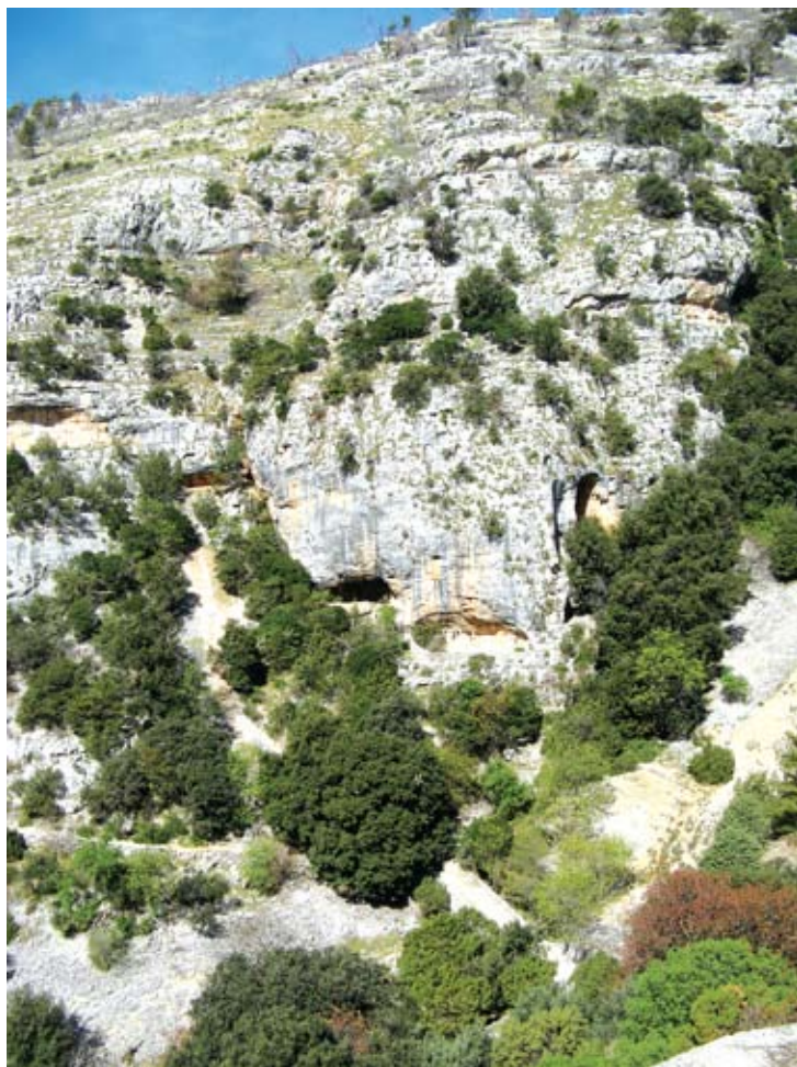
Špilje na Veloj strani

kulture, prisutan još od Dioklecijanova doba, ostavio je dubok trag u sekularnom životu Dalmacije, posebno u graditeljstvu. Jednako tako utjecaj sirijske prijestolnice Antiohije, velikog kršćanskog centra Istoka, osjećao se u svakodnevnom životu Salone, kršćanskom središtu Ilirika, ali i u malim zajednicama njene provincije. Iz tog civilizacijskog kruga u Split dolaze sv. Dujam, salonitanski biskup i mučenik 4. st. podrijetlom iz Antiohije, sv. Hilarije čija je slava nakon što je oslobodio Cavtat od poganskog kulta odjeknula sve do Salone, kao i sv. Ivan Pustinjak, čije su se relikvije častile u povaljskom benediktinskom samostanu na Braču sve do sredine 9. st. kada su prenesene u neku crkvu na Rialtu. 2 O ranoj prisutnosti pustinjaka i njihovim stanovima izvori, iako oskudni, ukazuju kao na pojavu koja se može pratiti sve do kasne antike. Naseljavali su se u spiljama, daleko od