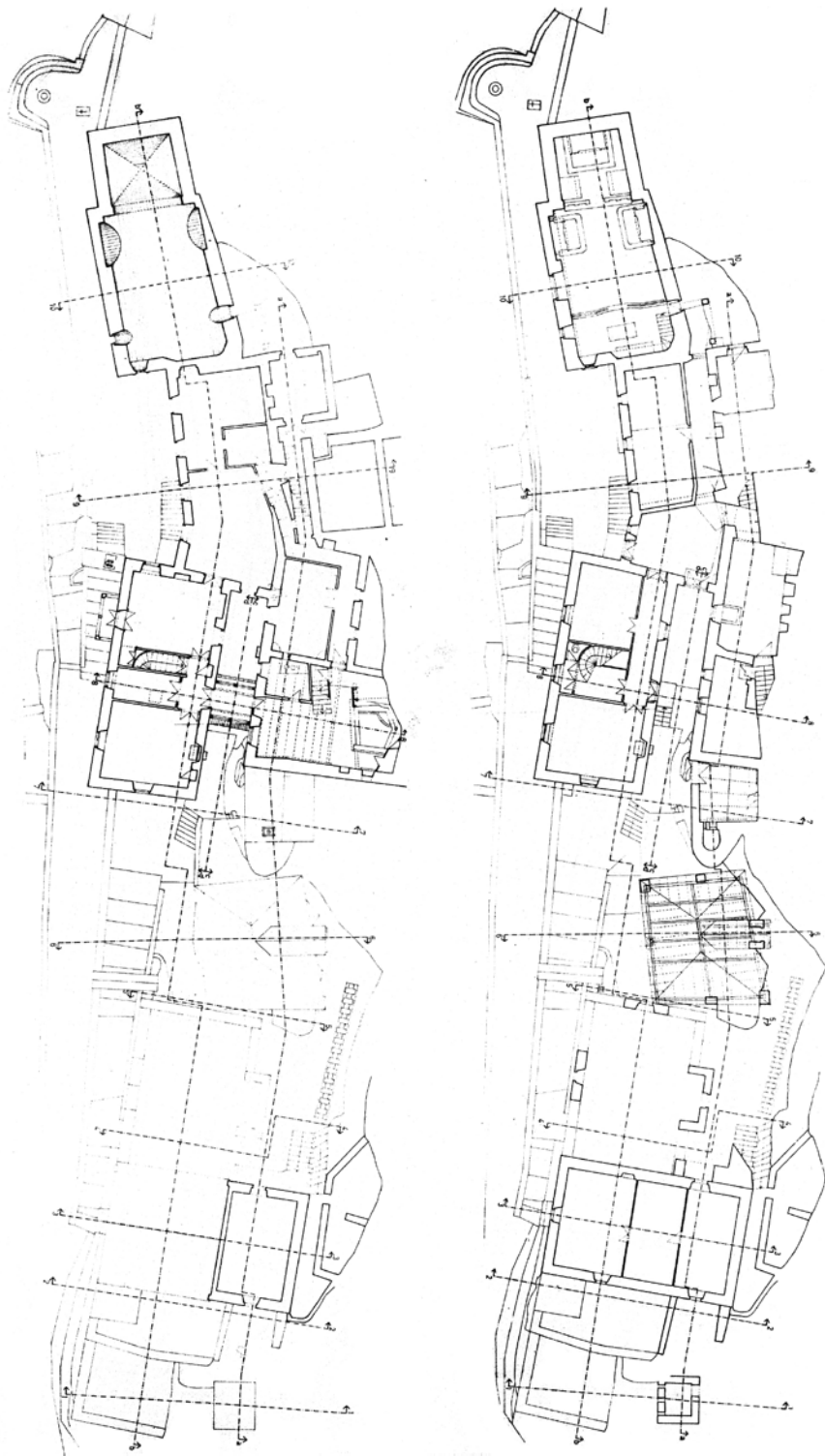
Tlocrt prizemlja i prvog kata Pustinje Blaca (Arhitektonski fakultet u Zagrebu)