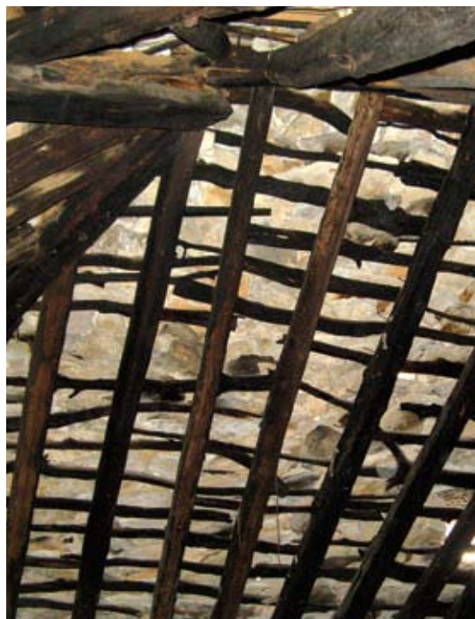
Unutrašnjost krovšta u Veloj kući

više puta pregrađena. U crkvi su tri oltara s palama mletačkih majstora i orgulje na pjevalištu. Uz nju su isprva bile sagrađene kuće za boravak redovnika, gospodarska skladišta i konobe sa trijemovima i krušnim pećima. Najvažnije od svega bile su cisterne za vodu koje su ograničavale veličinu samostanu na onaj broj pustinjaka koji može preživjeti sušne ljetne mjeseci. Sva su dobra samostana bila zajednička, a braća su živjela prema pravilima. Potvrdila je to 1621. vizitacija biskupa Petra Cedulina koja spominje sačuvan pravilnik Pustinja. Taj je tekst sredio i u vlastitoj tiskari objavio upravitelj Pustinja don Nikola Miličević stariji 1897. godine. Gospodarski uspon pustinjačkog samostana zaustavili su veliki požar 1724. godine i povodanj s tučom 1784. koji su gotovo u potpunosti uništili imanja Pustinja Blaca. Samostan je teško podnio te udarce, a broj pustinjaka znatno se smanjio. Pored svih tih nedaća bilo je teško braniti samostan sagrađen na pustom mjestu od gusara i razbojnika koji su, prema tekstu samostanske kronike, pokušali prevarom i silom osvojiti i opljačkati redovnike. Očuvale su ga zidine i oružje iz arsenala danas izloženo u samostanskom muzeju.