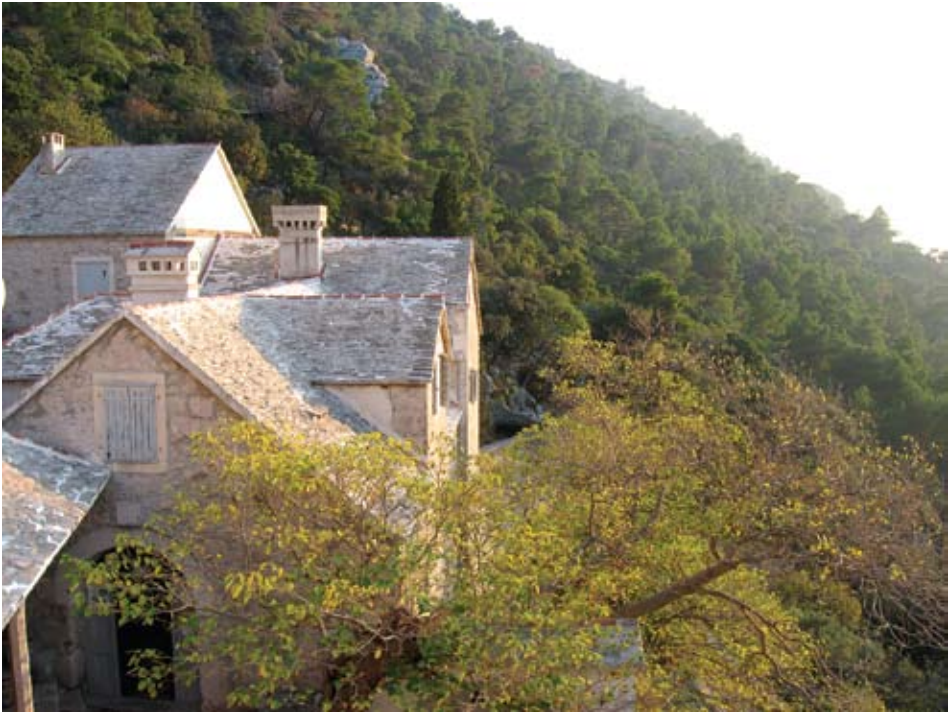
Težačka i Nova kuća u Blacima

20. st. u Blacima se proizvodilo oko deset vagona vina koje se čuvalo u konobama koje je 1897. obnovio don Nikola Milićević stariji i opremio ih turnjevima, bačvama, pumpama i crijevima za pretakanje. U njegovo vrijeme obnovljeni su svi postojeći blatački vinogradi i zasadeni novi na prokrčenim šumskim predjelima. Zasadio ih je autohtonim sortama grožđa, crljenkom, plavcem i bugavom. Uz stočarstvo, maslinarstvo i vinogradarstvo značajan je gospodarski proizvod Pustinja Blaca bio med kojeg se u samostanu iz 330 košnica vrcalo preko vagon i pol. 6 Med se uglavnom proizvodio od vrijeska i kadulje koje su, zajedno s drugim medonosnim biljem, težaci sadili po obroncima blatačkog imanja. Koristio se za zaslađivanje hrane i kao prirodni lijek, ali i za došećeravanje dropa kod proizvodnje vina. Veliki pčelinjak od kamenih i betonskih ploča sagrađen 1905. godine pored samostana imao je 266 košnica, iz kojih se golema količina meda izvozila u Trst i Beč.