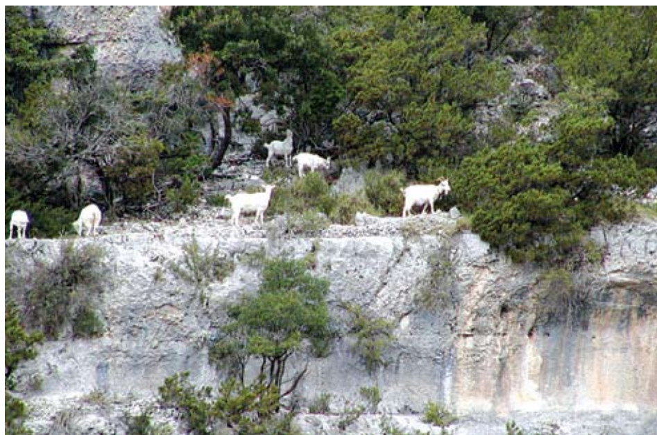
Stado koza na stijenama u dolini Blaca