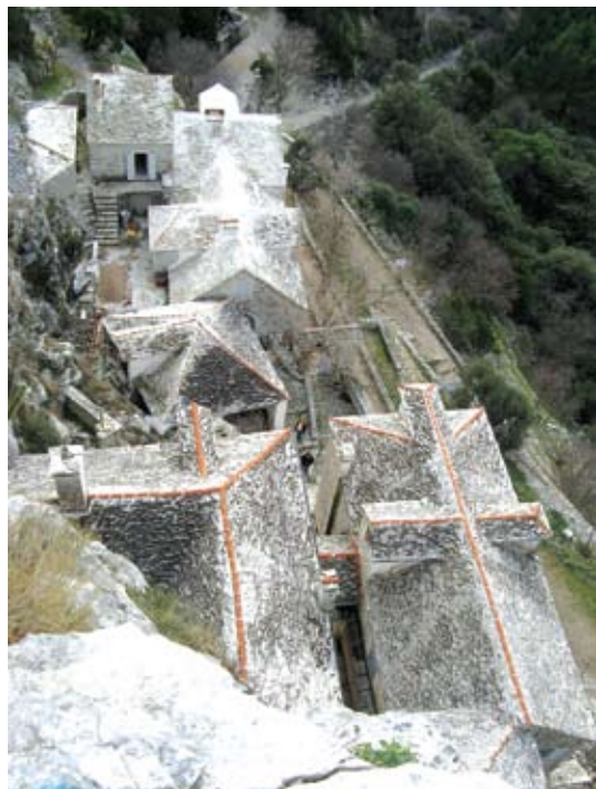
Pogled na kamene krovove