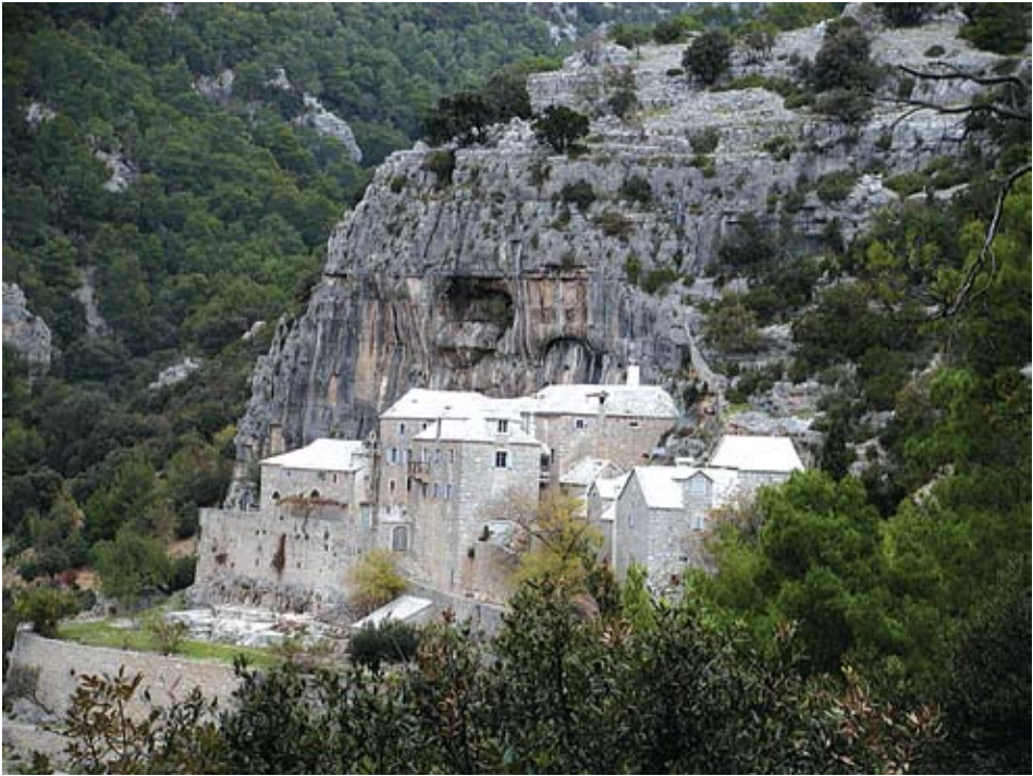
Pogled na Blaca s jugozapada

jezgre pustinjačkih samostana. Zajedno s terasastim poljima zasađenim vinogradima i maslinicima podno vrletnih uzvisina krševitog podneblja pošumljenih "crnikom", mediteranskim hrastom i autohtonom makijom, samostani su postali dio kultiviranog krajolika, likovni akcent u prostoru rijetko naseljene obale Dalmacije 16. stoljeća.