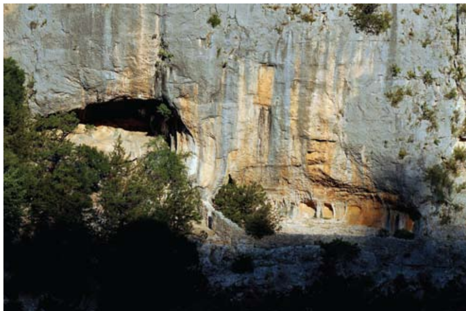
Zagon za ovce na Veloj strani

literarnog rada i pustinjačkog života postati će sastavnim dijelom svakodnevnice renesansne Dalmacije. Njegovim se likom opremaju oltari crkava i kapela, ali i kuća, posebno studiolu, neizostavni dio humanističke kuće i palače. Program sadržan u riječima sv. Jeronima: mihi oppidum carcer et solitudo paradisus est ("grad mi je zatvor, a samoća raj"), bio je temelj povlačenja u osamu egzila kao vlastitog izbora. Pustinjačke zajednice traže samoću, useljavaju u ostatke napuštenih benediktinskih opatija i crkava, a one najradikalnije među njima, poput spomenutih pustinjaka, traže prirodna skloništa, najčešće pećine izvan naseljenih područja u nedirnutom krajoliku.